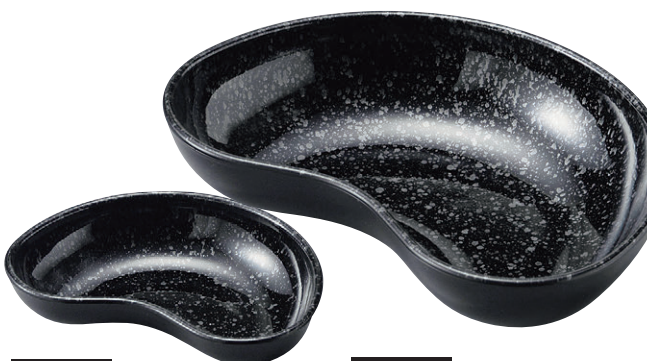
8-545-1 M-23-17 A 5寸 浮雲小鉢 黒油滴 (裏黒塗) ¥1,400 (15.4×10.9×3)