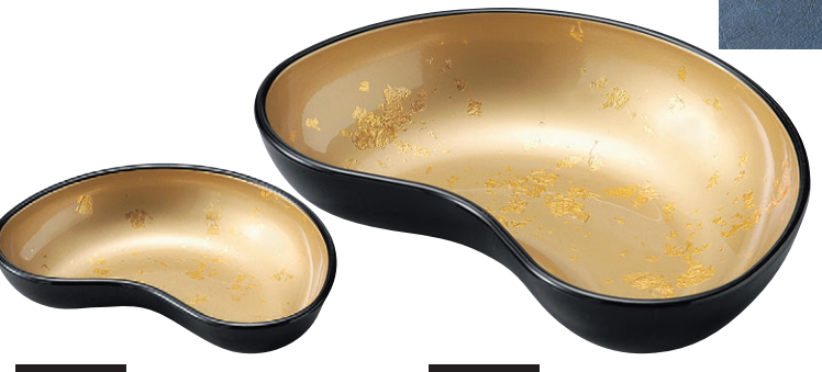
8-545-3 M-23-19 A 5寸 浮雲小鉢 色紙金箔天黒 (裏黒塗) [S-H塗] ¥1,850 (15.4×10.9×3)