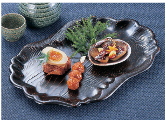
8-546-3 M-7-92 A はなはす盛皿 色紙金箔天黒 [S-H塗] ¥3,300 (32.4×22.2×2) 楕60