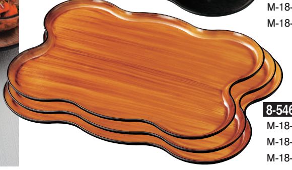
8-546-2 A 雲上盛器 マホガニー木目 (裏黒塗) M-18-13 尺3寸 ¥5,450 (39.7×29.5×4) 楕40 M-18-14 尺4寸 ¥6,200 (42.7×31.7×4) 楕30 M-18-15 尺5寸 ¥6,750 (45.5×34×4.1) 楕30