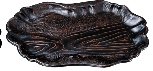
8-546-4 M-7-93 A はなはす盛皿 焼杉 ¥3,800 (32.4×22.2×2) 楕60