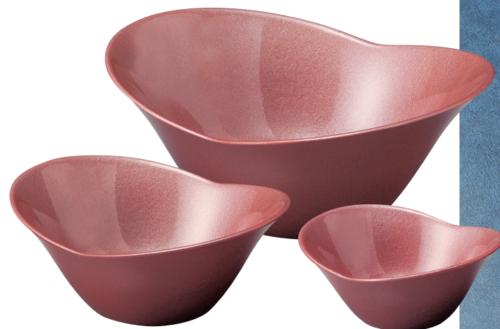
8-545-7 TM 双葉鉢 赤雲流 M-23-23 (小) ¥1,400 (11×9×4.5) 楕100 M-23-24 (中) ¥2,650 (16.5×13.5×6.8) 楕80 M-23-25 (大) ¥4,250 (22×18×9) 楕60