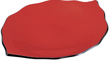
8-546-6 M-12-17 M リーフ皿 本朱洩黒底黒塗 ¥4,550 (36.8×28.6×3.7) 楕20