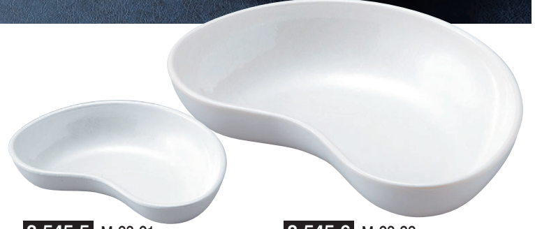
8-545-5 M-23-21 PBT 5寸 浮雲小鉢 ホワイトアクア (裏白塗) ¥1,450 (15.4×10.9×3)