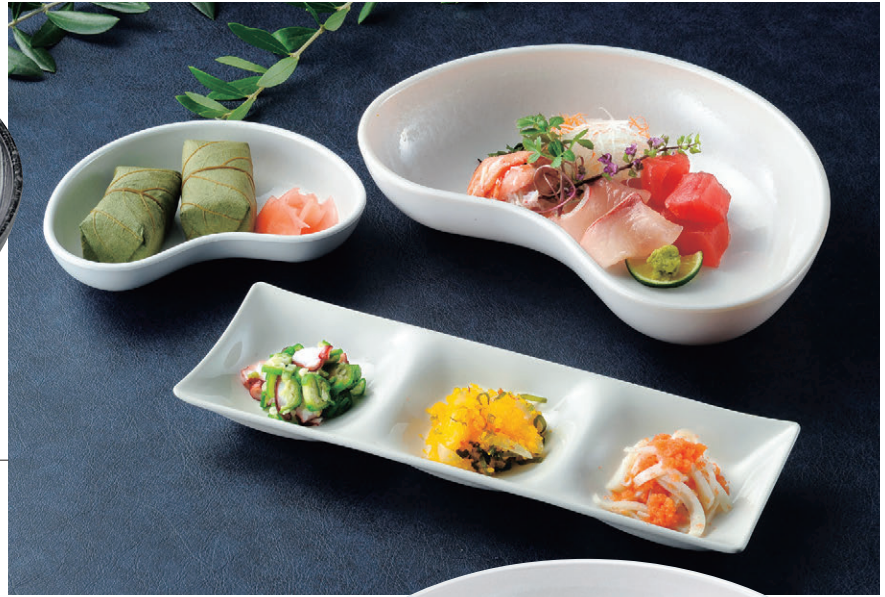
8-545-2 M-23-18 A 8寸 浮雲盛鉢 黒油滴 (裏黒塗) ¥2,500 (24×17×4.8)