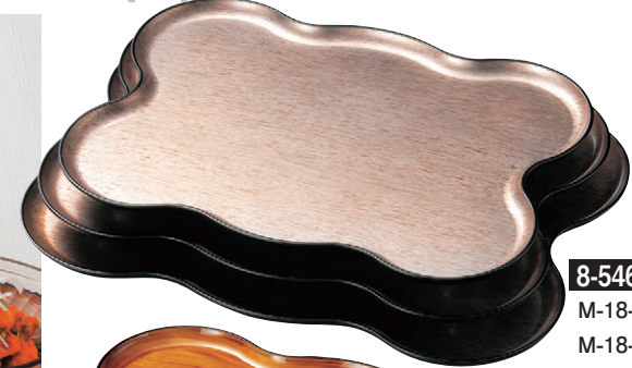
8-546-1 A 雲上盛器 ブロンズ刷毛目 (裏黒塗) M-18-10 尺3寸 ¥5,450 (39.7×29.5×4) 楕40 M-18-11 尺4寸 ¥6,200 (42.7×31.7×4) 楕30 M-18-12 尺5寸 ¥6,750 (45.5×34×4.1) 楕30