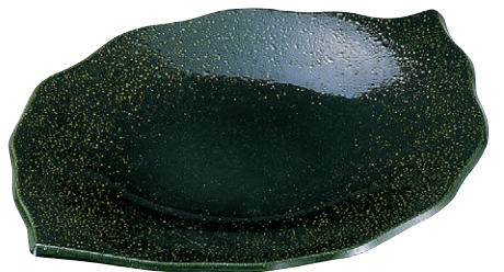
8-546-5 M-12-18 M リーフ皿 織部 ¥5,900 (36.8×28.6×3.7) 楕20