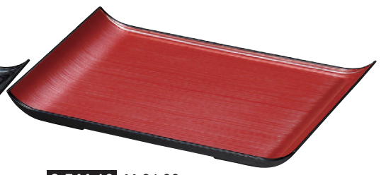
8-544-10 M-24-96 Aアールトレー 朱金刷毛目測黒 ¥2,300 (27.5×18×2.5) 幅80