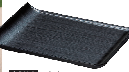
8-544-9 M-24-95 Aアールトレー 黒銀刷毛目測黒 ¥2,300 (27.5×18×2.5) 幅80