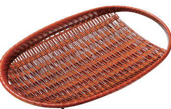
8-543-4 M-30-23 A小判片空きかご 春慶底黒塗 ¥1,400 (26.2×16.7×2.6) 幅100