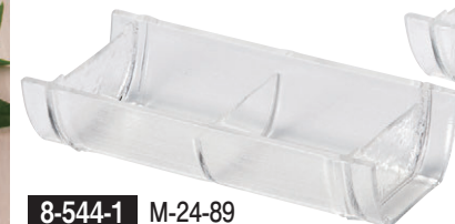
8-544-1 M-24-89 AC竹取盛器 二点盛り 透明 ¥1,700 (21×10.1×4.8) 幅80