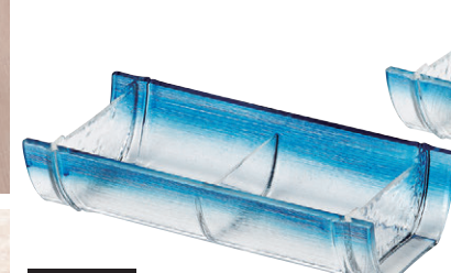
8-544-3 M-24-91 AC竹取盛器 二点盛り ブルーぼかし ¥2,350 (21×10.1×4.8) 幅80