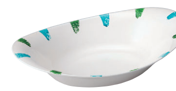
8-543-10 M-31-35 PET 8.5寸小判ペーカ一皿 二色彩 ¥3,300 (26×17×5.8) 幅60