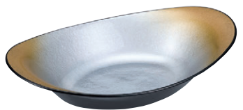
8-543-8 M-31-33 A 7寸小判ペーカ一皿 銀雲金ぼかし底黒 ¥2,400 (22×14.5×5) 幅80