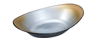
8-543-6 M-31-31 A 6寸小判ペーカ一皿 銀雲金ぼかし底黒 ¥1,950 (18.3×11.8×4) 幅100