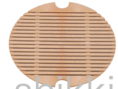
8-544-13 1-706-2A AP目皿(18.5φ) ¥780 (18.5φ) 幅200