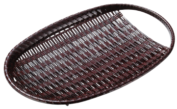
8-543-3 M-30-22 A小判片空きかご 溜底黒塗 ¥1,250 (26.2×16.7×2.6) 幅100