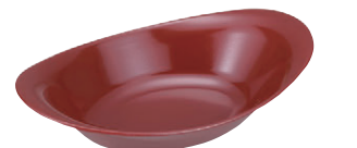
8-543-5 M-31-30 PET 6寸小判ペーカ一皿 総銀朱 ¥1,050 (18.3×11.8×4) 幅100