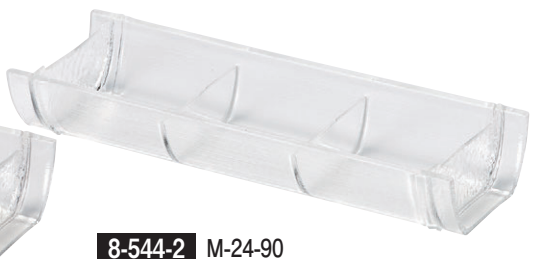
8-544-2 M-24-90 AC竹取盛器 三点盛り 透明 ¥2,200 (29.8×10.1×4.8) 幅60