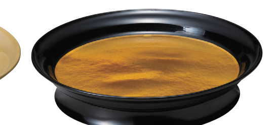
8-544-12 M-24-98 Aみやこ丸高台盛器 金雲流つば黒(裏塗) ¥3,650 (24.3φ×5) 幅40