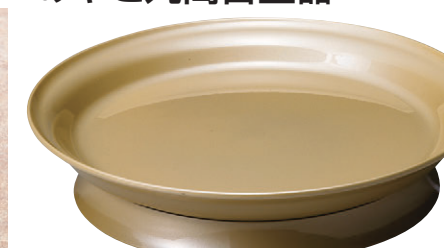
8-544-11 M-24-97 Aみやこ丸高台盛器 ベージュパール(裏塗) ¥2,750 (24.3φ×5) 幅40