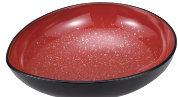
8-543-11 M-31-36 PET 7.5寸しずく片口鉢 赤銀津軽底黒 ¥2,700 (22.5×19×5.5) 幅60