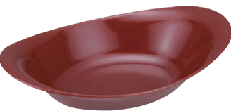
8-543-7 M-31-32 PET 7寸小判ペーカ一皿 総銀朱 ¥1,500 (22×14.5×5) 幅80