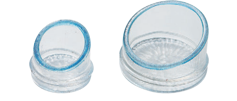
8-544-6 H-177-30 ACハス切珍味(大) 透明 ¥300 (6.2φ×3.8)