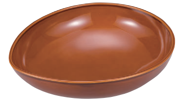
8-543-12 M-31-37 PET 7.5寸しずく片口鉢 漆調春慶 ¥3,300 (22.5×19×5.5) 幅60