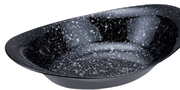
8-543-9 M-31-34 PET 8.5寸小判ペーカ一皿 黒銀津軽底黒 ¥2,700 (26×17×5.8) 幅60