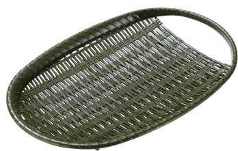
8-543-2 M-30-21 A小判片空きかご グリーン ¥1,050 (26.2×16.7×2.6) 幅100