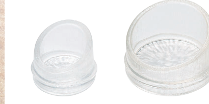
8-544-5 H-177-29 ACハス切珍味(小) 透明 ¥200 (4.2φ×3.5)