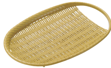
8-543-1 M-30-20 A小判片空きかご 白木 ¥1,050 (26.2×16.7×2.6) 幅100