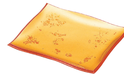
8-480-2 A (小) 清流盛器 1-694-2 色紙金箔測朱 S・H 塗 ¥2,750 (27×22.7×3.3) 梱40