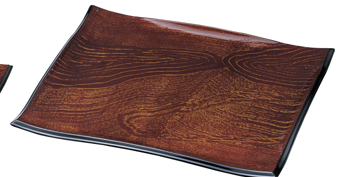
8-480-10 A (大) 清流盛器 シルク木目 M-11-86 ¥7,700 (45.9×38.7×4.7) 梱10