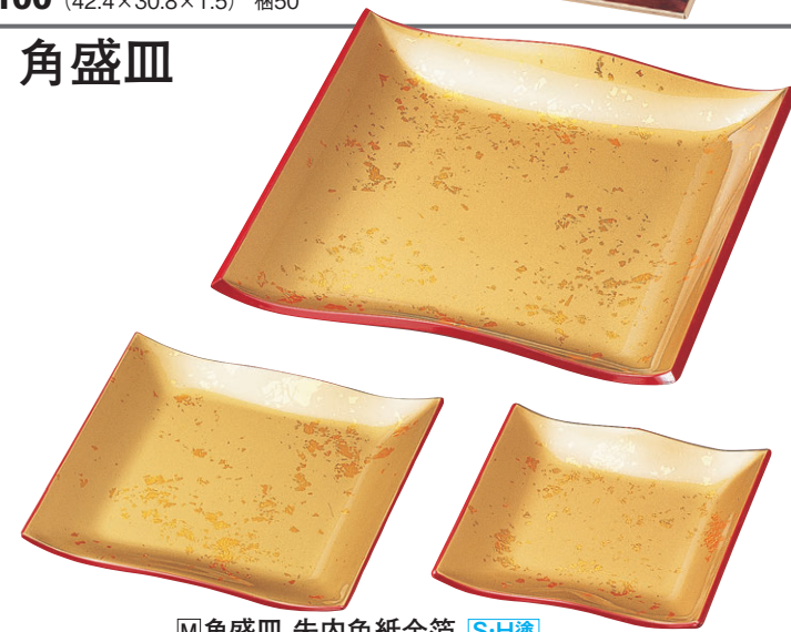
M 角盛皿 朱内色紙金箔 S・H 塗