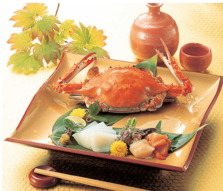
8-479-4 A 長角四方盛皿 紫檀天金 M-10-97 ¥4,100 (42.4×30.8×1.5) 梱50