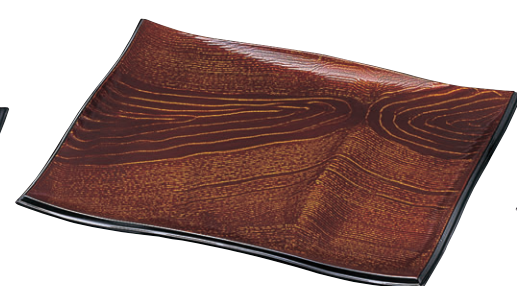
8-480-9 A (中) 清流盛器 シルク木目 M-11-85 ¥4,600 (35.7×29.6×4.1) 梱20