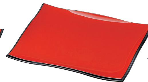
8-480-6 A (中) 清流盛器 朱測黒 M-11-82 ¥2,450 (35.7×29.6×4.1) 梱20