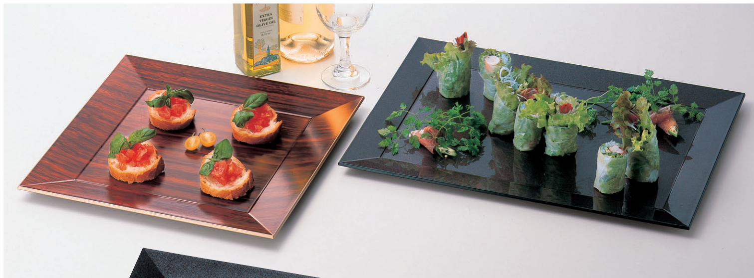
8-479-1 A 四方角皿 オーシャンパール測黒 M-1-99 ¥2,500 (31.8×31.8×1.7) 梱40