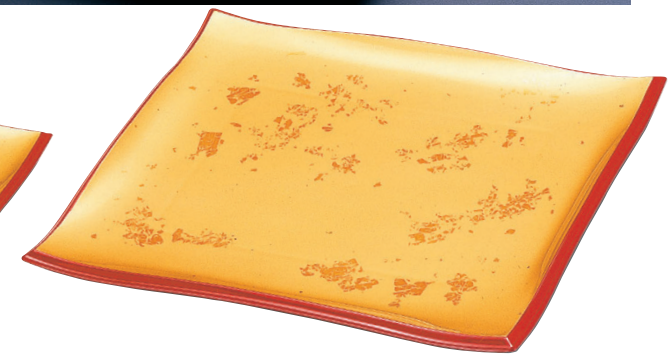
8-480-4 A (大) 清流盛器 1-694-4 色紙金箔測朱 S・H 塗 ¥6,700 (45.9×38.7×4.7) 梱10