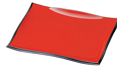
8-480-5 A (小) 清流盛器 朱測黒 M-11-81 ¥1,750 (27×22.7×3.3) 梱40