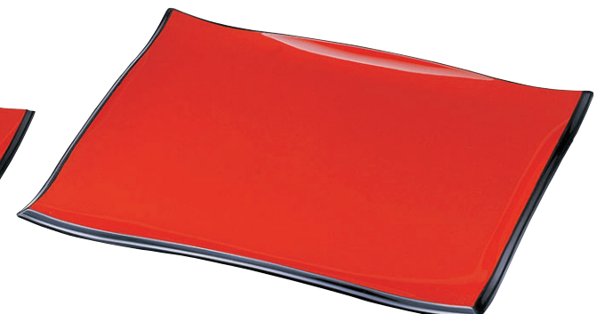
8-480-7 A (大) 清流盛器 朱測黒 M-11-83 ¥4,950 (45.9×38.7×4.7) 梱10