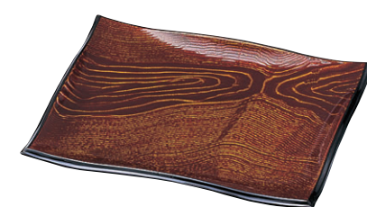
8-480-8 A (小) 清流盛器 シルク木目 M-11-84 ¥3,450 (27×22.7×3.3) 梱40