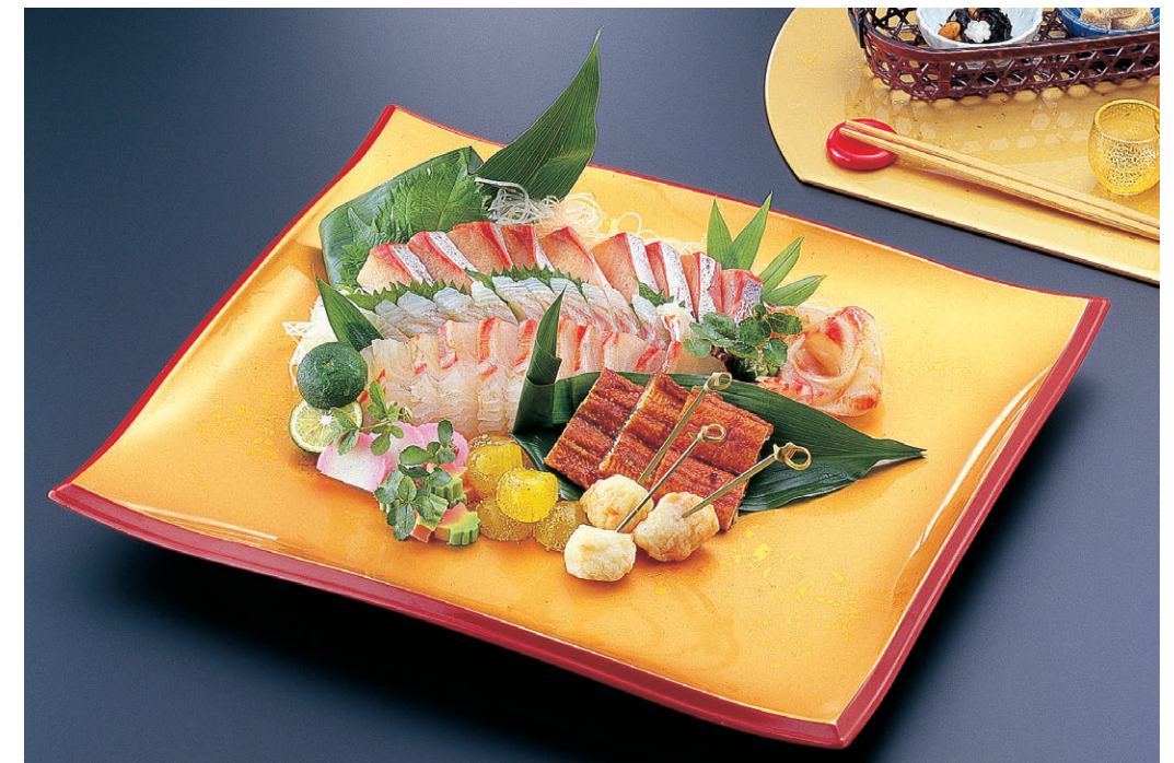
8-480-1 M 8寸長手清流盛器 1-694-1 色紙金箔測朱 S・H 塗 ¥2,350 (24×14.8×3) 梱50