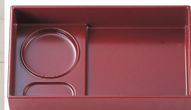
8-454-9 F-1-70 A 平安箱 銀朱 ¥1,500 (20.2×11.9×4.4) 梱80