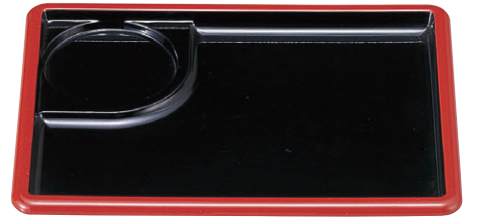
8-454-1 A 立食プレート 黒天朱 1-442-5 ¥600 (18.3×13.6×1.3) 梱150