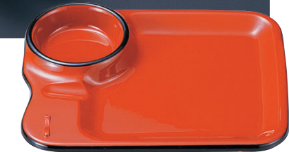
8-454-4 A 立食パーティー皿 朱天黒 M-12-41 ¥980 (21.5×17.5×3) 梱100