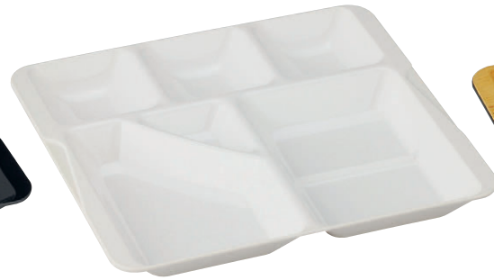
8-453-2 TA パレットプレート 陶磁器調白 S・H 塗 M-20-56 ¥3,200 (28.2×25.5×2) 梱40