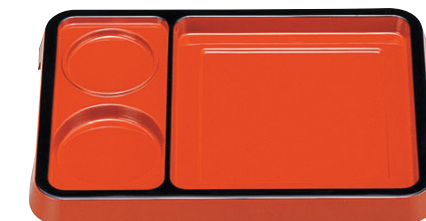
8-454-7 A 宴パーティー皿 1-442-6 朱天黒(オプション別) ¥1,350 (25.7×18.2×2) 梱80 1-534-4A 皿(大)井桁ザル用 竹ス ¥380 (14.8×14.8) 1-559-15 A D.Xつゆ入れ 外朱天朱 ¥700 (8.8φ×6.3) 梱200