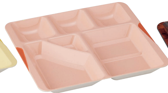
8-453-5 TA パレットプレート パステルオレンジ M-20-59 ¥2,900 (28.2×25.5×2) 梱40