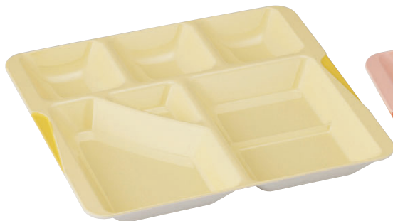
8-453-4 TA パレットプレート パステルイエロー M-20-58 ¥2,900 (28.2×25.5×2) 梱40