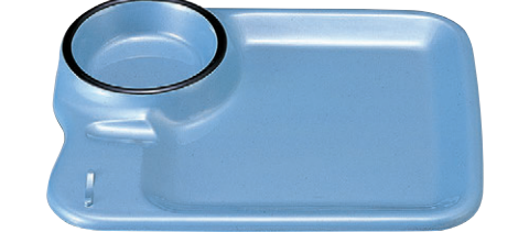
8-454-5 A 立食パーティー皿 ブルー真珠天黒 1-711-2 ¥1,150 (21.5×17.5×3) 梱100