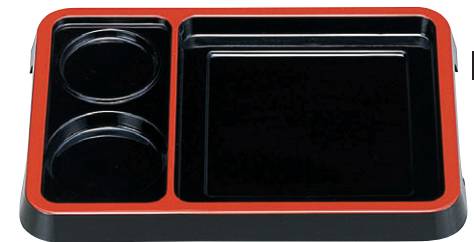
8-454-6 1-442-7 A 宴パーティー皿 黒天朱 ¥1,350 (25.7×18.2×2) 梱80