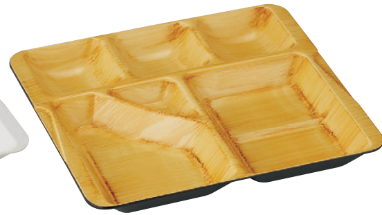
8-453-3 TA パレットプレート 白木塗 M-20-57 ¥3,300 (28.2×25.5×2) 梱40