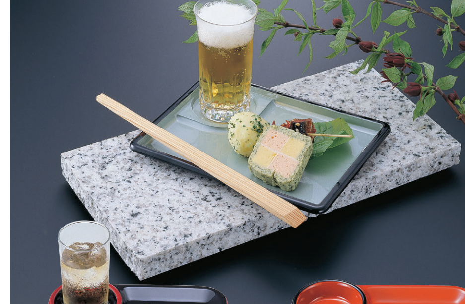
8-454-3 A 立食パーティー皿 黒天朱 1-442-3 ¥935 (21.5×17.5×3) 梱100

*ケチャップ・カレー等の色素の強いものは、すみやかに洗浄して下さい。放置しますと汚れが浸透しますので注意して下さい。