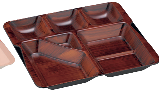
8-453-6 TA パレットプレート 紫檀/黒 M-20-60 ¥3,400 (28.2×25.5×2) 梱40

*ケチャップ・カレー等の色素の強いものは、すみやかに洗浄して下さい。放置しますと汚れが浸透しますので注意して下さい。