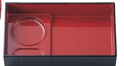
8-454-10 F-1-69 A 平安箱 黒内朱 ¥1,450 (20.2×11.9×4.4) 梱80