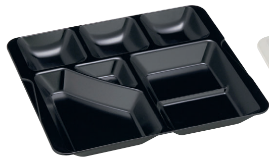
8-453-1 TA パレットプレート 黒 M-20-55 ¥2,600 (28.2×25.5×2) 梱40