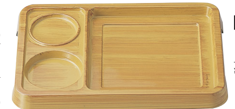
8-454-8 M-12-42 A 宴パーティー皿 白木 ¥1,450 (25.7×18.2×2) 梱80