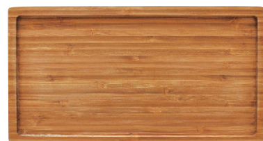
8-403-6 R-15-23 GNトレイ(1/3) ¥3,700 (32.5×17.5×1.5) 櫃40