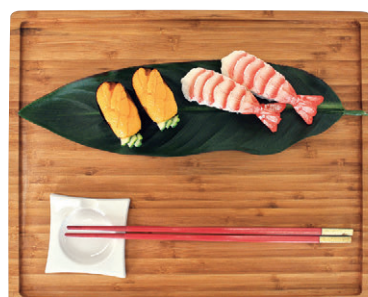
8-403-5 R-15-22 GNトレイ(1/2) ¥4,300 (32.5×26.5×1.5) 櫃30