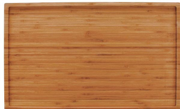
8-403-4 R-15-21 GNトレイ(1/1) ¥5,900 (53.5×32.5×1.5) 櫃20