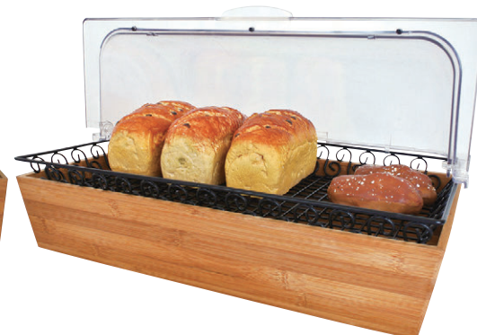
8-403-13 R-15-30 バンブーショーケースセット タイプA ¥30,700 櫃1 コンテナ(53×32.5×10) 回転カバー(53.5×33.4×17) アイアンバスケット(50.8×33×5)