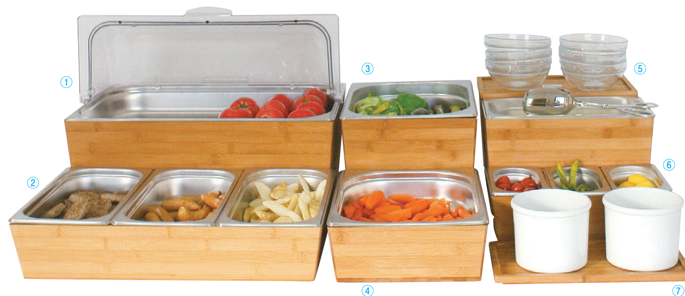
8-404-1 R-15-31 バンブーショーケースセット タイプB ¥26,200 櫃1 コンテナ(53×32.5×20) 回転カバー(53.5×33.4×17) ステンパン(1/2)(53×32.5×6.5)