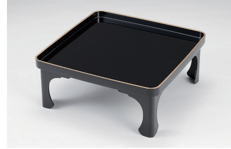
8-368-15 A ニュー胴張角膳 総黒天金 A-11-21 ¥5,400 (36.3×36.3×14.4) 椀10