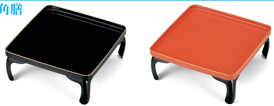
8-367-21 A 新胴張角膳 黒天金 A-3-61 ¥5,000 (36.3×36.3×14.4) 椀10 8-367-22 A 新胴張角膳 朱天金 A-3-62 ¥5,000 (36.3×36.3×14.4) 椀10