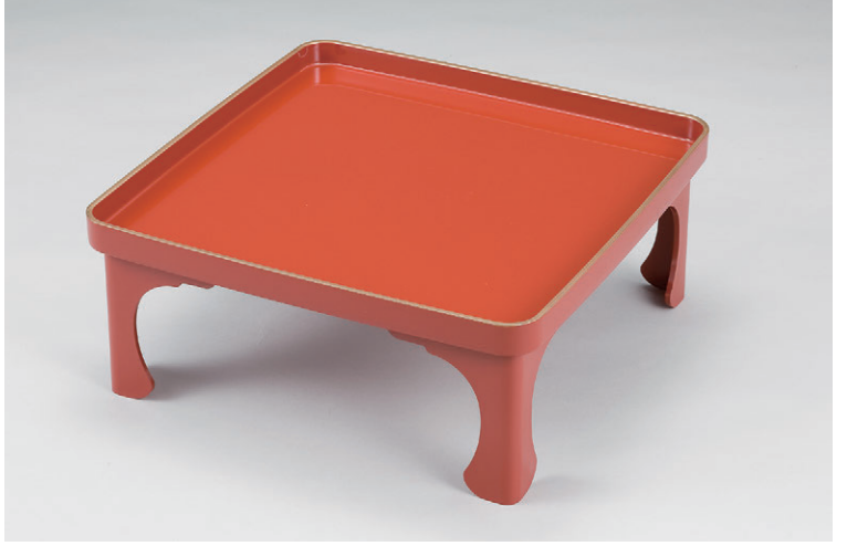
8-368-16 A ニュー胴張角膳 総朱天金 A-11-22 ¥5,400 (36.3×36.3×14.4) 椀10