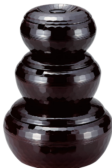
8-365-4 亀甲飯器 溜 W-9-20 A|1人用平なし ¥1,600 W-9-21 A|2人用平付 ¥3,070 W-9-22 A|3人用平付 ¥3,950 W-9-23 A|5人用平付 ¥5,300