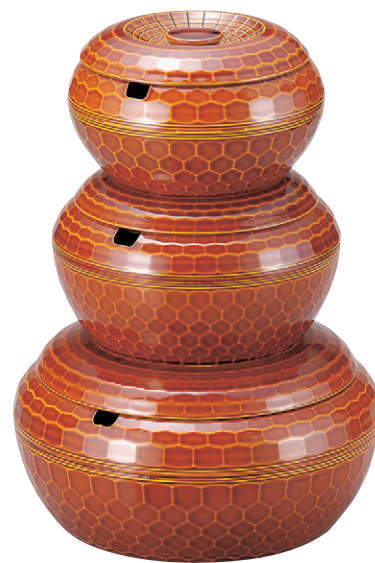
8-365-6 亀甲飯器 漆調春慶内黒塗 W-9-32 A|1人用平なし ¥2,200 W-9-33 A|2人用平付 ¥4,320 W-9-34 A|3人用平付 ¥5,200 W-9-35 A|5人用平付 ¥8,000