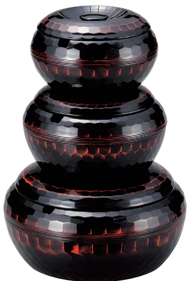
8-365-5 亀甲飯器 曙 W-9-28 A|1人用平なし ¥1,900 W-9-29 A|2人用平付 ¥3,650 W-9-30 A|3人用平付 ¥4,650 W-9-31 A|5人用平付 ¥6,700