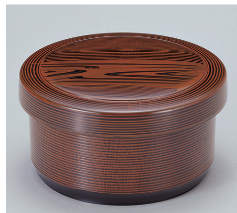
8-366-9 A|保温飯器 木目(3人用)ヘラ付 1-231-9 ¥5,400 (25.2φ×14・内寸20.8φ×8.9) 椀20