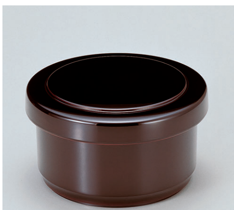
8-366-11 A|保温飯器 溜(2人用)ヘラ付 1-231-11 ¥4,620 (22.5φ×13・内寸18φ×8) 椀26