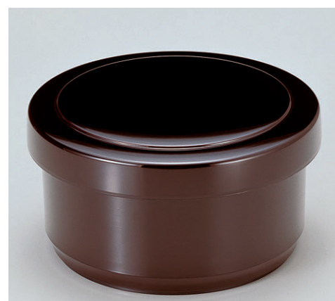
8-366-12 A|保温飯器 溜(3人用)ヘラ付 1-231-12 ¥5,500 (25.2φ×14・内寸20.8φ×8.9) 椀20