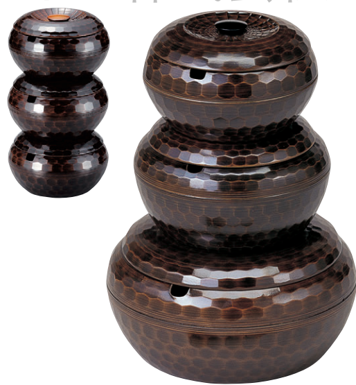
8-365-1 亀甲飯器 栃内黒塗 W-2-70 A|1人用平なし ¥1,650 1-230-23 A|2人用平付 ¥3,920 1-230-24 A|3人用平付 ¥5,000 1-230-25 A|5人用平付 ¥6,350