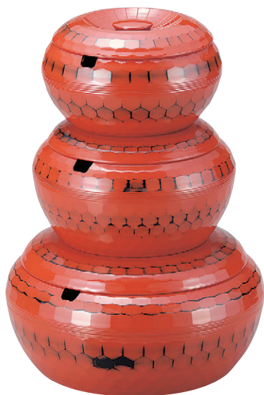
8-365-3 亀甲飯器 根来 W-9-24 A|1人用平なし ¥1,750 W-9-25 A|2人用平付 ¥3,320 W-9-26 A|3人用平付 ¥4,150 W-9-27 A|5人用平付 ¥5,600