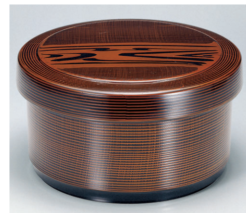
8-366-10 A|保温飯器 木目(5人用)ヘラ付 1-231-10 ¥7,100 (28φ×15.7・内寸23.7φ×10.3) 椀12