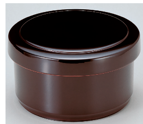
8-366-13 A|保温飯器 溜(5人用)ヘラ付 1-231-13 ¥7,200 (28φ×15.7・内寸23.7φ×10.3) 椀12