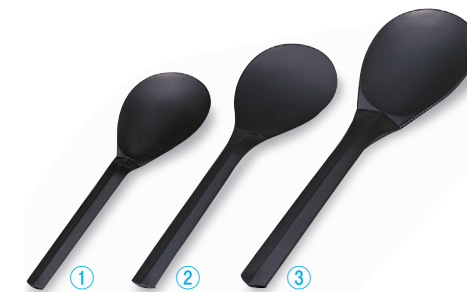
8-366-1 P.P|小)ヘラ (1~2人用) 1-231-1 ¥220 (16.9×4.6) 椀300 8-366-2 P.P|中)ヘラ (3人用) 1-231-2 ¥250 (19.5×5.5) 椀200 8-366-3 P.P|大)ヘラ (5人~10人用) 1-231-3 ¥350 (22.3×6) 椀200