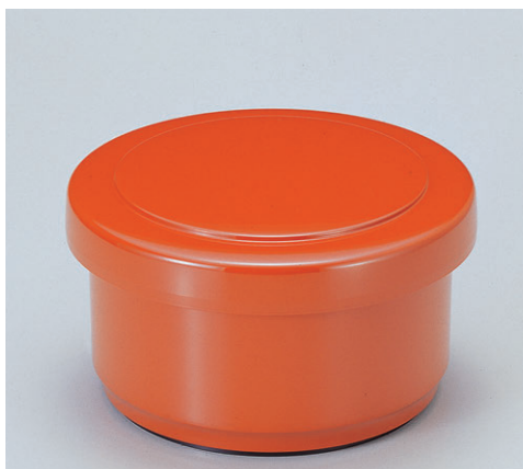
8-366-5 A|保温飯器 朱(2人用)ヘラ付 1-231-5 ¥4,220 (22.5φ×13・内寸18φ×8) 椀26