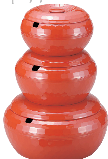
8-365-2 亀甲飯器 朱 W-9-16 A|1人用平なし ¥1,400 W-9-17 A|2人用平付 ¥2,670 W-9-18 A|3人用平付 ¥3,500 W-9-19 A|5人用平付 ¥4,900