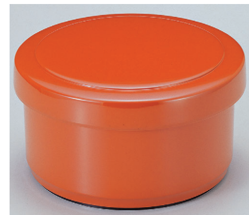
8-366-7 A|保温飯器 朱(5人用)ヘラ付 1-231-7 ¥6,400 (28φ×15.7・内寸23.7φ×10.3) 椀12