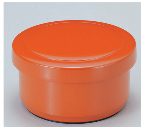
8-366-6 A|保温飯器 朱(3人用)ヘラ付 1-231-6 ¥4,900 (25.2φ×14・内寸20.8φ×8.9) 椀20