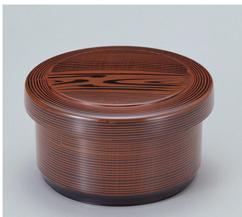
8-366-8 A|保温飯器 木目(2人用)ヘラ付 1-231-8 ¥4,620 (22.5φ×13・内寸18φ×8) 椀26