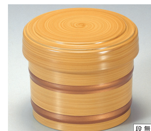
8-355-6 A 桶飯器 白木帯金内朱 1-225-9 ¥1,650 (11φ×8.8・内寸9.5φ×7.4) 楕100 470cc