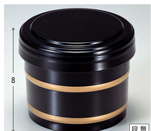
8-355-4 A 桶飯器 黒帯金内朱 1-225-7 ¥1,550 (11φ×8.8・内寸9.5φ×7.4) 楕100 470cc