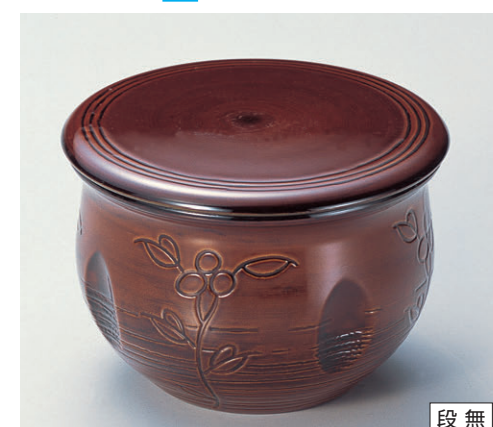
8-355-2 TA 花紋飯器 春慶木目内黒塗 W-7-88 ¥2,300 (10.3φ×7・内寸9.3φ×5.8) 楕100 290cc