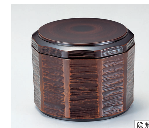
8-356-3 TA 低型木彫一人用飯器 枹 W-3-60 ¥2,100 (10.5φ×8.5・内寸10.1φ×5.9) 楕100 350cc