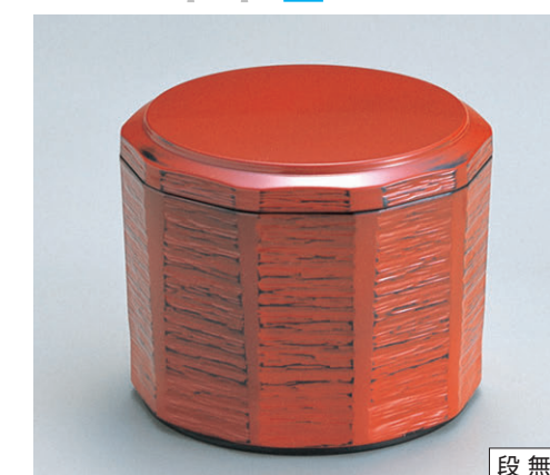
8-356-2 TA 低型木彫一人用飯器 根来 W-3-59 ¥2,100 (10.5φ×8.5・内寸10.1φ×5.9) 楕100 350cc