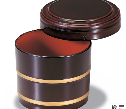
8-355-5 A 桶飯器 溜帯金内朱 1-225-8 ¥1,600 (11φ×8.8・内寸9.5φ×7.4) 楕100 470cc