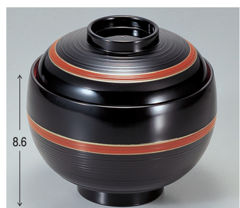
8-355-7 A 卵型飯器 黒に帯朱内朱 W-7-90 ¥1,950 (12φ×11.7・内寸11φ×7.1) 楕100 500cc