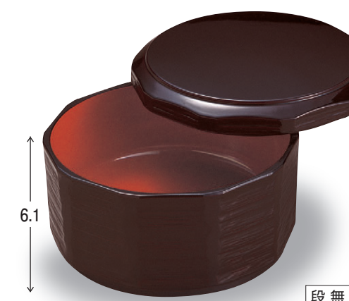
8-356-7 TA ミニ木彫飯器 溜内朱 W-3-20 ¥2,050 (13φ×8・内寸12.1φ×5.2) 楕100 500cc