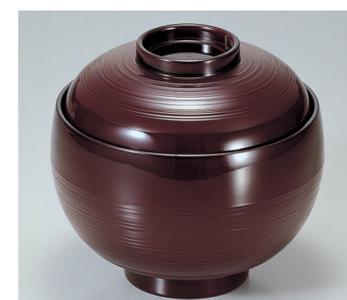
8-355-9 A 卵型飯器 溜内黒塗 W-7-92 ¥1,950 (12φ×11.7・内寸11φ×7.1) 楕100 500cc