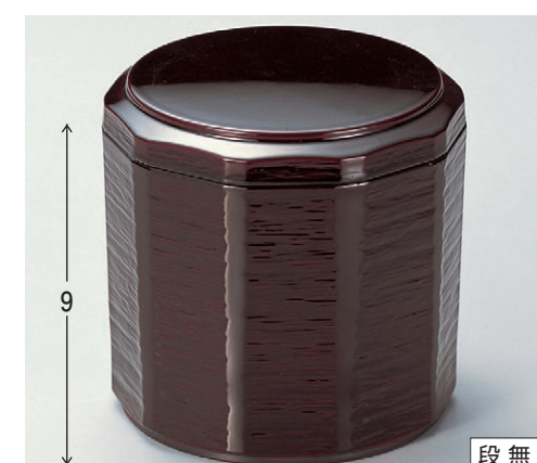
8-356-4 TA 深型木彫一人用飯器 溜内朱 W-3-21 ¥2,000 (10.5φ×10.5・内寸10.1φ×7.9) 楕100 500cc