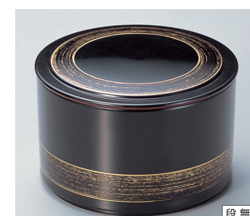
8-356-11 TA 筒型飯器 黒かすり内朱 W-7-97 ¥1,700 (11.5φ×7.6・内寸10.7φ×6) 楕100 500cc