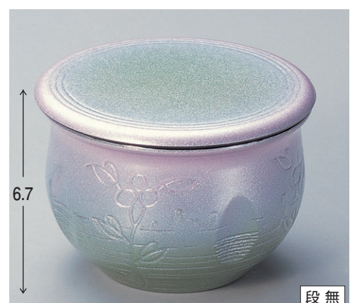
8-355-1 TA 花紋飯器 ピンク緑パール内黒塗 W-7-87 ¥2,000 (10.3φ×7・内寸9.3φ×5.8) 楕100 290cc