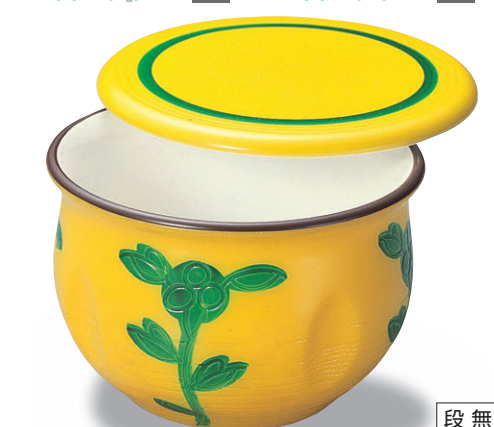
8-355-3 TA 花紋飯器 黄グリーン花内白 W-7-89 ¥2,500 (10.3φ×7・内寸9.3φ×5.8) 楕100 290cc