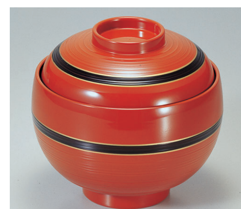
8-355-8 A 卵型飯器 朱に帯黒内黒塗 W-7-91 ¥1,950 (12φ×11.7・内寸11φ×7.1) 楕100 500cc