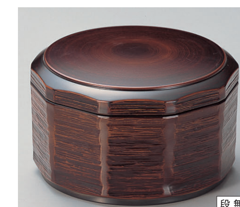
8-356-9 TA ミニ木彫飯器 枹 W-3-15 ¥2,150 (13φ×8・内寸12.1φ×5.2) 楕100 500cc