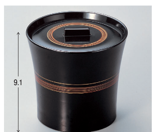
8-355-10 TA 水仙飯器 黒ライン内黒塗 W-7-95 ¥2,200 (9.8φ×9.5・内寸9.4φ×7.6) 楕100 380cc