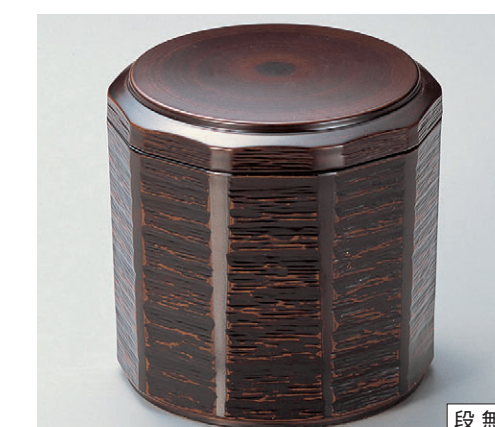
8-356-6 TA 深型木彫一人用飯器 枹 W-3-8 ¥2,150 (10.5φ×10.5・内寸10.1φ×7.9) 楕100 500cc