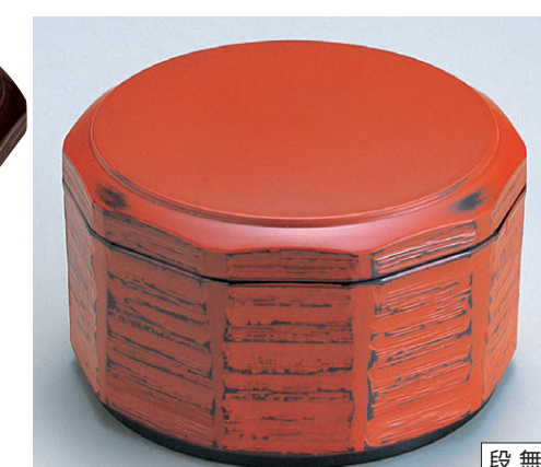
8-356-8 TA ミニ木彫飯器 根来 W-3-16 ¥2,350 (13φ×8・内寸12.1φ×5.2) 楕100 500cc