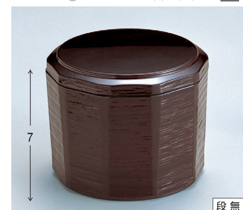
8-356-1 TA 低型木彫一人用飯器 溜内朱 W-3-58 ¥1,950 (10.5φ×8.5・内寸10.1φ×5.9) 楕100 350cc