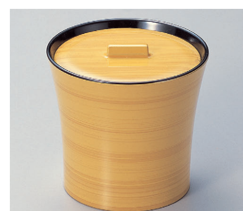
8-355-11 TA 水仙飯器 白木内黒塗 W-7-94 ¥3,100 (9.8φ×9.5・内寸9.4φ×7.6) 楕100 380cc