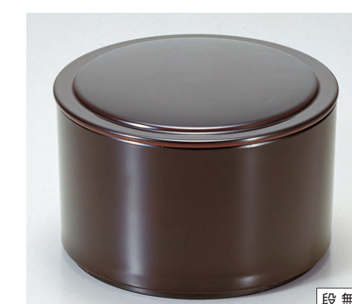
8-356-12 TA 筒型飯器 溜内朱 1-223-9 ¥1,800 (11.5φ×7.6・内寸10.7φ×6) 楕100 500cc