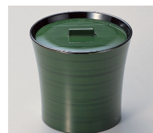
8-355-12 TA 水仙飯器 グリーン木目内黒塗 W-7-93 ¥3,100 (9.8φ×9.5・内寸9.4φ×7.6) 楕100 380cc