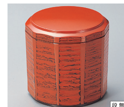
8-356-5 TA 深型木彫一人用飯器 根来 W-3-9 ¥2,150 (10.5φ×10.5・内寸10.1φ×7.9) 楕100 500cc