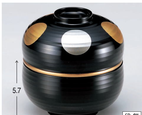
8-353-5 M3.5寸ひさご弁当 W-11-34 黒金銀箔日月内黒塗(中子付) ¥3,950 (10.5φ×11・内寸9.8φ×4.9) 楕70 330cc