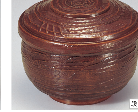
8-354-9 A宝飯器 枋内黒塗 1-222-6 ¥2,400 (12.2φ×9.5・内寸10.3φ×6.7) 楕100 500cc