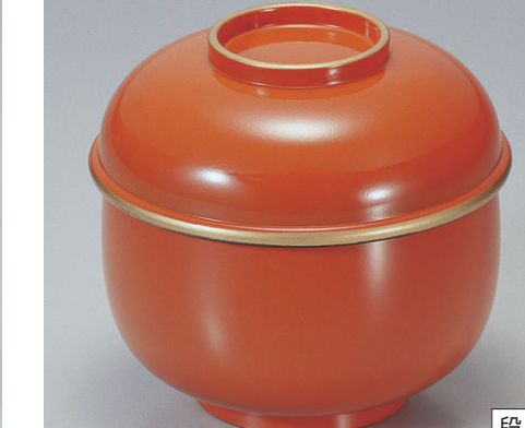
8-354-6 M新鈴型飯器 朱帯金 1-227-6 ¥1,650 (11.8φ×10.8・内寸10.4φ×6.3) 楕100 480cc