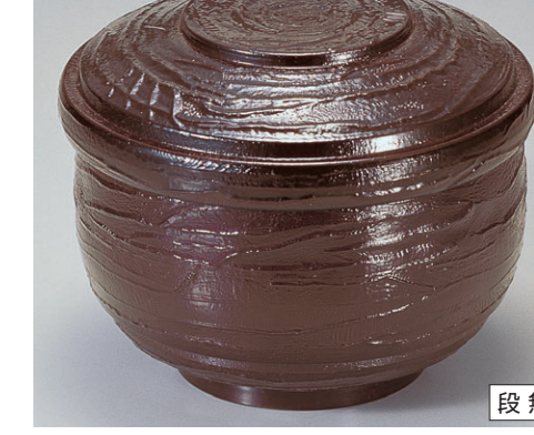
8-354-8 A宝飯器 溜内朱 1-222-5 ¥2,200 (12.2φ×9.5・内寸10.3φ×6.7) 楕100 500cc