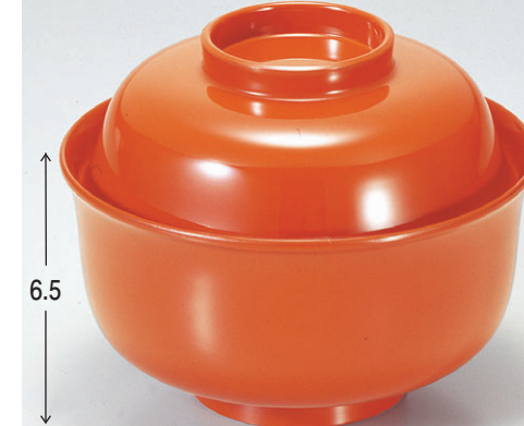
8-354-10 TM4寸羽反椀 総洗朱 1-201-7 ¥1,750 (12.1φ×9.6・内寸10.7φ×5.2) 楕100 330cc