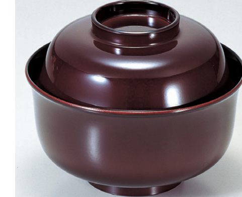
8-354-11 TM4寸羽反椀 溜内黒塗 1-201-8 ¥1,950 (12.1φ×9.6・内寸10.7φ×5.2) 楕100 330cc