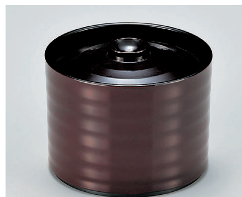
8-353-10 A昇月飯器 溜 W-12-44 ¥1,450 (9.5φ×7.7) 楕100 220cc