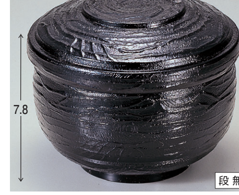
8-354-7 A宝飯器 黒内朱 1-222-4 ¥1,950 (12.2φ×9.5・内寸10.3φ×6.7) 楕100 500cc