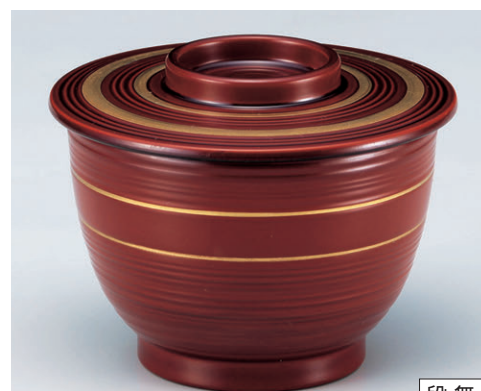
8-353-13 Mロクロかぶせ椀 ウルミ金ライン内黒塗 W-11-36 ¥2,250 (12.3φ×9.7・内寸10.8φ×6.7) 楕80 460cc