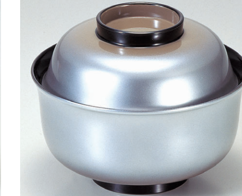
8-354-12 TM4寸羽反椀 ベージュかすみ内黒塗 1-201-9 ¥2,200 (12.1φ×9.6・内寸10.7φ×5.2) 楕100 330cc