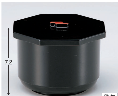
8-353-1 Mミニ切立飯器 黒内朱 W-11-24 ¥1,900 (11.4×10.6×7.9・内寸9.3φ×6.5) 楕100 410cc