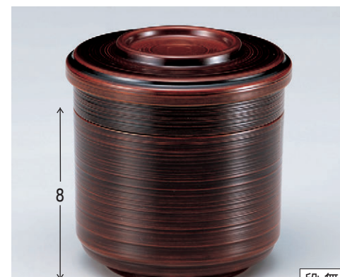
8-353-7 M3.7寸刷毛目飯器 枋内黒塗 W-11-30 ¥2,500 (11.2φ×9.3・内寸9.8φ×7.3) 楕80 490cc 8-353-8 M3.7寸刷毛目飯器 枋内黒塗2段 W-11-31 ¥3,450 (11.2φ×11.5) 楕60 490cc