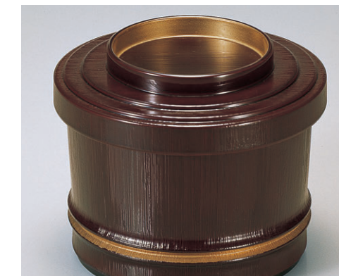
8-354-2 A竹型飯器 溜内朱つば金 1-225-2 ¥1,550 (11.6φ×9.4・内寸10φ×6.3) 楕100 420cc