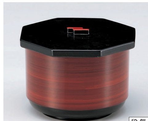
8-353-2 Mミニ切立飯器 チーク木目内朱 W-11-25 ¥2,500 (11.4×10.6×7.9・内寸9.3φ×6.5) 楕100 410cc