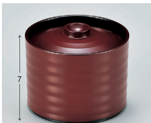
8-353-9 A昇月飯器 銀朱 W-12-43 ¥1,300 (9.5φ×7.7) 楕100 220cc