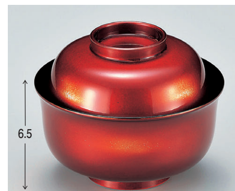
8-353-11 TM4寸羽反椀 朱金別甲 W-12-45 ¥2,300 (12.1φ×9.6) 楕100 330cc