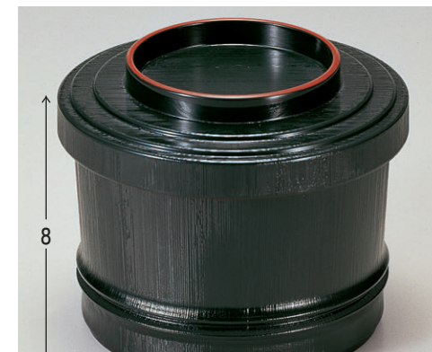
8-354-1 A竹型飯器 グリーン内朱天朱 1-225-1 ¥1,300 (11.6φ×9.4・内寸10φ×6.3) 楕100 420cc