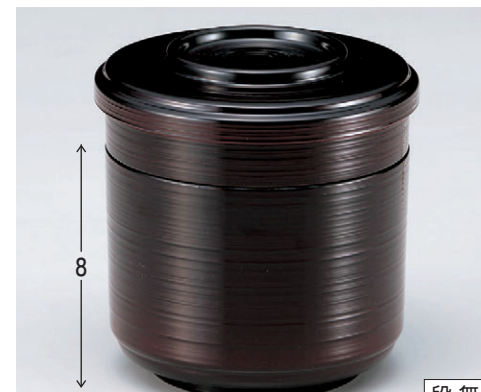
8-353-3 M3.7寸刷毛目飯器 溜内朱1段 W-11-26 ¥2,300 (11.2φ×9.3・内寸9.8φ×7.3) 楕80 490cc 8-353-4 M3.7寸刷毛目飯器 溜内朱2段 W-11-27 ¥3,200 (11.2φ×11.5) 楕60 490cc