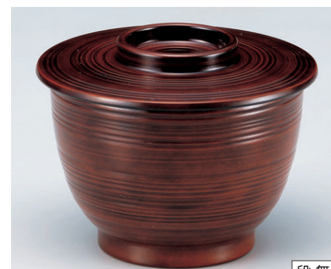
8-353-14 Mロクロかぶせ椀 枋内黒塗 W-11-37 ¥2,250 (12.3φ×9.7・内寸10.8φ×6.7) 楕80 460cc