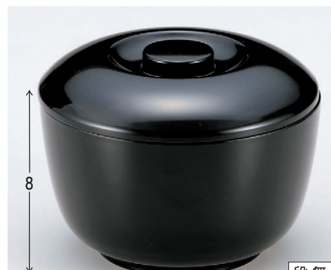
8-353-6 PET古代飯器 黒内朱 W-11-29 ¥1,900 (13.7φ×10.2) 楕80 780cc