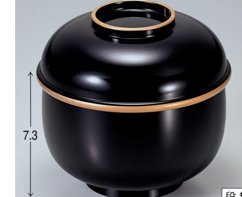
8-354-5 M新鈴型飯器 黒帯金 1-227-5 ¥1,650 (11.8φ×10.8・内寸10.4φ×6.3) 楕100 480cc