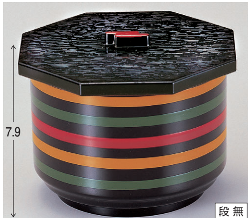
8-351-3 A江戸飯器 ロクロ内朱 W-8-26 ¥1,700 (12.3×11.4×8.6・内寸10φ×7.1) 楕80 500cc