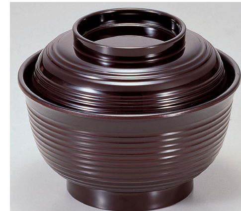
8-352-2 TA美里千筋飯器 溜内黒塗 1-220-10 ¥2,100 (13.4φ×10.5・内寸11.8φ×5.9) 楕100 430cc