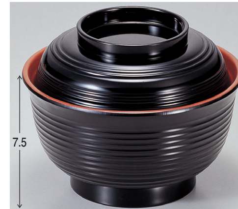
8-352-1 TA美里千筋飯器 黒内朱 1-220-9 ¥1,850 (13.4φ×10.5・内寸11.8φ×5.9) 楕100 430cc