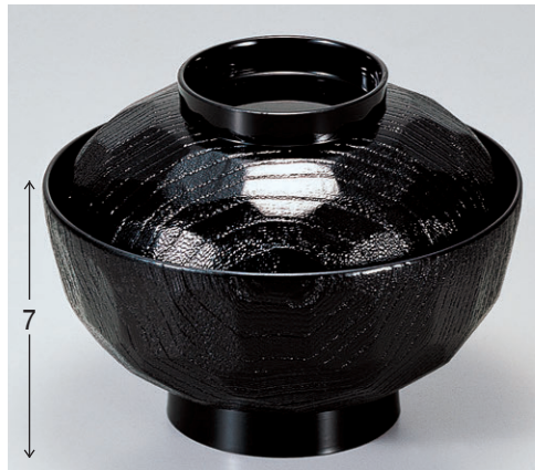
8-351-7 A4.2寸亀甲飯椀 黒内黒塗 1-227-8 ¥1,400 (13.3φ×10.2・内寸12.8φ×5.3) 楕100 300cc