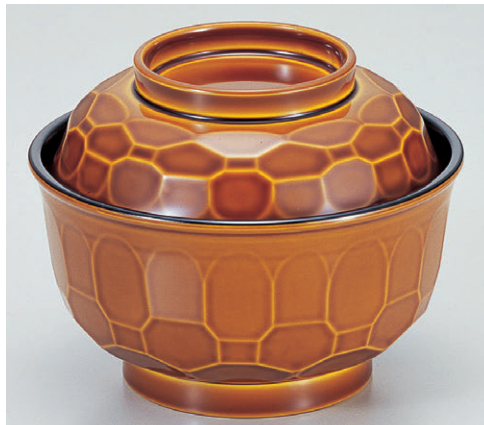
8-351-12 TA真亀甲飯器 漆調春慶内黒塗 1-7-12 ¥2,600 (13.4φ×10.5・内寸12.6φ×6) 楕100 440cc