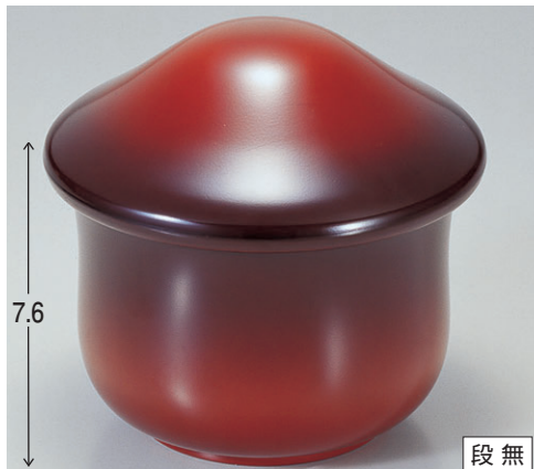
8-351-6 Mきのご飯器 紅かすみ内黒塗 1-226-9 ¥1,900 (12φ×11.7・内寸10.5φ×7) 楕80 500cc