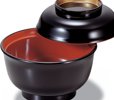
8-352-6 TA4.5寸美里飯器 黒内朱つば金 1-220-1 ¥1,950 (13.4φ×10.5・内寸11.8φ×5.9) 楕100 430cc