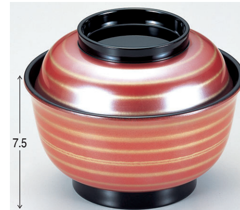
8-352-7 TA4.5寸美里飯器 紅銀ライン内黒塗 W-3-18 ¥2,300 (13.4φ×10.5・内寸11.8φ×5.9) 楕100 430cc