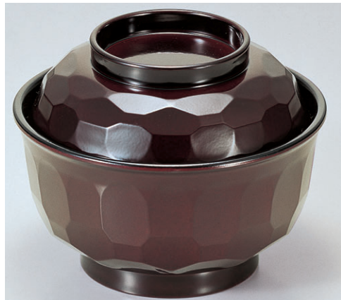
8-351-11 TA真亀甲飯器 溜内黒塗 1-225-11 ¥1,900 (13.4φ×10.5・内寸12.6φ×6) 楕100 440cc