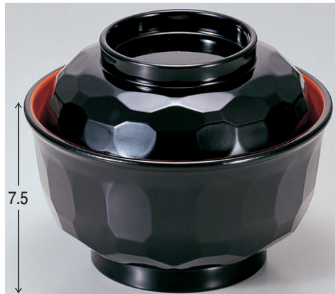
8-351-10 TA真亀甲飯器 黒内朱 1-225-10 ¥1,700 (13.4φ×10.5・内寸12.6φ×6) 楕100 440cc