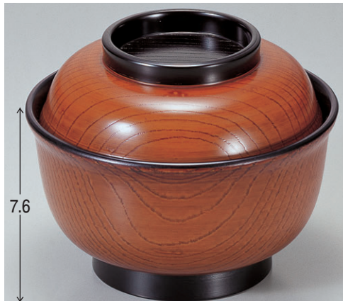
8-351-9 A姫飯器 柘内黒塗 1-227-7 ¥2,150 (13.5φ×10.7・内寸12.7φ×6) 楕100 440cc