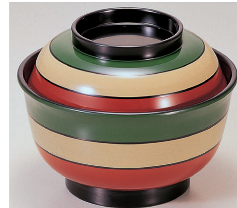
8-352-12 TA4.5寸美里飯器 三色独案内黒塗 1-220-7 ¥3,250 (13.4φ×10.5・内寸11.8φ×5.9) 楕100 430cc