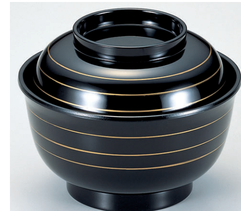
8-352-8 TA4.5寸美里飯器 黒金ライン内黒塗 W-7-84 ¥2,250 (13.4φ×10.5・内寸11.8φ×5.9) 楕100 430cc