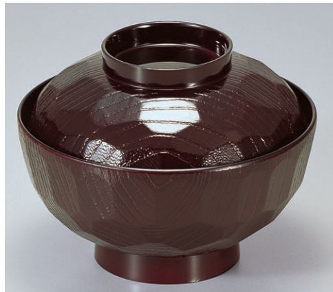
8-351-8 A4.2寸亀甲飯椀 溜内黒塗 1-227-9 ¥1,550 (13.3φ×10.2・内寸12.8φ×5.3) 楕100 300cc