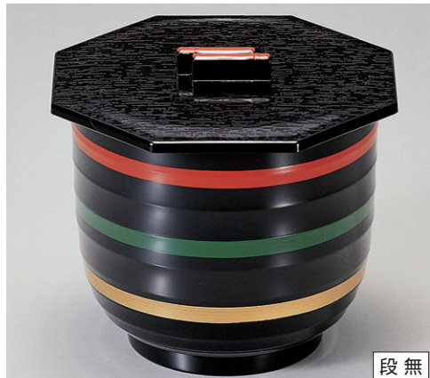
8-351-2 Aロクロ目飯器 ロクロ筋 1-226-2 ¥1,800 (11.2φ×10.2・内寸9.4φ×7.9) 楕100 420cc