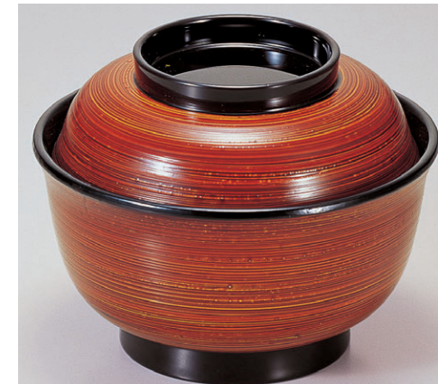
8-352-11 TA4.5寸美里飯器 春慶刷毛目内黒塗 1-220-3 ¥2,450 (13.4φ×10.5・内寸11.8φ×5.9) 楕100 430cc