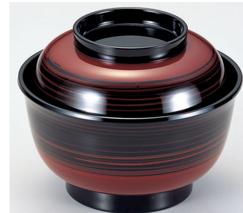
8-352-9 TA4.5寸美里飯器 溜筋目塗り分け内黒塗 W-7-85 ¥2,350 (13.4φ×10.5・内寸11.8φ×5.9) 楕100 430cc