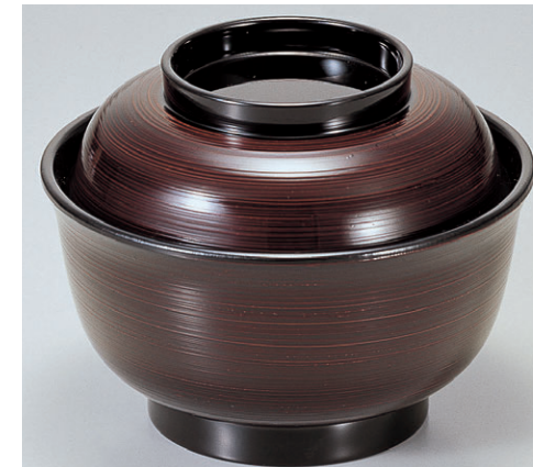
8-352-10 TA4.5寸美里飯器 溜刷毛目内黒塗 1-220-2 ¥2,350 (13.4φ×10.5・内寸11.8φ×5.9) 楕100 430cc