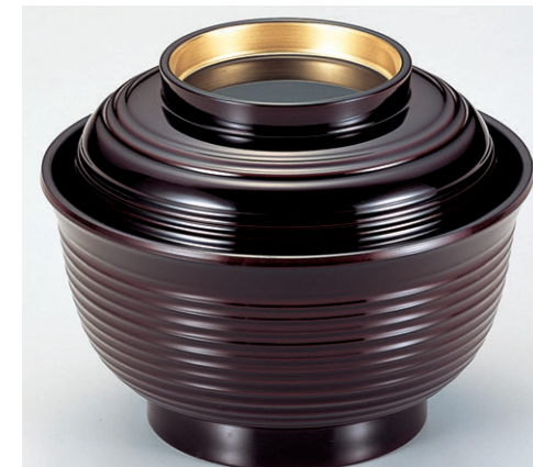
8-352-4 TA美里千筋飯器 溜内黒塗つば金 W-7-83 ¥2,200 (13.4φ×10.5・内寸11.8φ×5.9) 楕100 430cc