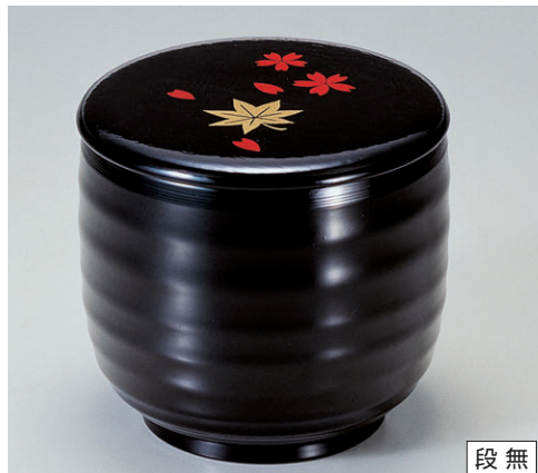
8-351-5 TA・Mさざ波飯器 黒内朱蓋春秋 1-226-4 ¥2,200 (10φ×9.5・内寸9.4φ×7.8) 楕100 470cc