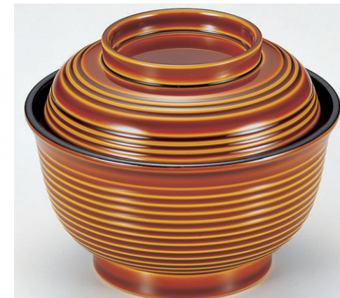
8-352-5 TA美里千筋飯器 漆調春慶内黒塗 1-220-12 ¥2,800 (13.4φ×10.5・内寸11.8φ×5.9) 楕100 430cc