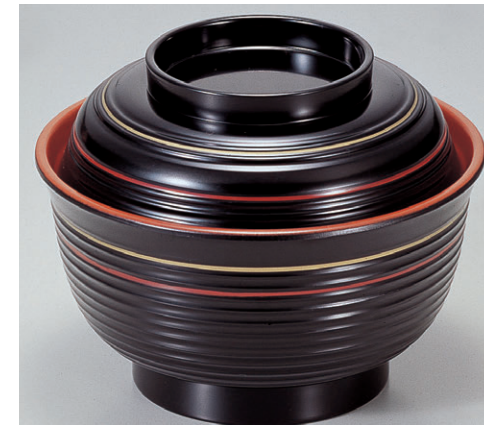
8-352-3 TA美里千筋飯器 ライン内朱 1-220-11 ¥2,250 (13.4φ×10.5・内寸11.8φ×5.9) 楕100 430cc