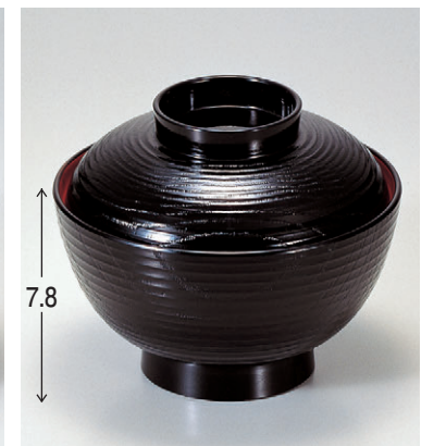
8-344-4 1-217-10 M4.5寸木目そば椀 黒内朱 ¥1,800 (13.6φ×11.2) 椀80 460cc