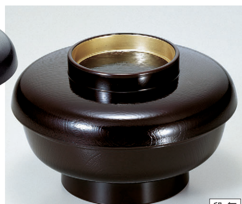
8-343-11 Aかぶせ木目椀 溜つば金 1-216-8 ¥2,400 (17.4φ×10.6) 椀60 720cc