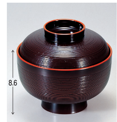
8-344-9 1-217-11 M千筋丼 溜天朱 ¥2,300 (13.8φ×12) 椀50 550cc