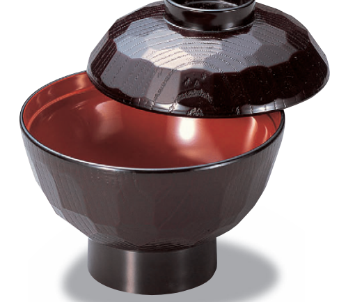
8-343-2 A(中)亀甲丼椀 溜内朱 W-7-62 ¥1,600 (13.3φ×11.7) 椀80 380cc