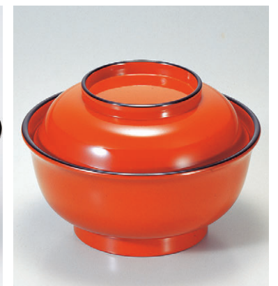
8-344-8 1-217-5 A羽反丼 朱内朱 ¥1,950 (15.8φ×10.8) 椀50 560cc