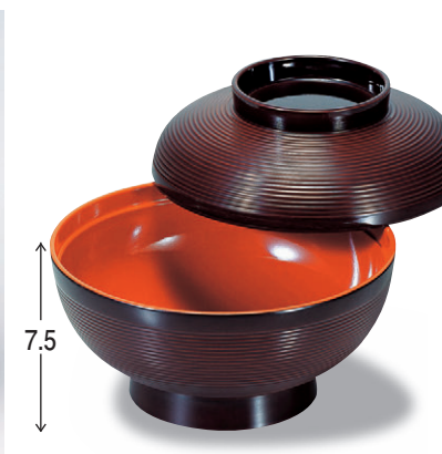
8-344-12 1-217-9 M荒筋丼 溜内朱 ¥2,350 (15.5φ×10.7) 椀50 570cc