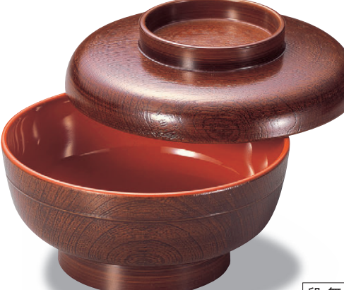
8-343-12 Aかぶせ木目椀 栃内朱 W-7-64 ¥2,250 (17.4φ×10.6) 椀60 720cc