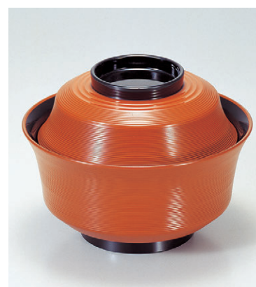
8-344-15 1-223-11 TA4.5寸竹型椀 朱つば黒内黒塗 ¥2,450 (13.5φ×10.2) 椀100 380cc