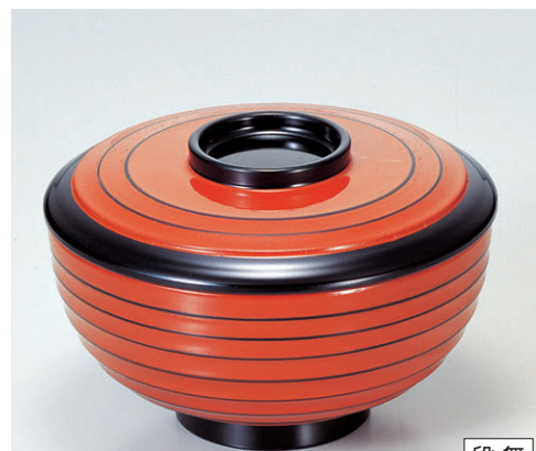
8-343-5 A(小)駒筋カンナ目椀 朱筋目 1-216-2 ¥2,350 (14.3φ×9.5) 椀80 580cc