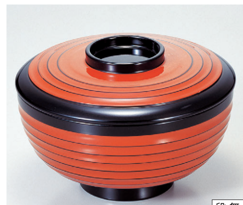
8-343-7 A(大)駒筋カンナ目椀 朱筋目 1-216-4 ¥2,750 (16.4φ×10.5) 椀60 880cc