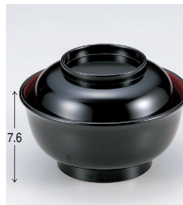
8-344-7 W-10-12 A羽反丼 黒内朱 ¥1,950 (15.8φ×10.8) 椀50 560cc