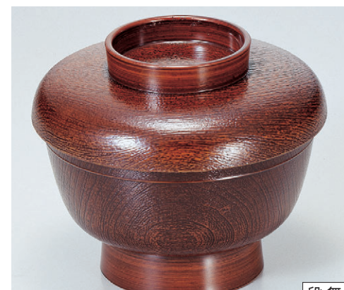
8-343-9 A高台かぶせ木目椀 栃 1-216-6 ¥1,950 (15.2φ×12.5) 椀60 770cc