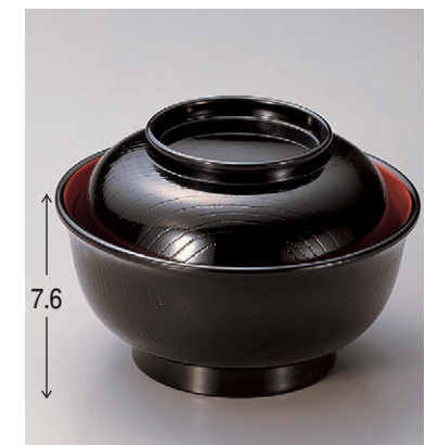
8-344-5 W-7-66 A姫型丼 黒内朱 ¥1,950 (15.8φ×10.8) 椀50 570cc