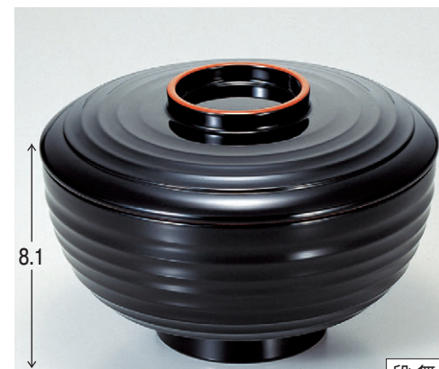
8-343-6 A(大)駒筋カンナ目椀 黒天朱内朱 1-216-3 ¥2,200 (16.4φ×10.5) 椀60 880cc