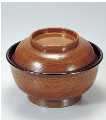
8-344-6 1-217-6 A姫型丼 栃木目 ¥2,100 (15.8φ×10.8) 椀50 570cc