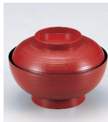
8-344-11 W-10-13 M千筋丼 朱 ¥1,850 (15.5φ×10.3) 椀50 570cc