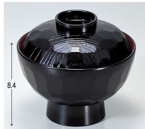
8-343-1 A(中)亀甲丼椀 黒内朱 W-7-61 ¥1,400 (13.3φ×11.7) 椀80 380cc