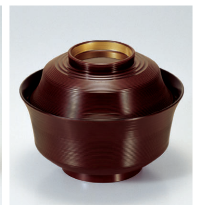
8-344-16 1-223-12 TA4.5寸竹型椀 溜つば金内黒塗 ¥2,700 (13.5φ×10.2) 椀100 380cc