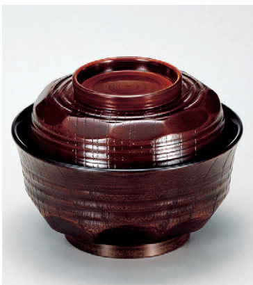
8-344-2 1-217-3 A5寸田吾作丼 栃 ¥2,100 (15.2φ×11.2) 椀50 560cc