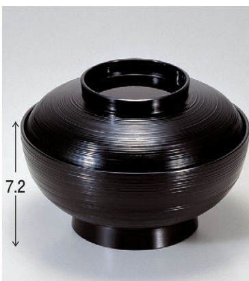
8-344-10 1-217-8 M千筋丼 黒 ¥1,850 (15.5φ×10.3) 椀50 570cc