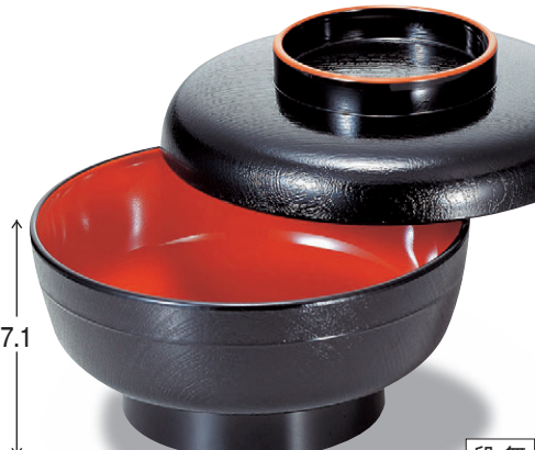
8-343-10 Aかぶせ木目椀 黒天朱内朱 1-216-7 ¥2,100 (17.4φ×10.6) 椀60 720cc