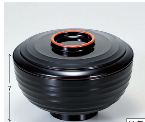
8-343-4 A(小)駒筋カンナ目椀 黒天朱内朱 1-216-1 ¥2,000 (14.3φ×9.5) 椀80 580cc