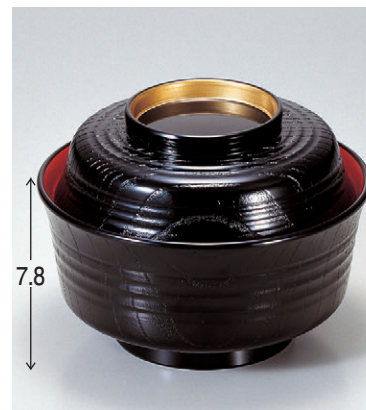
8-344-3 1-217-1 A弁慶丼 黒内朱つば金 ¥2,250 (15.3φ×11.4) 椀50 600cc