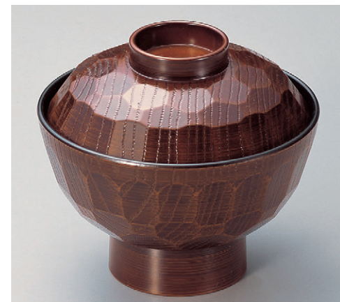
8-343-3 A(中)亀甲丼椀 栃 W-7-63 ¥1,800 (13.3φ×11.7) 椀80 380cc