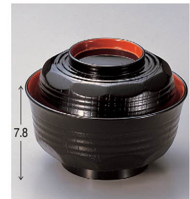
8-344-1 W-7-65 A5寸田吾作丼 黒内朱つば朱 ¥1,950 (15.2φ×11.2) 椀50 560cc