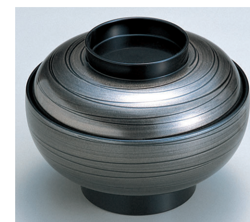
8-340-5 TA 5.5寸宝泉椀 銀刷毛目一筆 W-8-32 ¥3,100 (16.2φ×12.3) 椀50 660cc