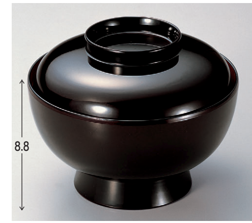
8-340-10 TA 加賀井 黒内朱 W-7-54 ¥2,100 (15.4φ×12.1) 椀50 700cc