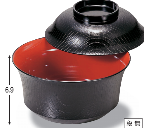
8-339-4 TA 5寸富士型丼椀 黒内朱 1-215-7 ¥2,300 (14.7φ×10.2) 椀50 690cc