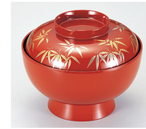
8-340-12 TA 加賀井 朱笹 S-H塗 W-7-56 ¥4,150 (15.4φ×12.1) 椀50 700cc