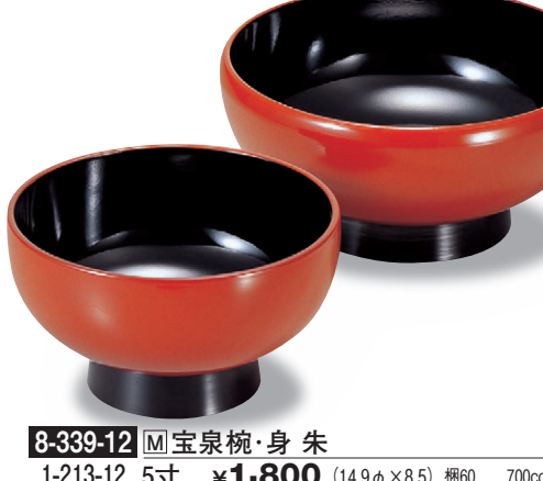
8-339-12 M 宝泉椀・身朱 1-213-12 5寸 ¥1,800 (14.9φ×8.5) 椀60 700cc 1-213-13 5.5寸 ¥2,000 (16.5φ×8.6) 椀60 940cc 1-213-14 6寸 ¥2,200 (18.4φ×8.8) 椀60 1,230cc