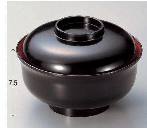
8-340-7 TA 5寸日野井 黒内朱 W-7-51 ¥1,700 (15.4φ×10.6) 椀50 600cc