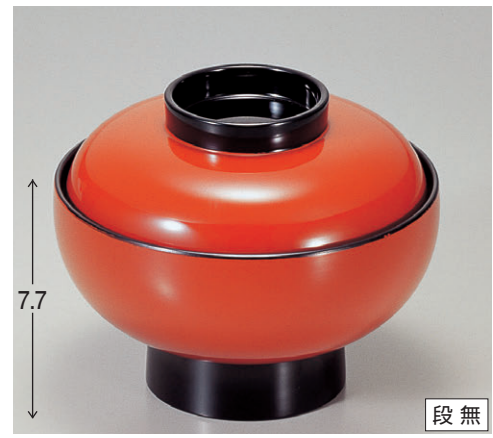
8-339-10 M 4.5寸多宝煮物椀 朱つば黒 1-213-10 ¥2,750 (13.6φ×11) 椀50 380cc