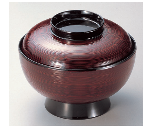
8-340-11 TA 加賀井 溜刷毛目 W-7-55 ¥2,900 (15.4φ×12.1) 椀50 700cc