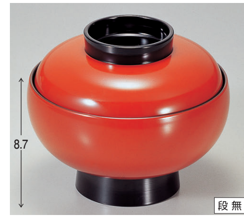
8-339-11 M 5寸多宝丼椀 朱つば黒 1-213-11 ¥3,800 (14.8φ×12.5) 椀50 700cc