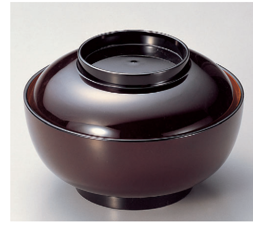
8-339-8 A 5.5寸深型椀 溜内朱つば黒 W-7-47 ¥2,350 (16.3φ×10.8) 椀50 700cc