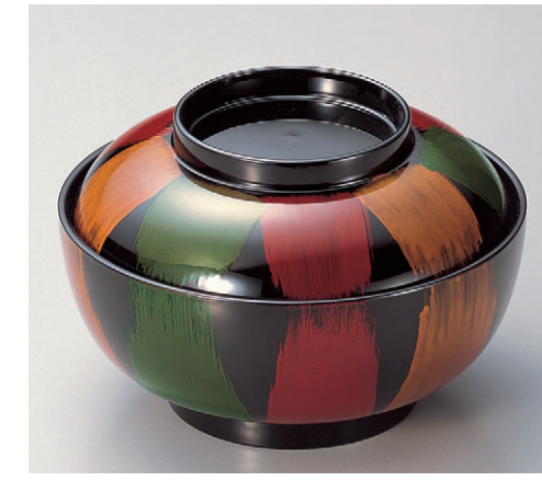
8-339-9 A 5.5寸深型椀 新歌舞伎 W-7-48 ¥4,950 (16.3φ×10.8) 椀50 700cc