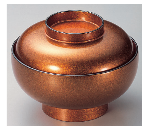
8-340-4 TA 5.5寸宝泉椀 梨地天黒内朱 W-7-50 ¥2,650 (16.2φ×12.3) 椀50 660cc