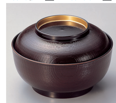
8-339-3 TA 5寸千筋木目椀 溜つば金 W-7-43 ¥2,500 (15φ×10) 椀50 580cc