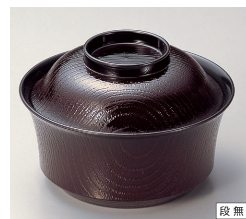
8-339-5 TA 5寸富士型丼椀 溜 W-7-45 ¥2,700 (14.7φ×10.2) 椀50 690cc