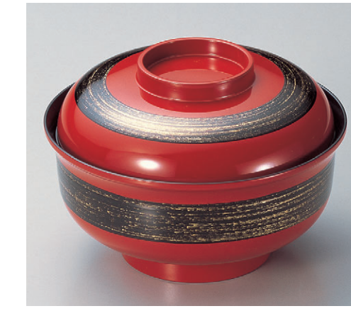
8-340-9 TA 5寸日野井 朱帯黒金かすり W-7-53 ¥2,000 (15.4φ×10.6) 椀50 600cc