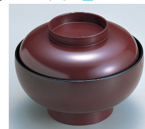
8-340-2 TA 5.5寸宝泉椀 吟朱 W-8-30 ¥2,600 (16.2φ×12.3) 椀50 660cc