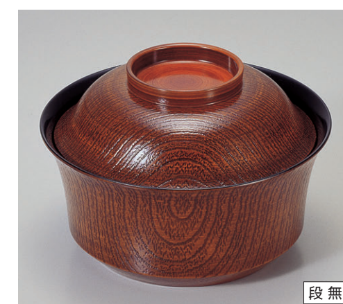
8-339-6 TA 5寸富士型丼椀 栃 1-215-8 ¥2,950 (14.7φ×10.2) 椀50 690cc