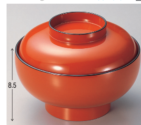
8-340-1 TA 5.5寸宝泉椀 朱内朱天黒 W-7-49 ¥2,400 (16.2φ×12.3) 椀50 660cc