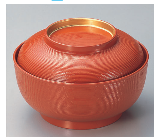
8-339-2 TA 5寸千筋木目椀 洗朱つば金 W-7-44 ¥2,200 (15φ×10) 椀50 580cc