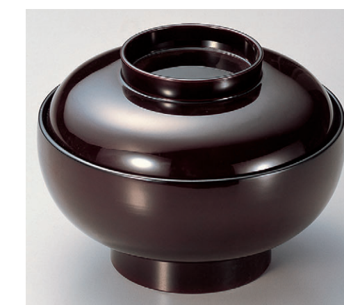
8-340-3 TA 5.5寸宝泉椀 溜 W-8-31 ¥2,700 (16.2φ×12.3) 椀50 660cc