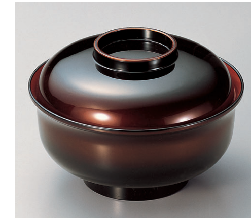
8-340-8 TA 5寸日野井 春慶ぼかし内朱 W-7-52 ¥2,150 (15.4φ×10.6) 椀50 600cc