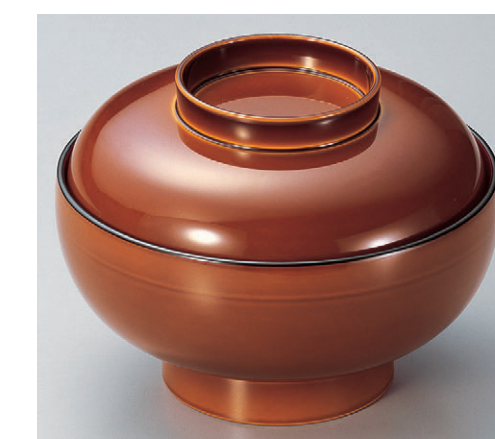
8-340-6 TA 5.5寸宝泉椀 漆調春慶塗内朱 W-8-33 ¥3,800 (16.2φ×12.3) 椀50 660cc