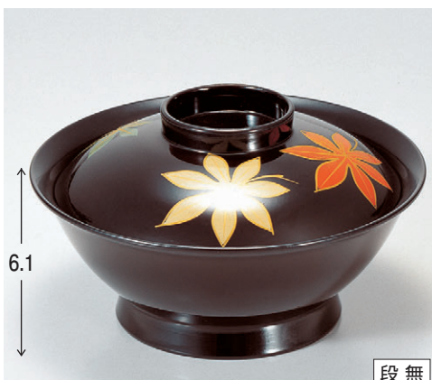
8-325-7 M 5寸羽反型椀 溜八ツ手・手描蒔絵 1-203-6 ¥3,500 (14.5φ×10) 椀60 480cc