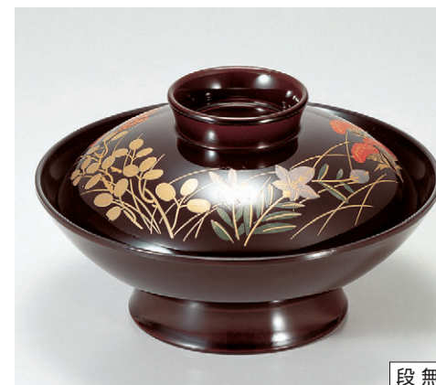
8-325-6 TA 5.5寸羽反煮物椀 溜塗秋草 1-203-8 ¥3,700 (16.3φ×9.4) 椀60 490cc