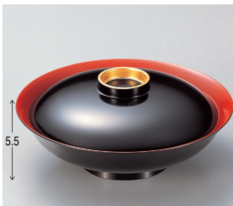
8-326-7 TM 6.2寸平駒煮物椀 黒内朱つば内金 W-7-5 ¥4,150 (18.8φ×8) 椀60 450cc