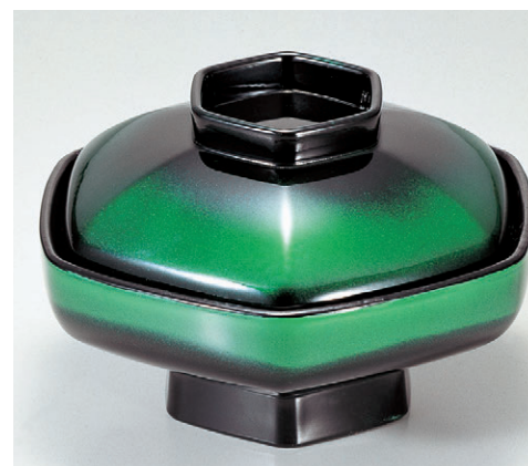
8-326-8 TA 六角煮物椀 グリーンカスミ 1-204-10 ¥3,800 (16φ×9.9) 椀60 530cc