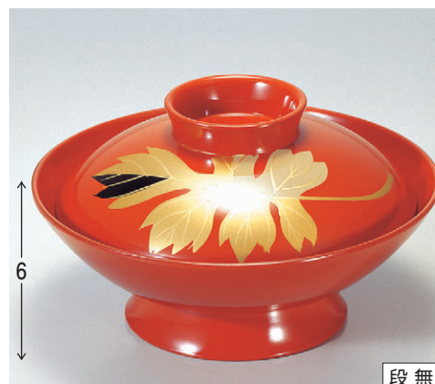
8-325-8 M 御殿型煮物椀 一枚菊内朱・手描蒔絵 1-203-9 ¥3,800 (16.4φ×9.8) 椀60 470cc