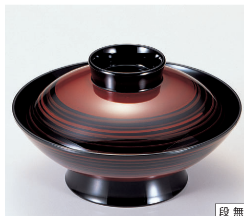
8-325-2 TA 5.5寸羽反煮物椀 溜筋目塗り分け W-6-95 ¥2,550 (16.3φ×9.4) 椀60 490cc