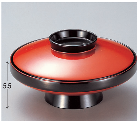
8-326-4 M 5.5寸駒型煮物椀 朱溜黒 W-7-4 ¥2,800 (16φ×8.2) 椀60 600cc