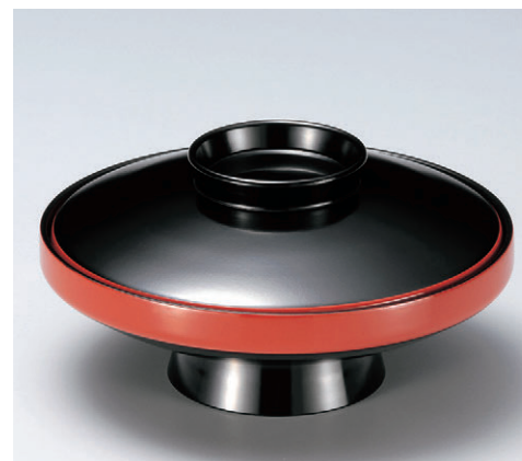
8-326-5 M 5.5寸駒型煮物椀 黒溜朱 W-9-89 ¥2,800 (16φ×8.2) 椀60 600cc