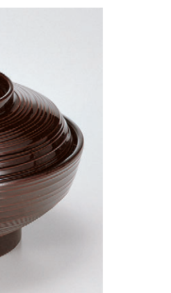
8-326-14 TA 5.5寸線筋平煮物椀 溜内黒 W-2-63 ¥2,650 (16.5φ×9.6) 椀50 500cc