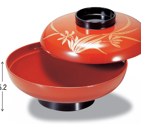
8-326-2 M 5.5寸駒型煮物椀 ラン内朱 1-204-2 ¥2,850 (15.4φ×7.8) 椀60 400cc