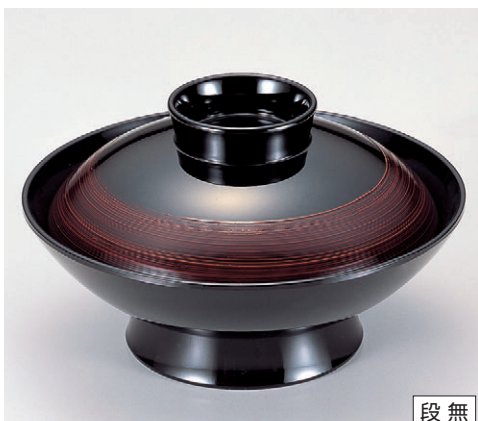
8-325-4 TA 5.5寸羽反煮物椀 溜溜刷毛目 W-6-97 ¥2,800 (16.3φ×9.4) 椀60 490cc