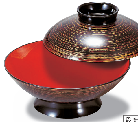
8-325-9 M 御殿型煮物椀 茶金かすり内朱 S-H塗 1-203-11 ¥5,100 (16.4φ×9.8) 椀60 470cc