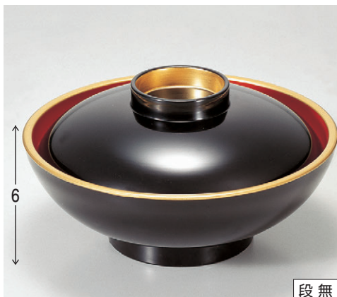
8-326-1 A 5.5寸風味椀 黒内朱つば天金 1-204-1 ¥1,800 (16.4φ×9) 椀60 600cc