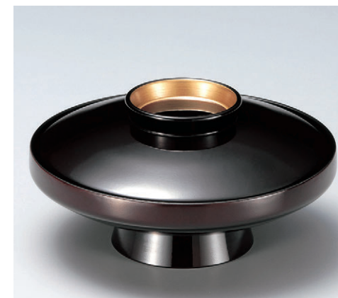
8-326-6 M 5.5寸駒型煮物椀 溜つば金 W-9-90 ¥3,200 (16φ×8.2) 椀60 600cc