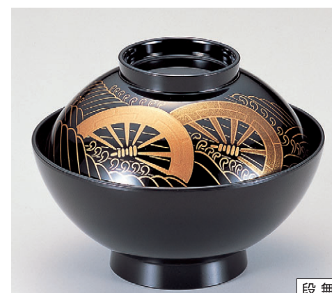
8-326-10 TA 5.5寸線筋平煮物椀 朱つば黒 W-7-7 ¥2,400 (16.5φ×9.6) 椀50 500cc