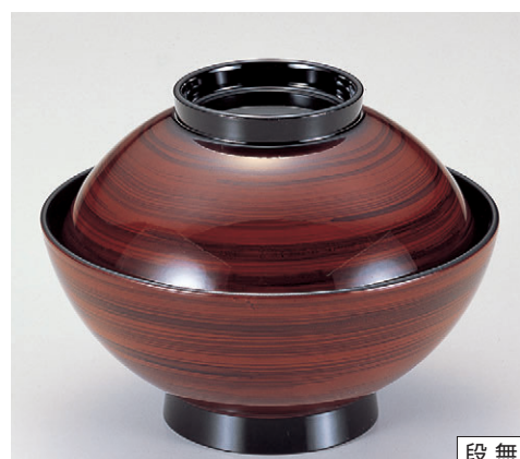
8-325-11 TM 熊ヶ谷椀 黒御所車 W-7-2 ¥3,300 (13.8φ×10.3) 椀60 480cc