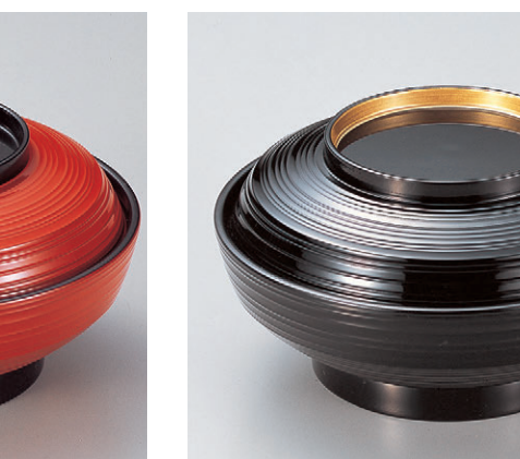
8-326-12 TA 5.5寸線筋平煮物椀 黒つば金 W-7-9 ¥2,450 (16.5φ×9.6) 椀50 500cc