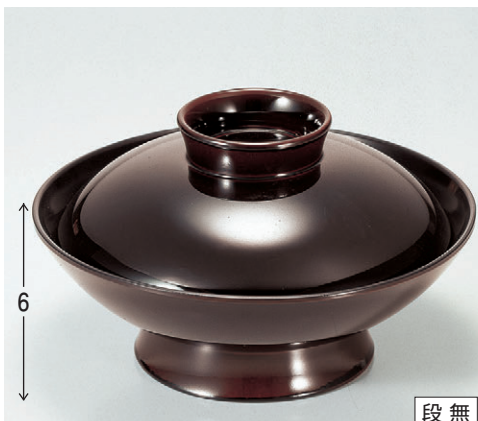
8-325-1 TA 5.5寸羽反煮物椀 溜 1-203-7 ¥2,400 (16.3φ×9.4) 椀60 490cc