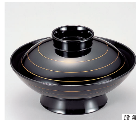
8-325-3 TA 5.5寸羽反煮物椀 黒金ライン W-6-96 ¥2,450 (16.3φ×9.4) 椀60 490cc