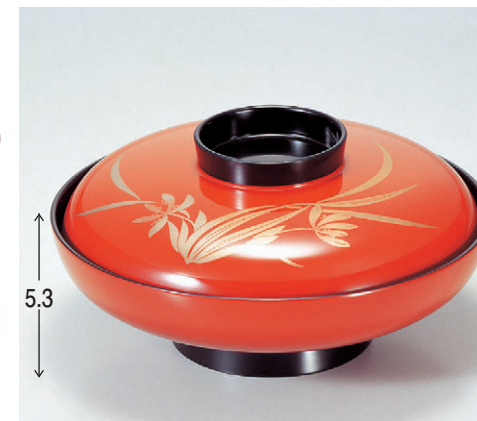
8-326-3 M 5.5寸駒型煮物椀 ラン 1-204-3 ¥3,050 (16.7φ×8.3) 椀60 600cc