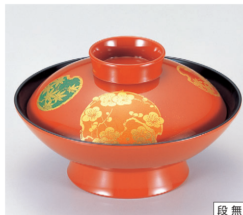
8-325-5 TA 5.5寸羽反煮物椀 朱花丸 W-6-98 ¥3,300 (16.3φ×9.4) 椀60 490cc