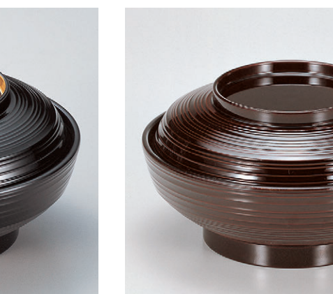
8-326-13 TA 6寸線筋平煮物椀 黒つば金 W-7-10 ¥2,700 (18φ×9.6) 椀50 620cc