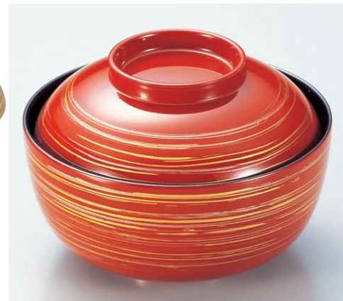
8-320-5 4寸きさらぎ椀 朱かすり W-6-80 ¥2,900 (12.6φ×8.8) 椀100 380cc