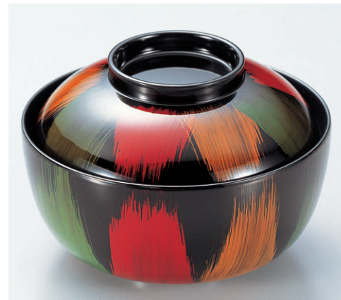
8-320-6 4寸きさらぎ椀 新歌舞伎 W-6-81 ¥4,000 (12.6φ×8.8) 椀100 380cc