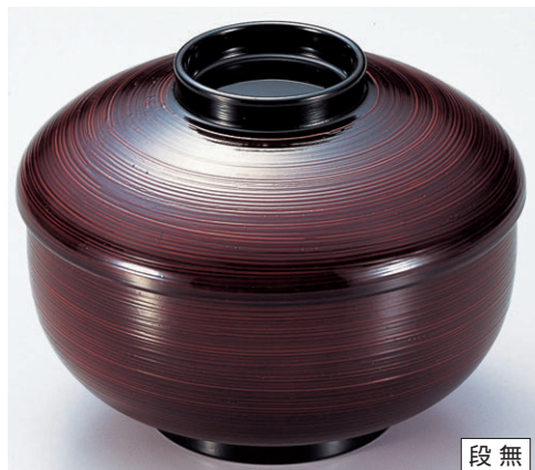
8-319-8 三笠煮物椀 溜刷毛目 W-6-75 ¥3,150 (13φ×10) 椀100 500cc