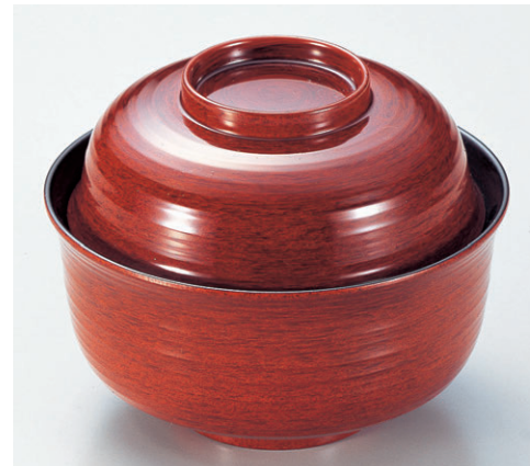
8-320-3 4寸千筋羽反椀 後藤塗 W-6-79 ¥2,100 (12φ×9.5) 椀100 310cc