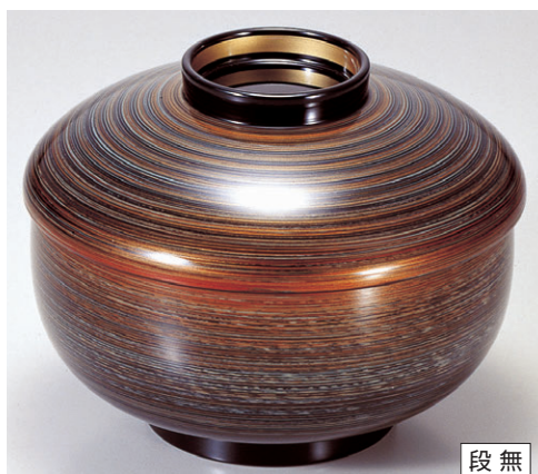
8-319-12 三笠煮物椀 グレー金つむぎ S・H塗 1-199-4 ¥5,600 (13φ×10) 椀100 500cc