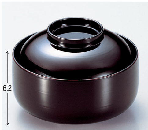
8-319-4 4.2寸布袋お好み椀 溜 W-6-74 ¥2,000 (12.6φ×9) 椀100 610cc