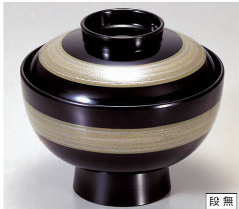
8-319-2 雑煮椀 グリーンパープルライン 1-198-2 ¥3,150 (13φ×11.2) 椀100 470cc