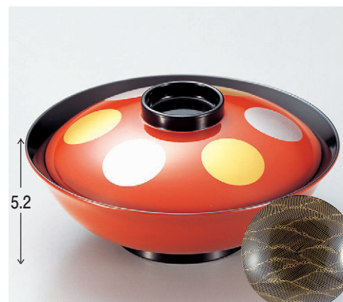
8-320-11 5寸平駒煮物椀 朱内黒日月見返金波 W-6-83 ¥4,500 (15.1φ×7) 椀60 290cc