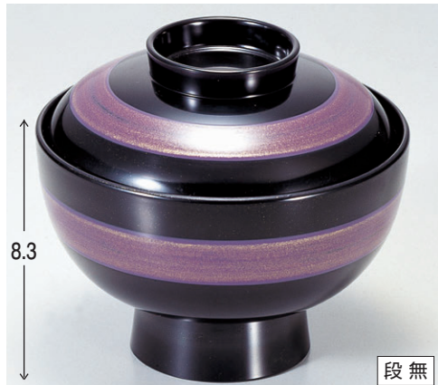
8-319-1 雑煮椀 パープルライン 1-198-1 ¥3,150 (13φ×11.2) 椀100 470cc