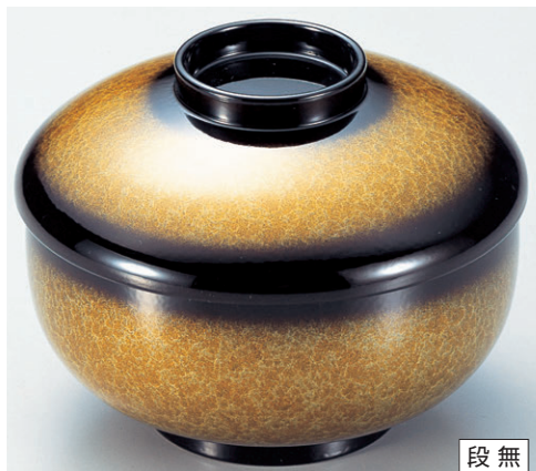
8-319-9 三笠煮物椀 アクアイエロー W-6-76 ¥3,600 (13φ×10) 椀100 500cc