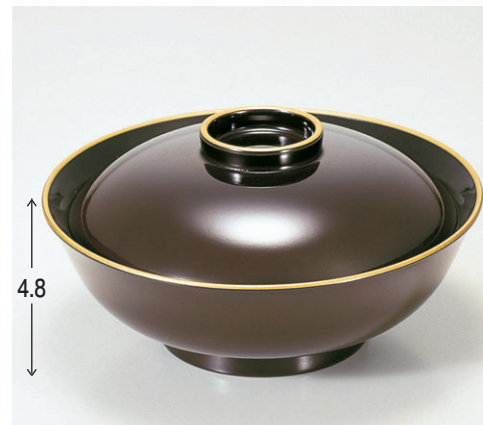
8-320-9 4.5寸平駒椀 溜天金 1-203-1 ¥2,700 (13.4φ×6.8) 椀100 220cc