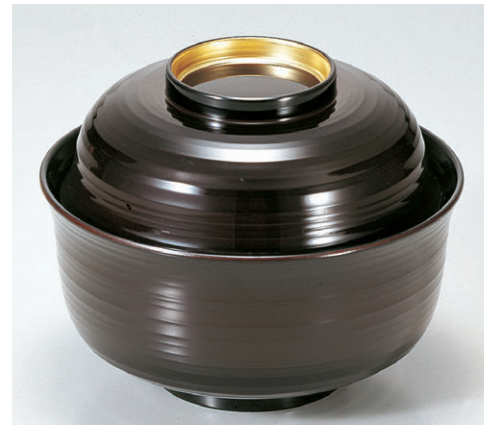
8-320-2 4寸千筋羽反椀 溜つば金 1-199-11 ¥2,200 (12φ×9.5) 椀100 310cc