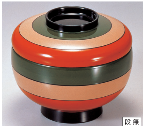
8-319-6 4.2寸布袋椀 三色独楽 1-198-8 ¥3,150 (12.6φ×10.7) 椀100 540cc