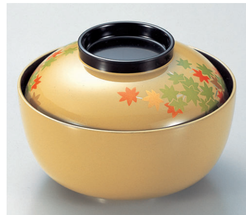
8-320-7 4寸きさらぎ椀 変わり紅葉 W-3-73 ¥4,350 (12.6φ×8.8) 椀100 380cc