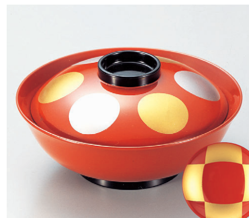
8-320-10 4.5寸平駒椀 朱内朱日月見返市松 W-6-82 ¥4,200 (13.4φ×6.8) 椀100 220cc