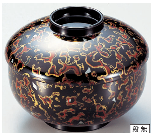
8-319-10 三笠煮物椀 貝堆朱 W-6-77 ¥4,050 (13φ×10) 椀100 500cc