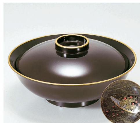
8-320-12 5寸平駒煮物椀 溜天金見返波舟 1-203-4 ¥5,400 (15.1φ×7) 椀60 290cc