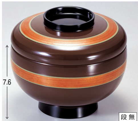
8-319-5 4.2寸布袋椀 茶/朱玉虫ライン 1-198-7 ¥3,050 (12.6φ×10.7) 椀100 540cc