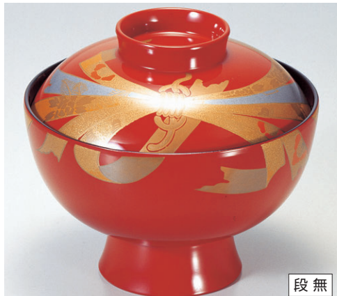
8-319-3 雑煮椀 朱塗のし 1-198-4 ¥4,250 (13φ×11.2) 椀100 470cc