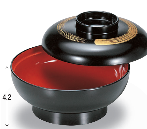
8-320-8 床置一口椀 黒内朱一筆 W-2-49 ¥2,000 (11.1φ×6.7) 椀200 160cc