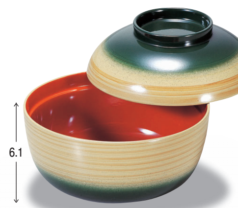
8-320-4 4寸きさらぎ椀 白木かすみ内朱 1-199-9 ¥2,450 (12.6φ×8.8) 椀100 380cc