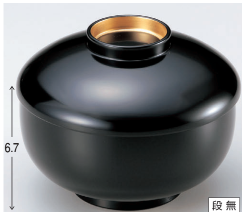
8-319-7 三笠煮物椀 黒内朱つば金 W-10-11 ¥2,900 (13φ×10) 椀100 500cc