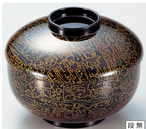
8-319-11 三笠煮物椀 垣根格子 W-6-78 ¥4,650 (13φ×10) 椀100 500cc