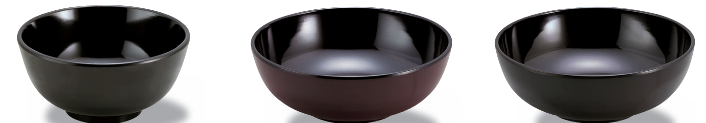
8-315-8 W-16-67 Mうどん井黒(ST-1-1) ¥1,600 (16.3φ×7.9) 椀80 850cc