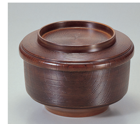
8-316-6 A保温飯器 栃千筋内朱 1-193-6 ¥2,850 (14.1φ×9.5) 椀100 540cc