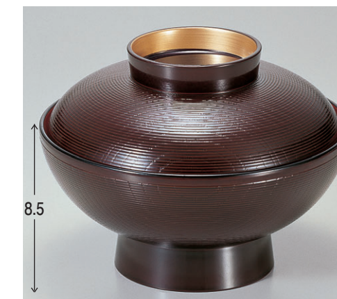
8-316-7 A保温煮物椀 溜千筋内朱つば金 1-193-7 ¥4,000 (17.5φ×13) 椀50 510cc