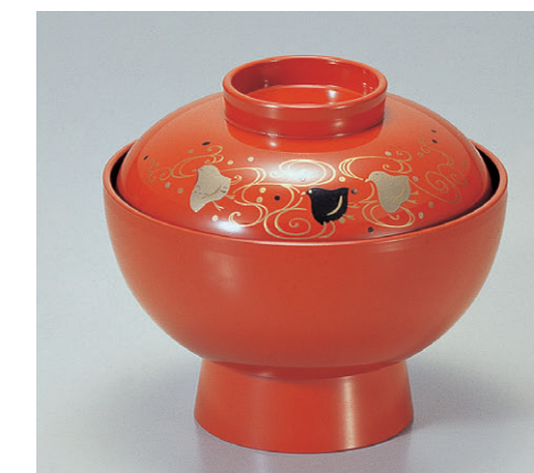
8-316-4 A保温吸椀 朱波千鳥内黒塗 1-193-4 ¥3,250 (12φ×10.5) 椀100 230cc