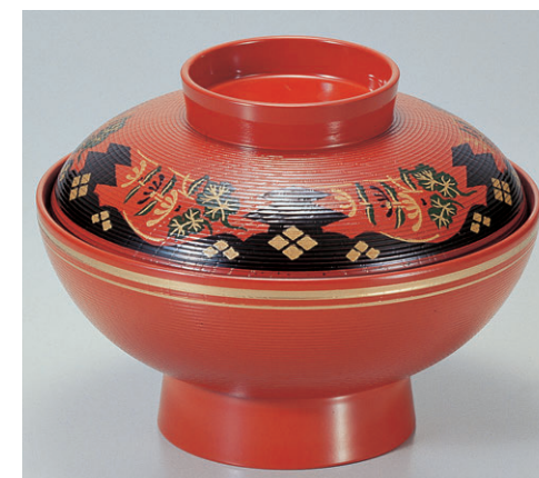
8-316-8 A保温煮物椀 朱千筋正方寺金ライン 1-193-8 ¥4,350 (17.5φ×13) 椀50 510cc