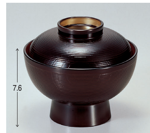
8-316-1 A保温千筋吸椀 溜内朱つば金 1-193-1 ¥2,450 (12φ×10.3) 椀100 230cc