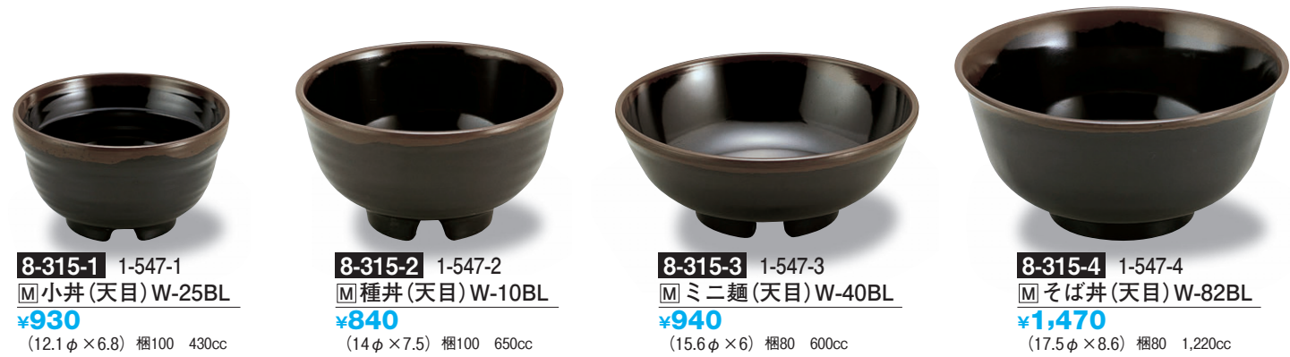
8-315-1 1-547-1 M小井(天目) W-25BL ¥930 (12.1φ×6.8) 椀100 430cc