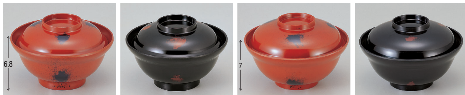
8-315-11 1-192-13 F4.7寸飯井 根来 ¥330 身 ¥530 (14.3φ×9) 椀80 350cc