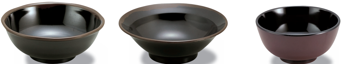
8-315-5 1-547-5 M7寸麺井(天目) W-83BL ¥1,470 (20.4φ×7.6) 椀60 1,220cc