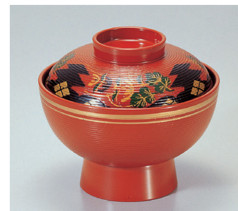
8-316-2 A保温千筋吸椀 朱正方寺金ライン 1-193-2 ¥2,750 (12φ×10.3) 椀100 230cc