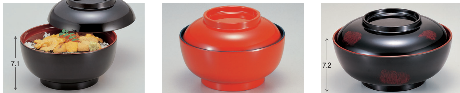
8-315-15 M5寸丸井重 黒内朱 1-192-17A 蓋 ¥630 1-192-17 身 ¥1,400 (15φ×10.2) 椀60 600cc