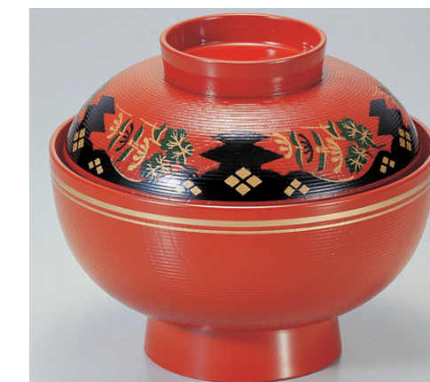
8-316-10 A保温井 朱千筋正方寺金ライン 1-193-10 ¥4,450 (17.6φ×14.7) 椀50 660cc