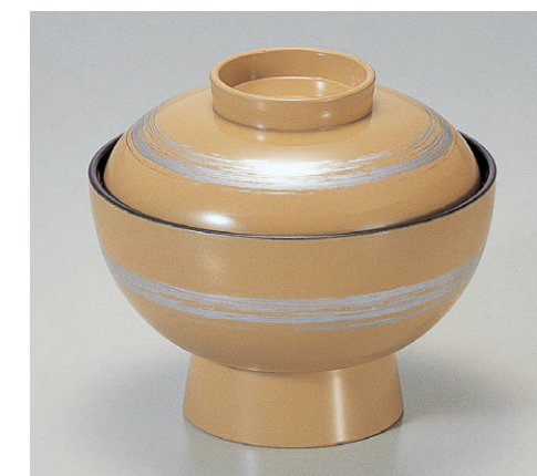
8-316-3 A保温吸椀 クリーム銀一筆内黒塗 1-193-3 ¥2,650 (12φ×10.5) 椀100 230cc