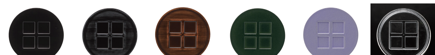
8-218-19 H-76-79 TA kamonB ブラック ¥660 (11.2φ×0.7) 梱200 8-218-20 H-76-80 TA kamonB レトロブラック ¥1,110 (11.2φ×0.7) 梱200 8-218-21 H-76-81 TA kamonB 刷毛目 ¥1,020 (11.2φ×0.7) 梱200 8-218-22 H-76-82 TA kamonB グリーン 乾漆シルバー ¥670 (11.2φ×0.7) 梱200 8-218-23 H-76-83 TA kamonB パープル雲流 ¥880 (11.2φ×0.7) 梱200 8-218-24 H-76-84 AC kamonB クリア ¥880 (11.2φ×0.7) 梱200