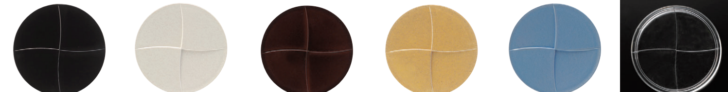
8-218-7 H-76-67 TA fu-sya ブラック ¥660 (11.2φ×0.7) 梱200 8-218-8 H-76-68 TA fu-sya 白アクア ¥910 (11.2φ×0.7) 梱200 8-218-9 H-76-69 TA fu-sya 茶乾漆 ¥650 (11.2φ×0.7) 梱200 8-218-10 H-76-70 TA fu-sya 総金雅 ¥2,670 (11.2φ×0.7) 梱200 8-218-11 H-76-71 TA fu-sya ブルー雲流 ¥880 (11.2φ×0.7) 梱200 8-218-12 H-76-72 AC fu-sya クリア ¥880 (11.2φ×0.7) 梱200