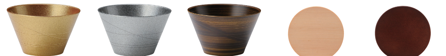
8-217-22 W-16-30 TAポヌールカップ 総金雅 ¥3,090 (10.8φ×6.4) 梱100 8-217-23 W-16-31 TAポヌールカップ 総銀雅 ¥1,680 (10.8φ×6.4) 梱100 8-217-24 W-16-32 TAポヌールカップ 総刷毛目 ¥1,450 (10.8φ×6.4) 梱100 8-217-25 H-76-59 木ウッド ナチュラル ¥2,780 (11.2φ×0.7) 梱200 8-217-26 H-76-60 木ウッド ブラウン ¥2,780 (11.2φ×0.7) 梱200