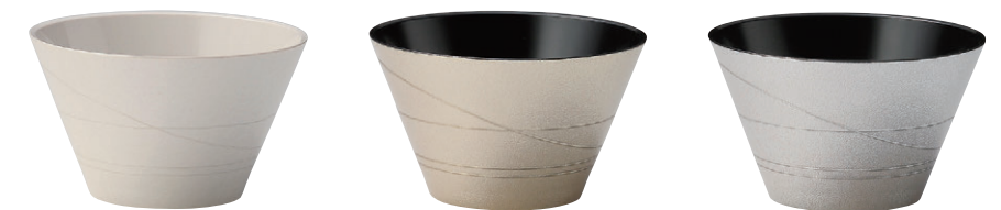
8-217-4 W-16-12 TAポヌールカップ 白アクア ¥1,140 (10.8φ×6.4) 梱100 8-217-5 W-16-13 TAポヌールカップ 金石目 ¥1,560 (10.8φ×6.4) 梱100 8-217-6 W-16-14 TAポヌールカップ 銀石目 ¥1,560 (10.8φ×6.4) 梱100