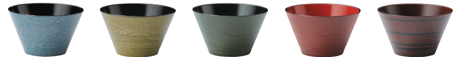
8-217-7 W-16-15 TAポヌールカップ 青釉 ¥1,430 (10.8φ×6.4) 梱100 8-217-8 W-16-16 TAポヌールカップ 緑釉 ¥1,430 (10.8φ×6.4) 梱100 8-217-9 W-16-17 TAポヌールカップ グリーン乾漆 ¥920 (10.8φ×6.4) 梱100 8-217-10 W-16-18 TAポヌールカップ 茶乾漆内朱 ¥950 (10.8φ×6.4) 梱100 8-217-11 W-16-19 TAポヌールカップ 総銀朱帯黒 ¥1,170 (10.8φ×6.4) 梱100