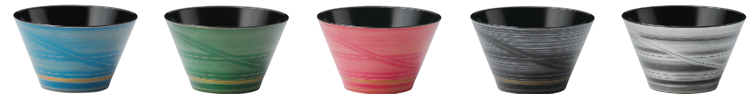
8-217-12 W-16-20 TAポヌールカップ レトロブルー帯金 ¥1,430 (10.8φ×6.4) 梱100 8-217-13 W-16-21 TAポヌールカップ レトログリーン帯金 ¥1,430 (10.8φ×6.4) 梱100 8-217-14 W-16-22 TAポヌールカップ レトロレッド帯金 ¥1,430 (10.8φ×6.4) 梱100 8-217-15 W-16-23 TAポヌールカップ レトロブラック帯金 ¥1,430 (10.8φ×6.4) 梱100 8-217-16 W-16-24 TAポヌールカップ 銀透き黒研ぎ出し ¥1,680 (10.8φ×6.4) 梱100