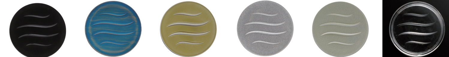
8-218-1 H-76-61 TA seseragi ブラック ¥660 (11.2φ×0.7) 梱200 8-218-2 H-76-62 TA seseragi レトロブルー ¥1,110 (11.2φ×0.7) 梱200 8-218-3 H-76-63 TA seseragi 緑釉 ¥880 (11.2φ×0.7) 梱200 8-218-4 H-76-64 TA seseragi 総銀雅 ¥1,420 (11.2φ×0.7) 梱200 8-218-5 H-76-65 TA seseragi グリーン雲流 ¥880 (11.2φ×0.7) 梱200 8-218-6 H-76-66 AC seseragi クリア ¥880 (11.2φ×0.7) 梱200