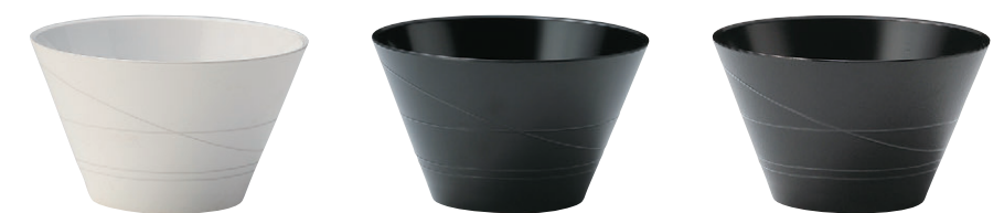
8-217-1 W-16-9 TAポヌールカップ ホワイト ¥1,030 (10.8φ×6.4) 梱100 8-217-2 W-16-10 TAポヌールカップ ブラック ¥880 (10.8φ×6.4) 梱100 8-217-3 W-16-11 TAポヌールカップ 黒石目 ¥1,050 (10.8φ×6.4) 梱100