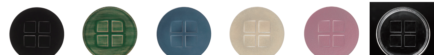
8-218-13 H-76-73 TA kamonA ブラック ¥660 (11.2φ×0.7) 梱200 8-218-14 H-76-74 TA kamonA レトログリーン ¥1,110 (11.2φ×0.7) 梱200 8-218-15 H-76-75 TA kamonA 青釉 ¥880 (11.2φ×0.7) 梱200 8-218-16 H-76-76 TA kamonA 金石目 ¥1,420 (11.2φ×0.7) 梱200 8-218-17 H-76-77 TA kamonA ピンク雲流 ¥880 (11.2φ×0.7) 梱200 8-218-18 H-76-78 AC kamonA クリア ¥880 (11.2φ×0.7) 梱200