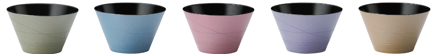
8-217-17 W-16-25 TAポヌールカップ グリーン雲流 ¥1,110 (10.8φ×6.4) 梱100 8-217-18 W-16-26 TAポヌールカップ ブルー雲流 ¥1,110 (10.8φ×6.4) 梱100 8-217-19 W-16-27 TAポヌールカップ ピンク雲流 ¥1,110 (10.8φ×6.4) 梱100 8-217-20 W-16-28 TAポヌールカップ パープル雲流 ¥1,110 (10.8φ×6.4) 梱100 8-217-21 W-16-29 TAポヌールカップ ベージュ雲流 ¥1,110 (10.8φ×6.4) 梱100