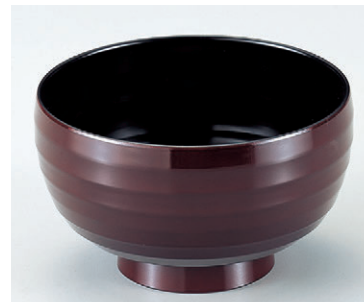
8-301-18 W-6-31 F段付汁椀 溜 ¥1,100 (10.8φ×6.5) 椀200 370cc