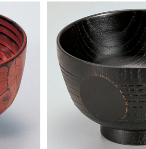
8-302-13 1-189-15 限定品 困汁椀 ケヤキ竹の子 ¥1,300 (12φ×6.7) 椀120 360cc