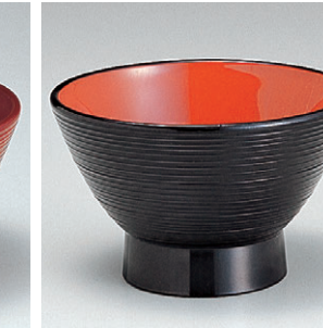
8-302-4 W-2-34 A3.8寸宝生汁椀 黒内朱 ¥580 (11.7φ×7) 椀100 300cc