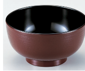
8-301-8 W-6-24 A4寸雅汁椀 銀朱 ¥540 (11.7φ×6.1) 椀300 380cc