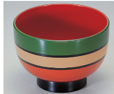
8-301-14 1-189-4 A寿汁椀 歌舞伎内朱 ¥1,150 (10.4φ×7.3) 椀300 350cc