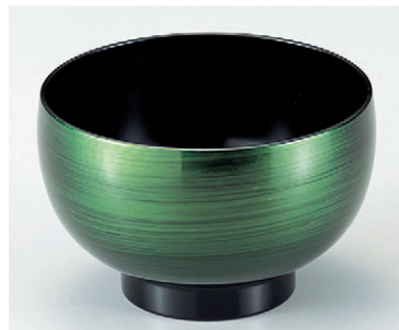
8-301-17 W-6-30 TA3.5寸ほてい汁椀 緑彩 ¥1,080 (10.4φ×7) 椀300 350cc