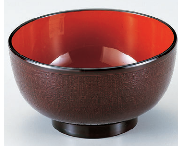
8-301-9 W-6-25 A4寸雅汁椀 溜内朱 ¥690 (11.7φ×6.1) 椀300 380cc