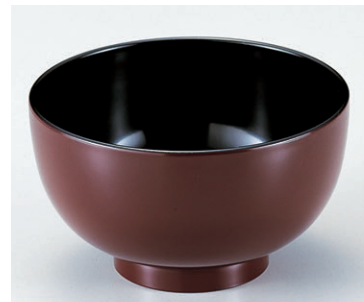
8-301-6 W-6-26 A小汁椀 銀朱 ¥410 (9.9φ×5.6) 椀400 270cc