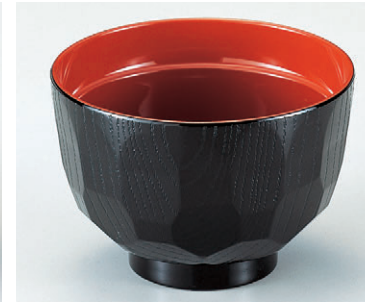
8-301-3 W-6-23 TA耐熱ニュー3.2寸亀甲汁椀 黒内朱 ¥650 (9.7φ×6.6) 椀300 200cc