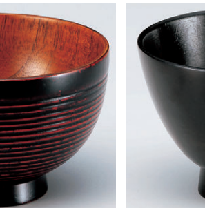
8-302-17 W-10-69 困木製小町汁椀 黒ケヤキ ¥2,150 (11.6φ×8.1) 椀144 300cc