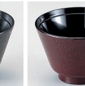
8-302-7 W-6-34 TA3.3寸布目汁椀 溜 ¥730 (10.4φ×6.5) 椀200 230cc