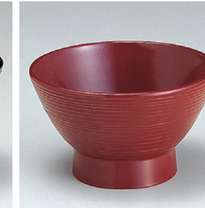
8-302-3 W-2-33 A3.6寸宝生汁椀 吟朱 ¥530 (11φ×7) 椀100 260cc