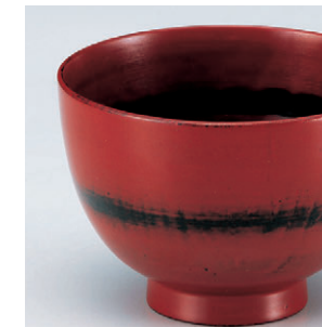
8-302-15 W-10-67 困ミニ汁椀 根来 ¥2,450 (9.9φ×7.1) 椀144 250cc