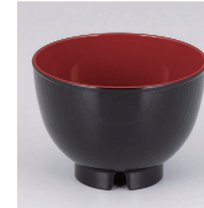
8-302-1 W-12-68 A新3.2寸汁椀 黒木目内朱(通気穴付) ¥200 (9.6φ×6.8) 椀400 270cc