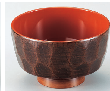
8-301-19 W-6-32 F3.8寸亀甲木目汁椀 栃内朱 ¥1,150 (11.4φ×7) 椀200 390cc