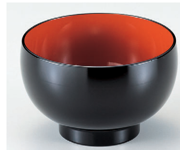
8-301-16 W-6-29 TA3.5寸ほてい汁椀 黒内朱 ¥830 (10.4φ×7) 椀300 350cc