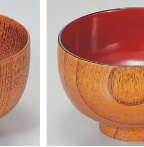
8-302-11 1-189-12 限定品 困木製羽反口椀 木目漆内朱 ¥980 (11φ×7) 椀144 280cc