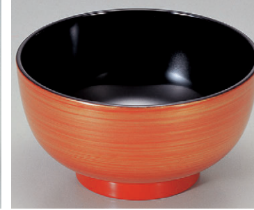
8-301-11 1-189-7 A平安汁椀 朱彩 ¥820 (11.7φ×6.3) 椀200 380cc