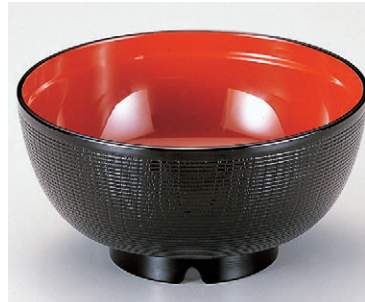
8-301-1 W-6-22 TAニュー千筋ケヤキ椀 黒内朱(通気穴付) ¥750 (12φ×6.2) 椀200 290cc