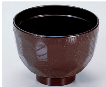
8-301-5 W-2-29 TA3.1寸亀甲汁椀 うるみ内黒 ¥400 (9.4φ×7) 椀300 220cc