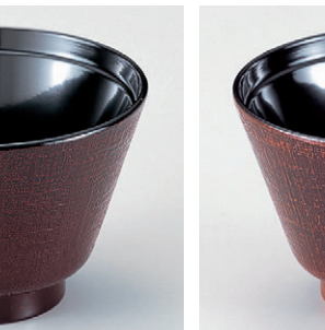
8-302-8 W-6-35 TA3.3寸布目汁椀 栃 ¥830 (10.4φ×6.5) 椀200 230cc