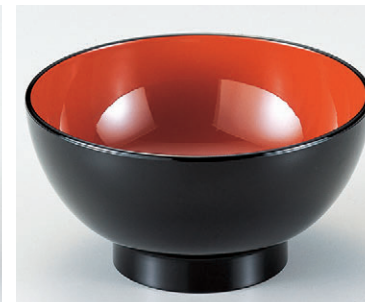
8-301-7 W-6-28 A大汁椀 黒内朱 ¥440 (11.8φ×6.1) 椀300 340cc