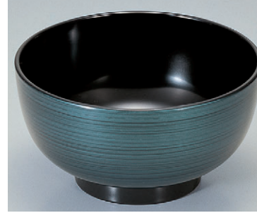
8-301-10 1-188-14 A平安汁椀 ブルーかすみ ¥700 (11.7φ×6.3) 椀200 380cc