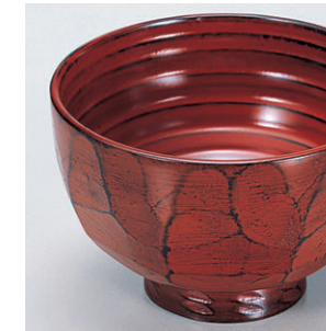
8-302-12 1-189-13 限定品 困汁椀 黒ケヤキ(小) ¥1,250 (11.4φ×6.9) 椀144 320cc