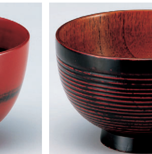
8-302-16 W-10-68 困木製口椀筋汁椀 曙内スリ漆 ¥2,450 (11.1φ×7.1) 椀144 320cc