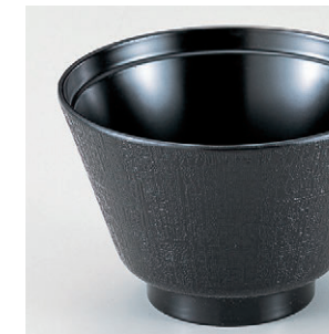
8-302-6 W-6-33 TA3.3寸布目汁椀 黒 ¥630 (10.4φ×6.5) 椀200 230cc