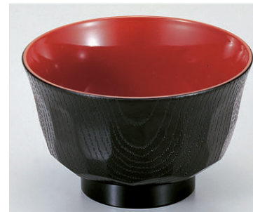
8-301-4 1-189-1 A羽反亀甲木目汁椀 黒内朱 ¥380 (10.7φ×6.6) 椀300 320cc