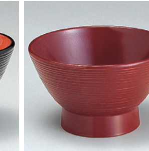
8-302-5 W-2-35 A3.8寸宝生汁椀 吟朱 ¥580 (11.7φ×7) 椀100 300cc