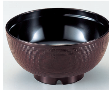
8-301-2 W-2-28 TAニュー千筋ケヤキ椀 溜(通気穴付) ¥800 (12φ×6.2) 椀200 290cc