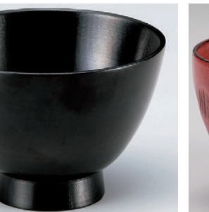
8-302-18 W-10-70 困木製小町汁椀 黒ケヤキ ¥2,150 (11.6φ×8.1) 椀144 300cc