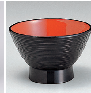
8-302-2 W-2-32 A3.6寸宝生汁椀 黒内朱 ¥530 (11φ×7) 椀100 260cc