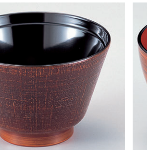
8-302-9 W-6-36 A4寸彩汁椀 茶刷毛目 ¥1,050 (12.6φ×7.4) 椀100 480cc