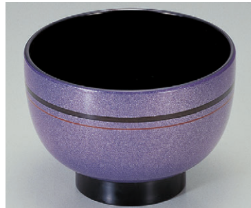
8-301-13 1-189-3 A寿汁椀 紫パールライン ¥1,050 (10.4φ×7.3) 椀300 350cc