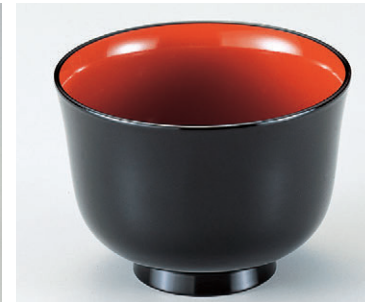
8-301-15 W-6-27 TM春秋汁椀 黒内朱 ¥1,350 (9.8φ×7) 椀200 300cc