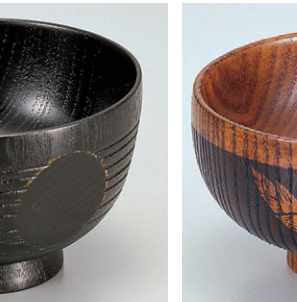
8-302-14 W-10-66 困ミニ汁椀 スリ漆 ¥1,750 (9.9φ×7.1) 椀144 250cc