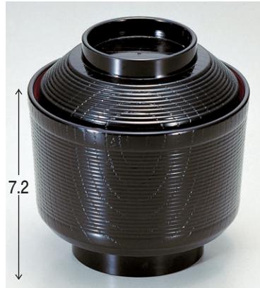
8-280-15 1-179-15 A千筋櫻小吸椀 黒内朱 ¥900 (9φ×9.5) 椀100 230cc