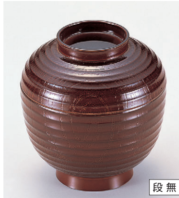
8-280-14 1-178-15 A チョーチン小吸椀 溜春慶 ¥900 (9.3φ×10) 椀200 260cc