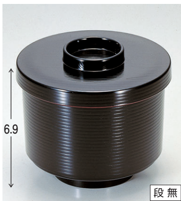
8-280-5 1-179-1 TA千筋小吸椀 黒内朱 ¥800 (9φ×7.9) 椀100 260cc