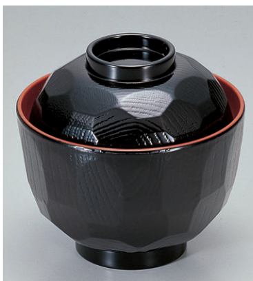
8-279-8 TA耐熱ニュー-3.2寸亀甲小吸椀 黒内朱 1-178-8 ¥780 (9.7φ×9.5) 椀200 180cc 8-279-9 A ニュー-3.2寸亀甲小吸椀 黒内朱 1-178-9 ¥510 (9.7φ×9.5) 椀200 180cc