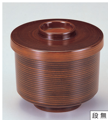
8-280-7 W-5-9 TA千筋小吸椀 枺 ¥1,000 (9φ×7.9) 椀100 260cc