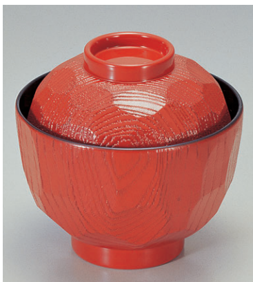
8-279-2 1-178-2 A 3.2寸亀甲小吸椀 朱 ¥550 (9.7φ×9.5) 椀200 180cc