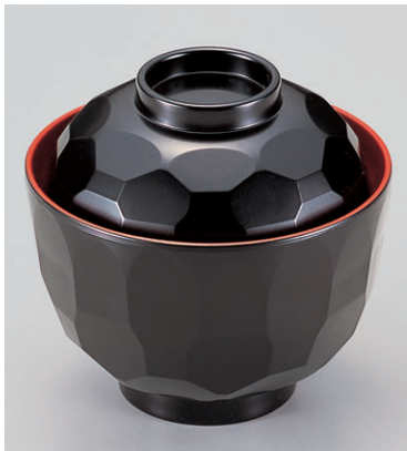
8-279-13 W-2-94 TA真3.2寸亀甲小吸椀 黒内朱 ¥650 (9.7φ×9.2) 椀200 190cc