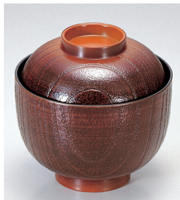
8-280-3 1-178-18 A 桐木目小吸椀 枺 ¥850 (9.5φ×9.5) 椀200 200cc