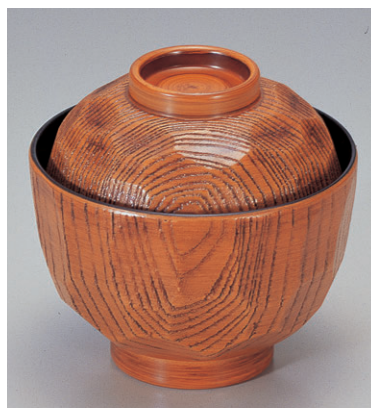
8-279-5 1-178-5 A 3.2寸亀甲小吸椀 枺 ¥900 (9.7φ×9.5) 椀200 180cc