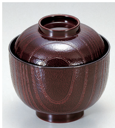
8-280-2 1-178-17 A 桐木目小吸椀 溜 ¥750 (9.5φ×9.5) 椀200 200cc