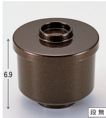
8-280-12 W-2-1 A切立小吸椀 梨地内朱 ¥800 (7.9φ×8) 椀200 240cc