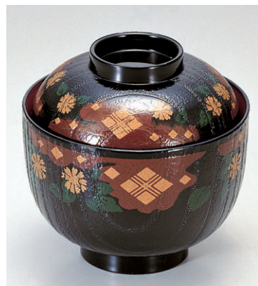
8-280-4 1-178-19 A 桐木目小吸椀 黒に正方寺 ¥1,450 (9.5φ×9.5) 椀200 200cc