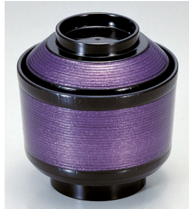
8-280-16 1-179-16 A千筋櫻小吸椀 バイオレット ¥1,400 (9φ×9.5) 椀100 230cc