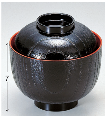
8-280-1 1-178-16 A 桐木目小吸椀 黒内朱 ¥700 (9.5φ×9.5) 椀200 200cc