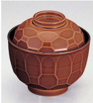
8-279-20 1-8-7 TA真3.2寸亀甲小吸椀 漆調春慶塗 ¥1,700 (9.7φ×9.2) 椀200 190cc