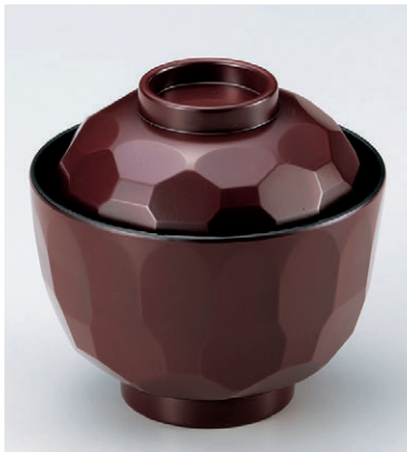
8-279-14 W-9-92 TA真3.2寸亀甲小吸椀 吟朱 ¥700 (9.7φ×9.2) 椀200 190cc