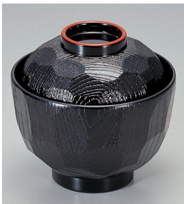
8-279-3 1-178-3 A 3.2寸亀甲小吸椀 黒天朱 ¥550 (9.7φ×9.5) 椀200 180cc