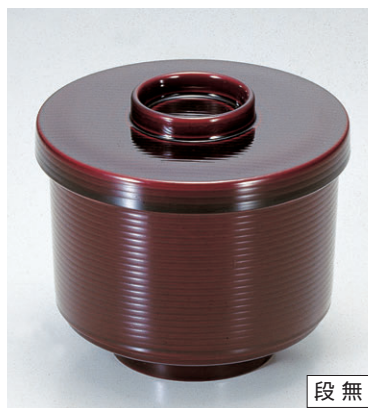
8-280-6 1-179-2 TA千筋小吸椀 溜内朱 ¥900 (9φ×7.9) 椀100 260cc