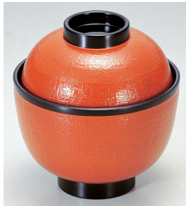
8-280-10 1-179-6 A 3.2寸布目小吸椀 朱帯ツバ黒 ¥700 (9.5φ×10) 椀200 220cc