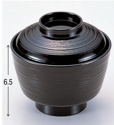
8-279-17 W-5-46 TA天竜寺吸物椀 黒 ¥800 (9.4φ×8.7) 椀200 180cc