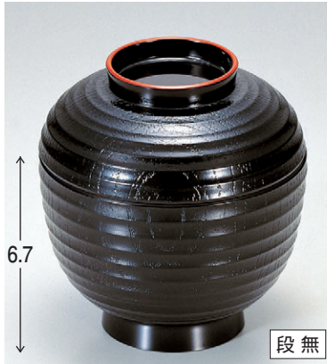
8-280-13 1-178-14 A チョーチン小吸椀 黒天朱 ¥700 (9.3φ×10) 椀200 260cc