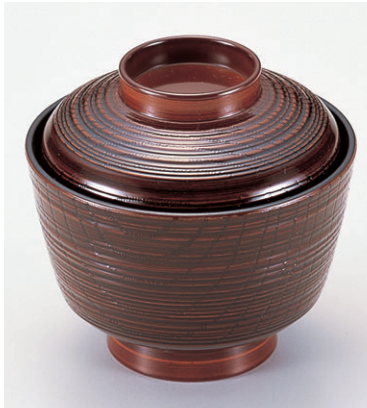
8-279-19 W-5-47 TA天竜寺吸物椀 枺 ¥950 (9.4φ×8.7) 椀200 180cc