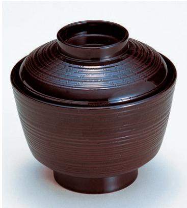
8-279-18 W-3-45 TA天竜寺吸物椀 溜 ¥850 (9.4φ×8.7) 椀200 180cc