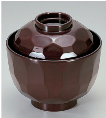
8-279-15 TA真3.2寸亀甲小吸椀 溜 1-178-13 ¥800 (9.7φ×9.2) 椀200 190cc 8-279-16 TA真3.2寸亀甲小吸椀 溜内朱 W-2-95 ¥800 (9.7φ×9.2) 椀200 190cc