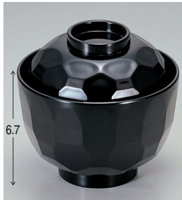
8-279-12 1-178-12 TA真3.2寸亀甲小吸椀 黒 ¥650 (9.7φ×9.2) 椀200 190cc