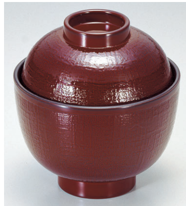
8-280-11 1-179-7 A 3.2寸布目小吸椀 溜 ¥750 (9.5φ×10) 椀200 220cc