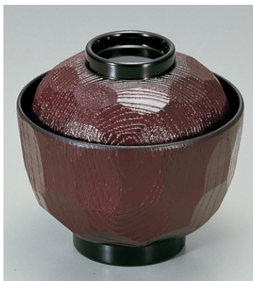
8-279-4 1-178-4 A 3.2寸亀甲小吸椀 溜 ¥600 (9.7φ×9.5) 椀200 180cc