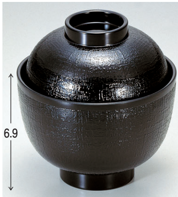
8-280-9 1-179-5 A 3.2寸布目小吸椀 黒 ¥650 (9.5φ×10) 椀200 220cc