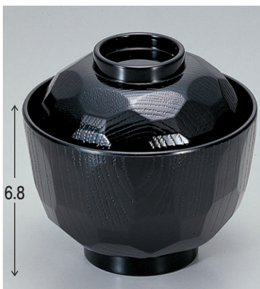
8-279-6 TA耐熱ニュー-3.2寸亀甲小吸椀 黒 1-178-6 ¥650 (9.7φ×9.5) 椀200 180cc 8-279-7 A ニュー-3.2寸亀甲小吸椀 黒 1-178-7 ¥500 (9.7φ×9.5) 椀200 180cc