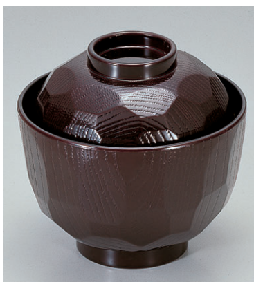
8-279-10 TA耐熱ニュー-3.2寸亀甲小吸椀 溜 1-178-10 ¥850 (9.7φ×9.5) 椀200 180cc 8-279-11 A ニュー-3.2寸亀甲小吸椀 溜 1-178-11 ¥600 (9.7φ×9.5) 椀200 180cc