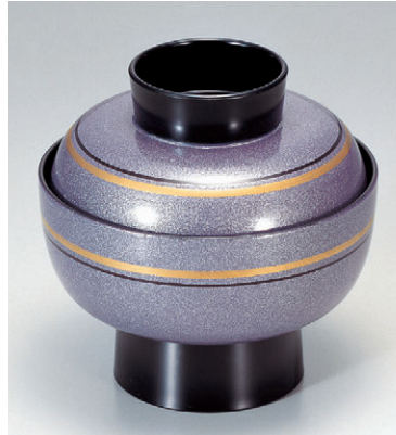
8-274-6 1-174-3 TA 古代碗 紫パールライン ¥2,600 (11.3φ×11.2) 梱100 250cc