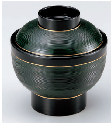
8-274-15 W-10-9 TA 高台千筋碗 緑刷毛目金線 ¥2,100 (11.2φ×11.6) 梱100 330cc