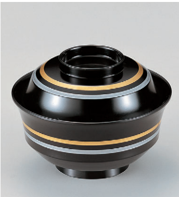
8-273-15 W-5-31 M 竹型吸碗 黒にライン ¥1,900 (12.2φ×8.7) 梱100 280cc