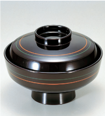
8-273-10 1-186-7 M 天竜寺吸碗 溜朱緑線引 ¥2,000 (12φ×8.8) 梱100 250cc