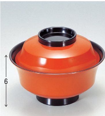
8-273-14 1-187-13 M 竹型吸碗 朱 ¥1,450 (12.2φ×8.7) 梱100 280cc