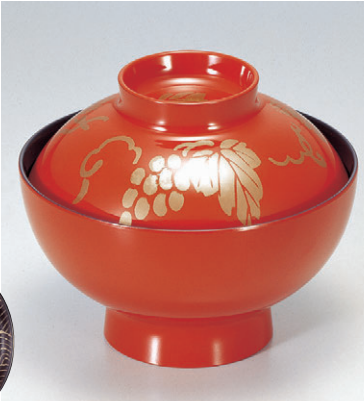
8-273-7 1-174-15 TM 花仙才碗 朱ブドウ S・H 塗 ¥3,950 (12φ×10.2) 梱100 260cc