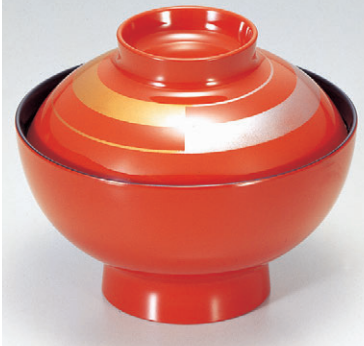
8-273-4 1-174-12 TM 花仙才碗 朱帯市松 S・H 塗 ¥3,650 (12φ×10.2) 梱100 260cc