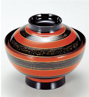
8-273-5 1-174-13 TM 花仙才碗 朱金かすり ¥3,400 (12φ×10.2) 梱100 260cc