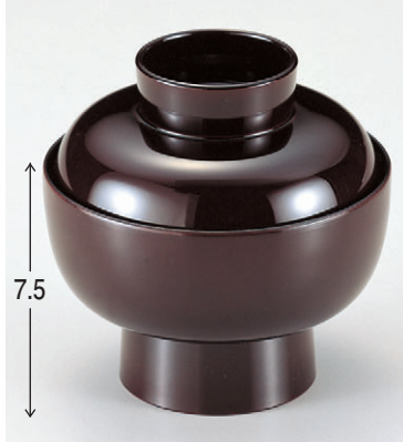
8-274-1 W-5-28 TA 古代碗 溜 ¥1,800 (11.3φ×11.2) 梱100 250cc