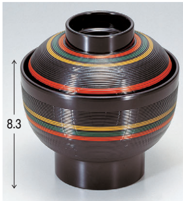
8-274-13 1-174-7 TA 高台千筋碗 ロク口目 ¥1,800 (11.2φ×11.6) 梱100 330cc