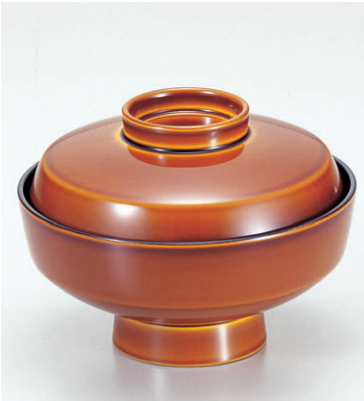
8-273-11 1-8-13 M 天竜寺吸碗 漆調春慶塗 ¥2,750 (12φ×8.8) 梱100 250cc