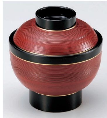
8-274-16 W-10-10 TA 高台千筋碗 赤刷毛目金線 ¥2,100 (11.2φ×11.6) 梱100 330cc