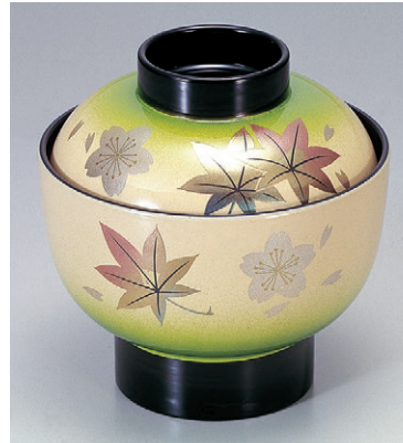
8-274-12 1-176-15 TA 高台碗 グリーンかすみ春秋 ¥3,950 (11.2φ×11.6) 梱100 330cc