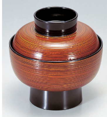
8-274-2 1-174-1 TA 古代碗 春慶刷毛目 ¥2,050 (11.3φ×11.2) 梱100 250cc