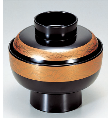
8-274-8 1-174-6 TA 古代碗 黒金帯松葉 ¥3,100 (11.3φ×11.2) 梱100 250cc