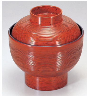
8-274-14 1-174-8 TA 高台千筋碗 後藤塗 ¥1,850 (11.2φ×11.6) 梱100 330cc