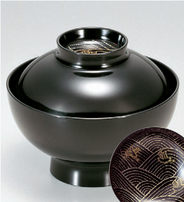
8-273-6 1-174-14 TM 花仙才碗 黒青海波千鳥見返付 ¥3,750 (12φ×10.2) 梱100 260cc