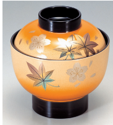
8-274-11 1-176-16 TA 高台碗 オレンジかすみ春秋 ¥3,950 (11.2φ×11.6) 梱100 330cc