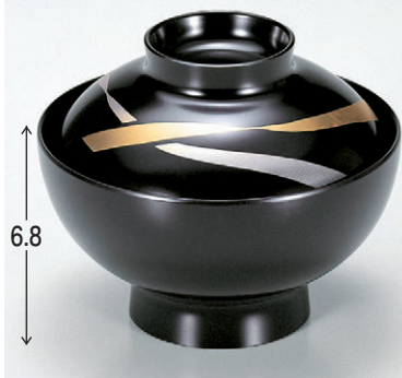
8-273-1 1-174-9 TM 花仙才碗 黒花帯 ¥3,300 (12φ×10.2) 梱100 260cc