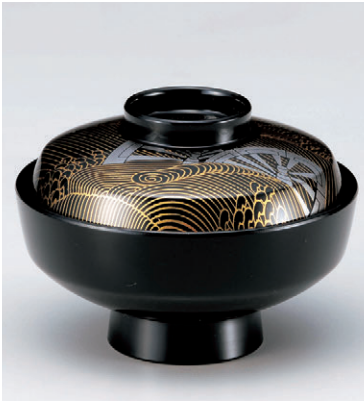
8-273-12 W-10-92 M 天竜寺吸碗 黒御所車 S・H 塗 ¥3,500 (12φ×8.8) 梱100 250cc