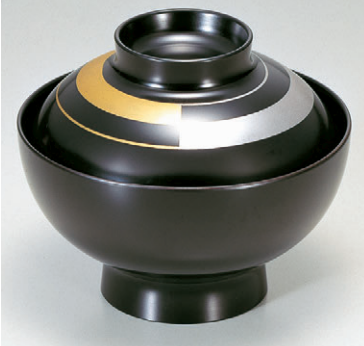
8-273-3 1-174-11 TM 花仙才碗 黒帯市松 ¥3,500 (12φ×10.2) 梱100 260cc