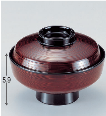
8-273-9 W-5-30 M 天竜寺吸碗 溜刷毛目 ¥1,900 (12φ×8.8) 梱100 250cc