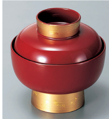
8-274-7 W-12-52 TA 古代碗 朱高台帯金箔 ¥3,200 (11.3φ×11.2) 梱100 250cc