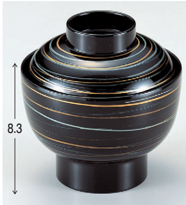
8-274-9 W-5-29 TA 高台碗 黒あやひも ¥2,000 (11.2φ×11.6) 梱100 330cc