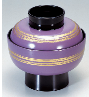
8-274-3 1-176-14 TA 古代碗 バイオレット金一筆 ¥2,400 (11.3φ×11.2) 梱100 250cc