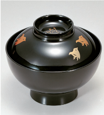
8-273-8 1-174-16 TM 花仙才碗 黒千鳥 S・H 塗 ¥3,900 (12φ×10.2) 梱100 260cc