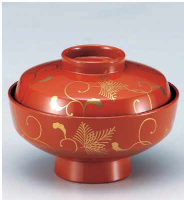
8-273-13 W-10-93 M 天竜寺吸碗 朱松唐草 S・H 塗 ¥3,400 (12φ×8.8) 梱100 250cc