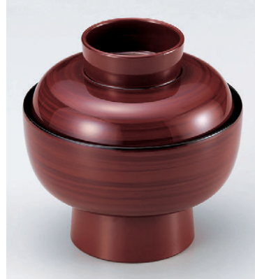
8-274-4 W-10-8 TA 古代碗 朱木目 ¥1,700 (11.3φ×11.2) 梱100 250cc