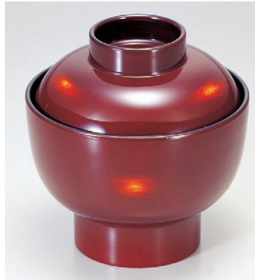
8-274-10 1-176-13 TA 高台碗 溜別甲 ¥2,150 (11.2φ×11.6) 梱100 330cc