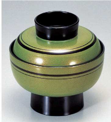
8-274-5 1-174-4 TA 古代碗 うぐいすパールライン ¥2,550 (11.3φ×11.2) 梱100 250cc