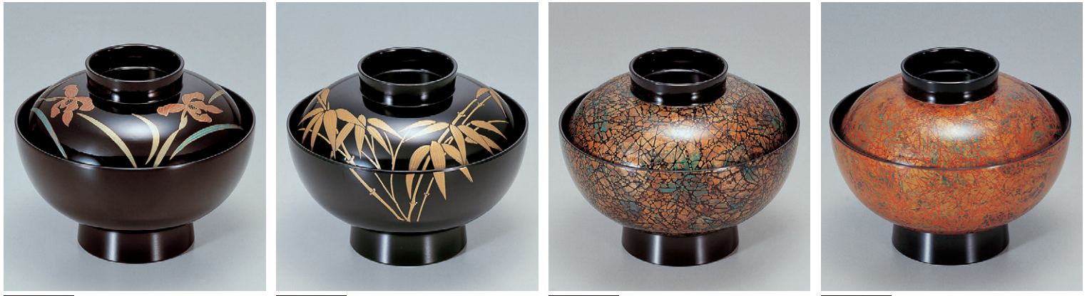
8-268-5 1-170-5 TM 御殿吸椀 黒蘭 S-H塗 ¥3,900 (12φ×9.6) 椀100 250cc 8-268-6 1-170-6 TM 御殿吸椀 若竹 ¥3,700 (12φ×9.6) 椀100 250cc 8-268-7 1-170-7 TM 御殿吸椀 黒虹彩 ¥3,650 (12φ×9.6) 椀100 250cc 8-268-8 1-170-8 TM 御殿吸椀 朱虹彩 ¥3,750 (12φ×9.6) 椀100 250cc