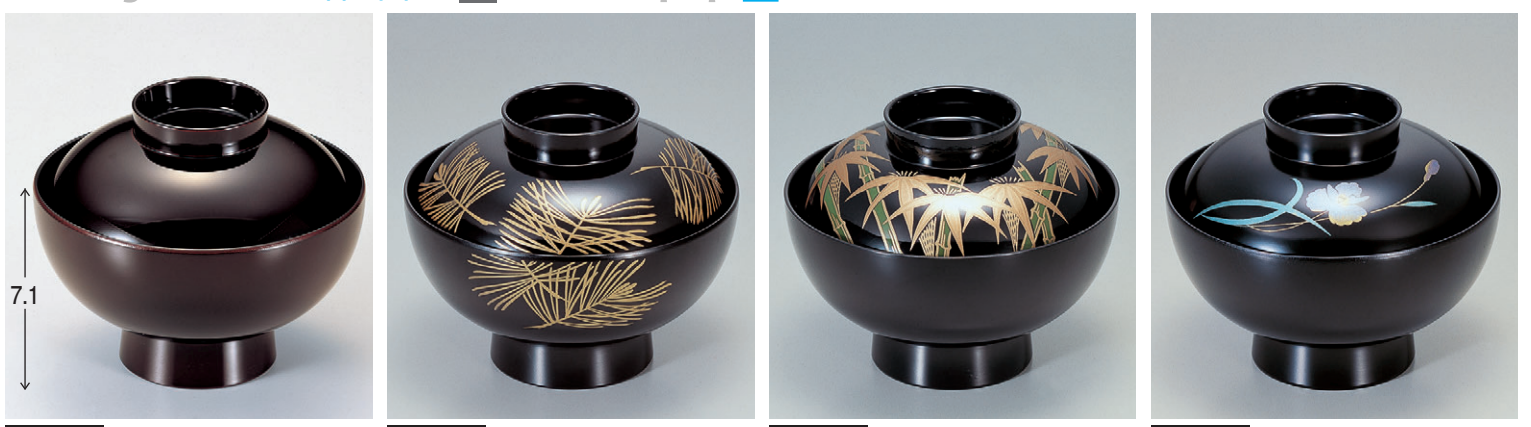
8-268-1 W-5-22 TM 御殿吸椀 溜 ¥1,850 (12φ×9.6) 椀100 250cc 8-268-2 1-170-1 TM 御殿吸椀 黒に松葉 ¥3,100 (12φ×9.6) 椀100 250cc 8-268-3 1-170-2 TM 御殿吸椀 黒竹 S-H塗 ¥3,250 (12φ×9.6) 椀100 250cc 8-268-4 1-170-4 TM 御殿吸椀 なでしこ ¥3,650 (12φ×9.6) 椀100 250cc