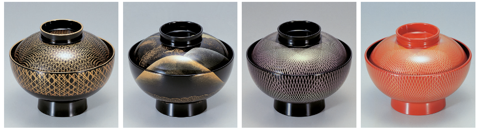
8-267-13 1-172-9 TA 御殿吸椀 黒武蔵野天金 S-H塗 ¥4,550 (12φ×10) 椀100 290cc 8-267-14 1-172-10 TM 御殿吸椀 遠山 S-H塗 ¥5,100 (12φ×9.6) 椀100 290cc 8-267-15 1-172-11 TA 御殿吸椀 紫金彩 S-H塗 ¥5,550 (12φ×10) 椀100 290cc 8-267-16 1-173-16 TA 御殿吸椀 朱新武蔵野 エース塗 ¥5,750 (12φ×10) 椀100 290cc