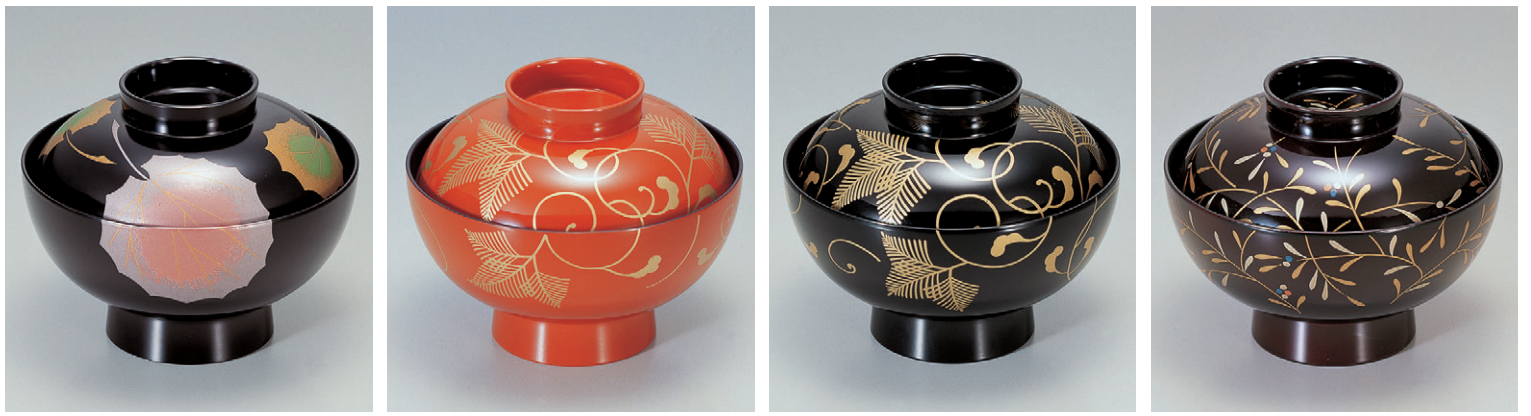
8-268-12 1-170-12 TM 御殿吸椀 黒ふき S-H塗 ¥3,950 (12φ×9.6) 椀100 250cc 8-268-13 1-170-13 TM 御殿吸椀 朱松唐草 S-H塗 ¥3,950 (12φ×9.6) 椀100 250cc 8-268-14 1-170-14 TM 御殿吸椀 黒松唐草 S-H塗 ¥3,950 (12φ×9.6) 椀100 250cc 8-268-15 1-170-15 TM 御殿吸椀 溜南天 S-H塗 ¥4,800 (12φ×9.6) 椀100 250cc