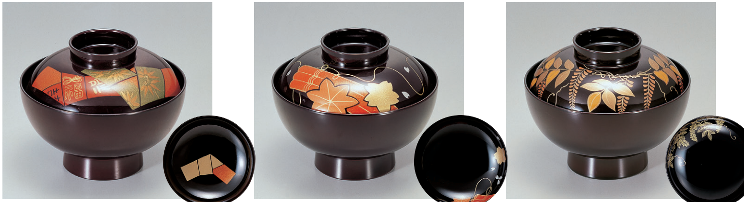
8-268-9 1-170-9 TM 御殿吸椀 溜結び見返付 S-H塗 ¥3,800 (12φ×9.6) 椀100 250cc 8-268-10 1-170-10 TM 御殿吸椀 溜花イカダ見返付 S-H塗 ¥3,900 (12φ×9.6) 椀100 250cc 8-268-11 1-170-11 TM 御殿吸椀 溜藤見返付 S-H塗 ¥3,950 (12φ×9.6) 椀100 250cc