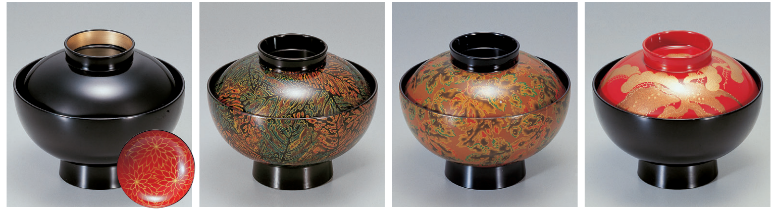
8-267-9 1-172-5 TA 御殿吸椀 黒見返朱総菊 S-H塗 ¥3,850 (12φ×10) 椀100 290cc 8-267-10 1-172-6 TA 御殿吸椀 木の葉 ¥3,750 (12φ×10) 椀100 290cc 8-267-11 1-172-7 TA 御殿吸椀 万葉菊 ¥3,800 (12φ×10) 椀100 290cc 8-267-12 1-172-8 TA 御殿吸椀 日の出塗老松 S-H塗 ¥4,350 (12φ×10) 椀100 290cc