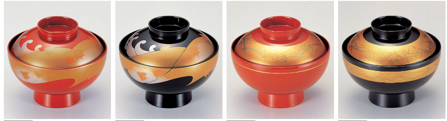
8-267-5 1-173-9 TA 御殿吸椀 朱波千鳥 ¥2,750 (12φ×10) 椀100 290cc 8-267-6 1-173-10 TA 御殿吸椀 黒波千鳥 ¥2,850 (12φ×10) 椀100 290cc 8-267-7 1-173-11 TA 御殿吸椀 朱金帯稲穂 ¥2,900 (12φ×10) 椀100 290cc 8-267-8 1-173-12 TA 御殿吸椀 黒帯金松葉 ¥3,000 (12φ×10) 椀100 290cc