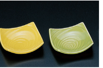
8-1156-27 H-11-28 陶うず珍味 黄 ¥220 (7.3×7.3×2.1) 梱100 8-1156-28 H-11-29 陶うず珍味 グリーン ¥220 (7.3×7.3×2.1) 梱100