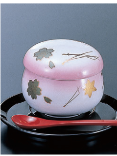
8-1155-5 陶茶碗蒸し(小) H-6-44 ピンク春秋 限定品 ¥730 (8.2φ×6.5)