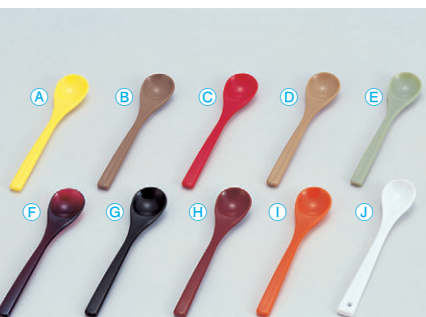
8-1155-11 茶碗蒸しスプーン (13.1×2.7) 梱1,000 A 1-772-39 [A] イエロー ¥190 B 1-772-40 [A] グレー ¥190 C 1-772-41 [A] 赤 ¥130 D 1-772-42 [A] ベージュ ¥190 E 1-772-43 [A] グリーン ¥190 F 1-772-44 [AC] 別甲 ¥240 G H-1-37 [A] 黒 ¥190 H H-1-38 [A] ブラウン ¥190 I H-1-39 [A] オレンジ ¥190 J H-1-40 陶白磁 限定品 ¥200