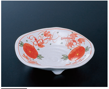
8-1155-18 H-8-76 陶変わり丸皿 赤絵 限定品 ¥430 (13.2×13.4×3.6)