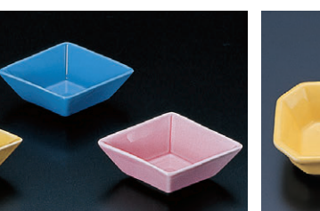
8-1156-34 H-11-22 陶高菱形珍味 黄 ¥250 (11×7.3×3.5) 梱100 8-1156-35 H-11-23 陶高菱形珍味 トルコ ¥250 (11×7.3×3.5) 梱100 8-1156-36 H-11-24 陶高菱形珍味 ピンク ¥250 (11×7.3×3.5) 梱100