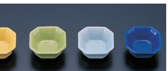
8-1156-37 1-337-23 陶ミニ隅切角鉢 黄 ¥230 (6.4×6.4×3) 梱200 8-1156-38 1-337-24 陶ミニ隅切角鉢 グリーン ¥230 (6.4×6.4×3) 梱200 8-1156-39 1-337-25 陶ミニ隅切角鉢 青磁 ¥230 (6.4×6.4×3) 梱200 8-1156-40 1-337-26 陶ミニ隅切角鉢 ルリ ¥230 (6.4×6.4×3) 梱200