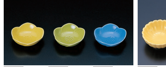
8-1156-41 H-11-32 陶梅珍味 黄 ¥200 (6.6×6.5×2.1) 梱100 8-1156-42 H-11-33 陶梅珍味 ヒワグリーン ¥200 (6.6×6.5×2.1) 梱100 8-1156-43 H-11-34 陶梅珍味 トルコ ¥200 (6.6×6.5×2.1) 梱100