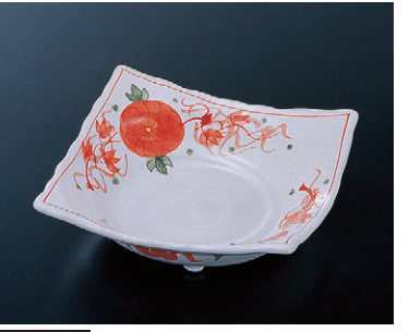
8-1155-19 H-8-69 陶四方角皿 赤絵 限定品 ¥680 (15×15×5)