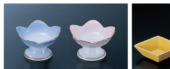
8-1156-32 H-11-20 陶高台珍味 淡青ぼかし天金 ¥460 (7.5×7.2×4.6) 梱100 8-1156-33 H-11-21 陶高台珍味 ピンクぼかし天金 ¥460 (7.5×7.2×4.6) 梱100