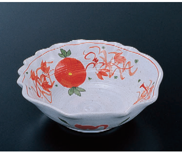
8-1155-17 H-8-75 陶波鉢 赤絵 限定品 ¥600 (15φ×4.8)