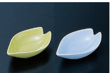
8-1156-4 H-10-95 陶小桜珍味 ヒワグリーン ¥180 (8.7×5.7×2) 梱100 8-1156-5 H-10-96 陶小桜珍味 青磁 ¥180 (8.7×5.7×2) 梱100