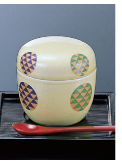
8-1155-8 陶ナツメ蒸し籠 クリーム金 H-6-43 ¥800 (7.8φ×8.5) 限定品