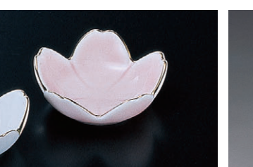
8-1156-21 H-11-17 陶三ツ葉珍味 黄 ¥320 (8×8×6.1) 梱100 8-1156-22 H-11-18 陶三ツ葉珍味 青磁 ¥320 (8×8×6.1) 梱100 8-1156-23 H-11-19 陶三ツ葉珍味 ピンク ¥320 (8×8×6.1) 梱100