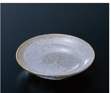
8-1155-12 H-8-63 陶小皿 グレイ筆 限定品 ¥350 (9.5φ×2.3)