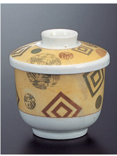
8-1155-4 1-872-5 陶茶碗蒸し 升ちらし 限定品 ¥850 (8.4φ×8.6)