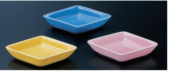
8-1156-29 H-11-25 陶低菱形珍味 黄 ¥450 (14.5×8.5×2.8) 梱80 8-1156-30 H-11-26 陶低菱形珍味 トルコ ¥450 (14.5×8.5×2.8) 梱80 8-1156-31 H-11-27 陶低菱形珍味 ピンク ¥450 (14.5×8.5×2.8) 梱80