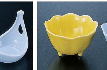
8-1156-13 H-11-13 陶花形珍味 黄 ¥380 (8φ×5) 梱100 8-1156-14 H-11-14 陶花形珍味 青磁 ¥380 (8φ×5) 梱100 8-1156-15 H-11-15 陶花形珍味 ルリ ¥380 (8φ×5) 梱100 8-1156-16 H-11-16 陶花形珍味 ピンク ¥380 (8φ×5) 梱100