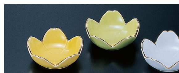
8-1156-17 H-11-9 陶桜珍味 黄天金 ¥350 (8.4×8×3) 梱100 8-1156-18 H-11-10 陶桜珍味 ヒワグリーン天金 ¥350 (8.4×8×3) 梱100 8-1156-19 H-11-11 陶桜珍味 青磁天金 ¥350 (8.4×8×3) 梱100 8-1156-20 H-11-12 陶桜珍味 ピンク天金 ¥350 (8.4×8×3) 梱100