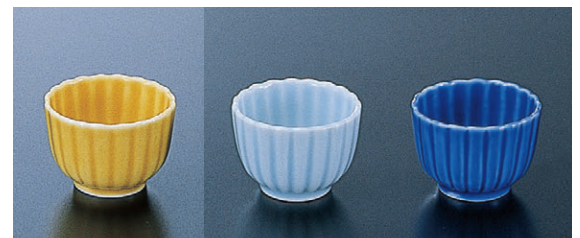
8-1156-1 H-10-90 陶菊珍味 黄 ¥200 (4.9φ×3.5) 梱100 8-1156-2 H-10-92 陶菊珍味 青磁 ¥200 (4.9φ×3.5) 梱100 8-1156-3 H-10-93 陶菊珍味 ルリ ¥200 (4.9φ×3.5) 梱100