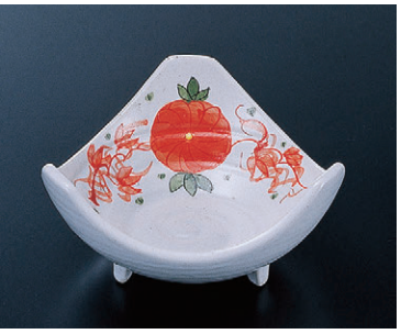
8-1155-15 H-8-73 陶三ツ山小鉢 赤絵 限定品 ¥650 (13.6×13.3×6.7)