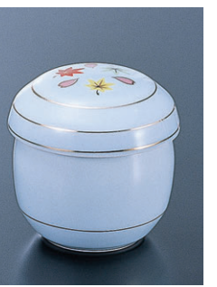
8-1155-10 H-6-42 陶かぶせ蒸し碗 春秋 限定品 ¥800 (7.5φ×7.7)