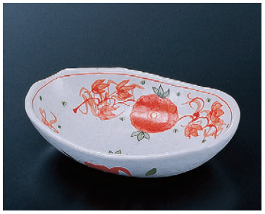
8-1155-14 H-8-72 陶小判鉢(小) 赤絵 限定品 ¥500 (15.5×10.9×3.8)