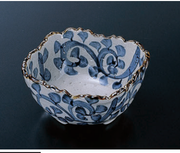
8-1155-21 H-8-68 陶角小鉢 唐草 限定品 ¥580 (10.5×10.8×0)