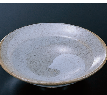
8-1155-13 H-8-64 陶大皿 グレイ筆 限定品 ¥780 (16.3φ×4.4)