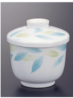
8-1155-3 1-872-4 陶茶碗蒸し 舞葉 限定品 ¥850 (8.4φ×8.6)