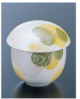
8-1155-7 H-10-54 陶茶碗蒸し 竜田川 限定品 ¥850 (9.1φ×9)