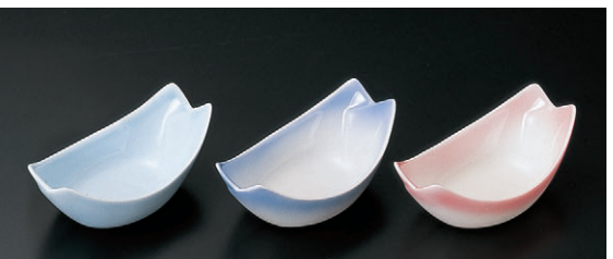
8-1156-6 H-10-99 陶笹珍味 青磁 ¥330 (10×5.8×3.8) 梱100 8-1156-7 H-11-1 陶笹珍味 淡青ぼかし ¥330 (10×5.8×3.8) 梱100 8-1156-8 H-11-2 陶笹珍味 ピンクぼかし ¥330 (10×5.8×3.8) 梱100