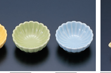
8-1156-44 1-337-17 陶菊鉢(浅) 黄 ¥270 (7.3φ×3) 梱100 8-1156-45 1-337-18 陶菊鉢(浅) グリーン ¥270 (7.3φ×3) 梱100 8-1156-46 1-337-19 陶菊鉢(浅) 青磁 ¥270 (7.3φ×3) 梱100