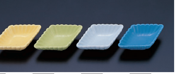
8-1156-47 1-337-35 陶菱型陶器 黄 ¥270 (10.8×6.8×2.9) 梱100 8-1156-48 1-337-36 陶菱型陶器 グリーン ¥270 (10.8×6.8×2.9) 梱100 8-1156-49 1-337-37 陶菱型陶器 青磁 ¥270 (10.8×6.8×2.9) 梱100 8-1156-50 1-337-38 陶菱型陶器 トルコ ¥270 (10.8×6.8×2.9) 梱100