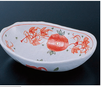
8-1155-20 H-8-71 陶小判鉢(大) 赤絵 限定品 ¥850 (20.5×(4.7×5.7))