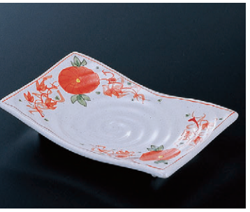
8-1155-16 H-8-74 陶長角皿 赤絵 限定品 ¥650 (17.5×11.2×2.8)