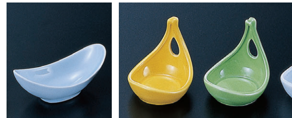
8-1156-9 H-11-4 陶三日月珍味 青磁 ¥330 (10.7×5×4.5) 梱100 8-1156-10 H-11-6 陶びわ珍味 黄 ¥330 (6.2×6.5×7.5) 梱100 8-1156-11 H-11-7 陶びわ珍味 ヒワグリーン ¥330 (6.2×6.5×7.5) 梱100 8-1156-12 H-11-8 陶びわ珍味 青磁 ¥330 (6.2×6.5×7.5) 梱100