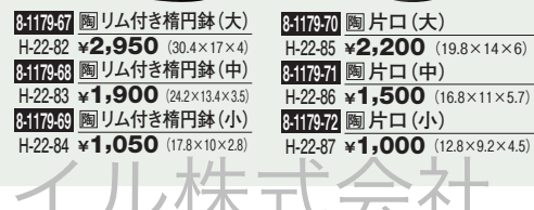
8-1179-67 陶リム付き楕円鉢(大) H-22-82 ¥2,950 (30.4×17×4) 8-1179-68 陶リム付き楕円鉢(中) H-22-83 ¥1,900 (24.2×13.4×3.5) 8-1179-69 陶リム付き楕円鉢(小) H-22-84 ¥1,050 (17.8×10×2.8) 8-1179-70 陶片口(大) H-22-85 ¥2,200 (19.8×14×6) 8-1179-71 陶片口(中) H-22-86 ¥1,500 (16.8×11×5.7) 8-1179-72 陶片口(小) H-22-87 ¥1,000 (12.8×9.2×4.5)