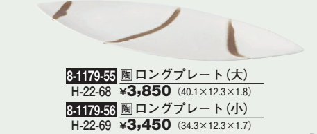
8-1179-55 陶ロングプレート(大) H-22-68 ¥3,850 (40.1×12.3×1.8) 8-1179-56 陶ロングプレート(小) H-22-69 ¥3,450 (34.3×12.3×1.7)