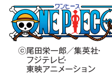
©尾田栄一郎/集英社 フジテレビ 東映アニメーション