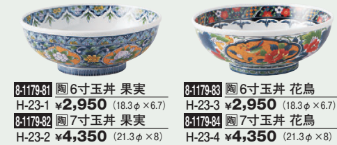
8-1179-81 陶6寸玉井 果実 H-23-1 ¥2,950 (18.3φ×6.7) 8-1179-82 陶7寸玉井 果実 H-23-2 ¥4,350 (21.3φ×8) 8-1179-83 陶6寸玉井 花鳥 H-23-3 ¥2,950 (18.3φ×6.7) 8-1179-84 陶7寸玉井 花鳥 H-23-4 ¥4,350 (21.3φ×8)