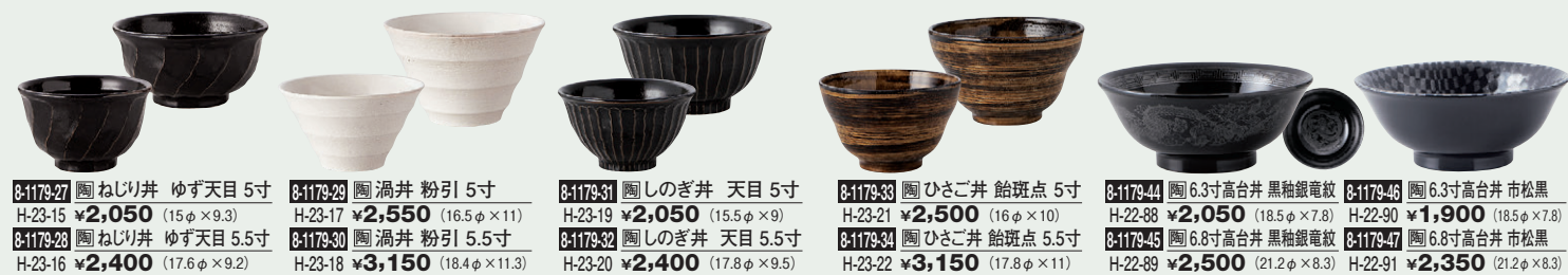
8-1179-27 陶ねじり井 ゆず天目 5寸 H-23-15 ¥2,050 (15φ×9.3) 8-1179-28 陶ねじり井 ゆず天目 5.5寸 H-23-16 ¥2,400 (17.6φ×9.2) 8-1179-29 陶渦井 粉引 5寸 H-23-17 ¥2,550 (16.5φ×11) 8-1179-30 陶渦井 粉引 5.5寸 H-23-18 ¥3,150 (18.4φ×11.3) 8-1179-31 陶しのぎ井 天目 5寸 H-23-19 ¥2,050 (15.5φ×9) 8-1179-32 陶しのぎ井 天目 5.5寸 H-23-20 ¥2,400 (17.8φ×9.5) 8-1179-33 陶ひさご井 鉛斑点 5寸 H-23-21 ¥2,500 (16φ×10) 8-1179-34 陶ひさご井 鉛斑点 5.5寸 H-23-22 ¥3,150 (17.8φ×11) 8-1179-44 陶6.3寸高台井 黒釉銀電紋 H-22-88 ¥2,050 (18.5φ×7.8) 8-1179-45 陶6.8寸高台井 黒釉銀電紋 H-22-89 ¥2,500 (21.2φ×8.3) 8-1179-46 陶6.3寸高台井 市松黒 H-22-90 ¥1,900 (18.5φ×7.8) 8-1179-47 陶6.8寸高台井 市松黒 H-22-91 ¥2,350 (21.2φ×8.3)