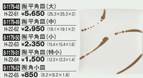
8-1179-48 陶平角皿(大) H-22-61 ¥5,650 (25.3×25.3×2) 8-1179-49 陶平角皿(中) H-22-62 ¥2,950 (19.1×19.1×2) 8-1179-50 陶平角皿(小) H-22-63 ¥2,350 (15.4×15.4×1.6) 8-1179-51 陶平角皿(特小) H-22-64 ¥1,500 (12.3×12.3×1.4) 8-1179-52 陶角小皿 H-22-65 ¥850 (8.2×8.2×1.8)