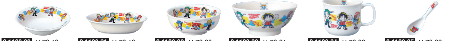
8-1180-30 H-73-18 陶フルーツ ワンピース ¥590 (15φ×4) 楕90 8-1180-31 H-73-19 陶カレー ワンピース ¥860 (18×13×4) 楕48 8-1180-32 H-73-20 陶茶碗 ワンピース ¥530 (10.5φ×4.5) 楕120 8-1180-33 H-73-21 陶ラーメン ワンピース ¥860 (14.5φ×6) 楕48 8-1180-34 H-73-22 陶マグ ワンピース ¥690 (7.5φ×6) 楕72 8-1180-35 H-73-23 陶レンゲ ワンピース ¥360 (14) 楕200