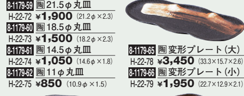
8-1179-65 陶変形プレート(大) H-22-76 ¥3,450 (33.3×15.7×2.6) 8-1179-66 陶変形プレート(小) H-22-77 ¥1,950 (22.7×12.9×2.1)