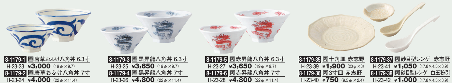
8-1179-1 陶唐草おふけ八角井 6.3寸 H-23-23 ¥3,000 (19φ×9.7) 8-1179-2 陶唐草おふけ八角井 7寸 H-23-24 ¥4,000 (22φ×11.4) 8-1179-3 陶黒昇龍八角井 6.3寸 H-23-25 ¥3,650 (19φ×9.7) 8-1179-4 陶黒昇龍八角井 7寸 H-23-26 ¥4,800 (22φ×11.4) 8-1179-5 陶赤昇龍八角井 6.3寸 H-23-27 ¥3,650 (19φ×9.7) 8-1179-6 陶赤昇龍八角井 7寸 H-23-28 ¥4,800 (22φ×11.4) 8-1179-35 陶十角皿 赤志野 H-23-39 ¥1,900 (23φ×3) 8-1179-36 陶3寸皿 赤志野 H-23-40 ¥750 (9.5φ×2.4) 8-1179-37 陶砂目型レンゲ 赤志野 H-23-41 ¥1,050 (17.8×4.5×3.9) 8-1179-38 陶砂目型レンゲ 白玉粉引 H-23-42 ¥1,000 (17.8×4.5×3.9)