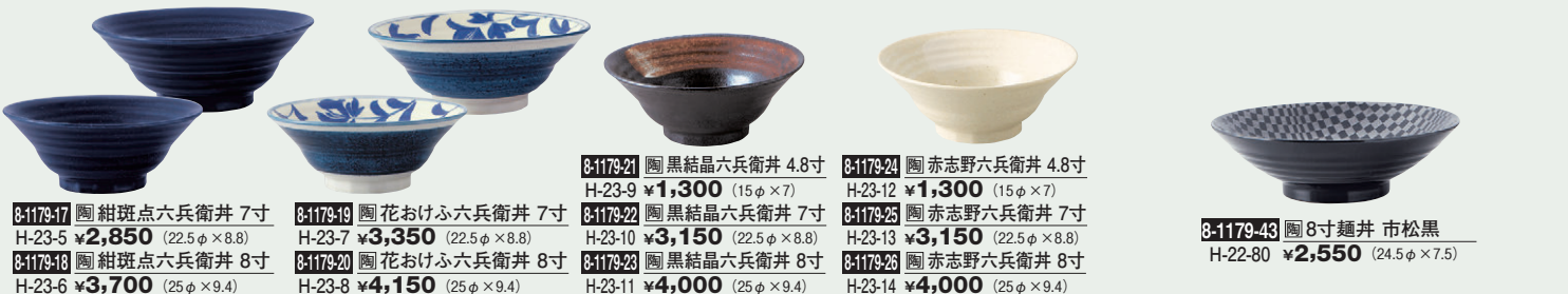
8-1179-17 陶紺斑点六兵衛井 7寸 H-23-5 ¥2,850 (22.5φ×8.8) 8-1179-18 陶紺斑点六兵衛井 8寸 H-23-6 ¥3,700 (25φ×9.4) 8-1179-19 陶花おけふ六兵衛井 7寸 H-23-7 ¥3,350 (22.5φ×8.8) 8-1179-20 陶花おけふ六兵衛井 8寸 H-23-8 ¥4,150 (25φ×9.4) 8-1179-21 陶黒結晶六兵衛井 4.8寸 H-23-9 ¥1,300 (15φ×7) 8-1179-22 陶黒結晶六兵衛井 7寸 H-23-10 ¥3,150 (22.5φ×8.8) 8-1179-23 陶赤志野六兵衛井 7寸 H-23-11 ¥4,000 (25φ×9.4) 8-1179-24 陶赤志野六兵衛井 8寸 H-23-12 ¥1,300 (15φ×7) 8-1179-25 陶赤志野六兵衛井 7寸 H-23-13 ¥3,150 (22.5φ×8.8) 8-1179-26 陶赤志野六兵衛井 8寸 H-23-14 ¥4,000 (25φ×9.4) 8-1179-43 陶8寸麵井 市松黒 H-22-80 ¥2,550 (24.5φ×7.5)