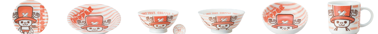
8-1180-18 H-73-6 陶ケーキ皿 チョッパーRD ¥530 (16φ) 楕100 8-1180-19 H-73-7 陶ミニカレー皿 チョッパーRD ¥630 (17φ×4.5) 楕48 8-1180-20 H-73-8 陶茶碗 チョッパーRD ¥540 (11φ×5.5) 楕72 8-1180-21 H-73-9 陶ラーメン丼 チョッパーRD ¥850 (16φ×7) 楕36 8-1180-22 H-73-10 陶小鉢 チョッパーRD ¥630 (17φ×4.5) 楕48 8-1180-23 H-73-11 陶マグ チョッパーRD ¥690 (7.5φ×7) 楕72