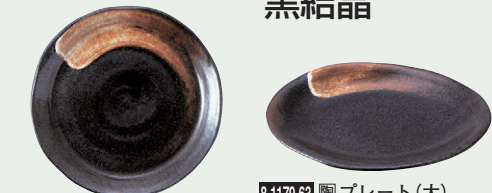
8-1179-57 陶27φ丸皿 H-22-70 ¥3,700 (26.8φ×2.9) 8-1179-58 陶24φ丸皿 H-22-71 ¥2,550 (24.2φ×2.5) 8-1179-59 陶21.5φ丸皿 H-22-72 ¥1,900 (21.2φ×2.3) 8-1179-60 陶18.5φ丸皿 H-22-73 ¥1,500 (18.2φ×2.3) 8-1179-61 陶14.5φ丸皿 H-22-74 ¥1,050 (14.6φ×1.8) 8-1179-62 陶11φ丸皿 H-22-75 ¥850 (10.9φ×1.5)