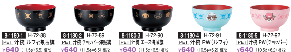
8-1180-1 H-72-88 PET汁椀 ルフィ海賊旗 ¥640 (11.5φ×6.5) 楕72 8-1180-2 H-72-89 PET汁椀 チョッパー海賊旗 ¥640 (11.5φ×6.5) 楕72 8-1180-3 H-72-90 PET汁椀 エース海賊旗 ¥640 (11.5φ×6.5) 楕72 8-1180-4 H-72-91 PET汁椀 PW(ルフィ) ¥640 (10.5φ×6.2) 楕72 8-1180-5 H-72-92 PET汁椀 PW(チョッパー) ¥640 (10.5φ×6.2) 楕72