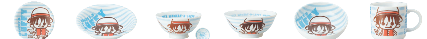
8-1180-12 H-72-99 陶ケーキ皿 ルフィ ¥530 (16φ) 楕100 8-1180-13 H-73-1 陶ミニカレー皿 ルフィ ¥630 (17φ×4.5) 楕48 8-1180-14 H-73-2 陶茶碗 ルフィ ¥540 (11φ×5.5) 楕72 8-1180-15 H-73-3 陶ラーメン丼 ルフィ ¥850 (16φ×7) 楕36 8-1180-16 H-73-4 陶小鉢 ルフィ ¥630 (17φ×4.5) 楕48 8-1180-17 H-73-5 陶マグ ルフィ ¥690 (7.5φ×7) 楕72