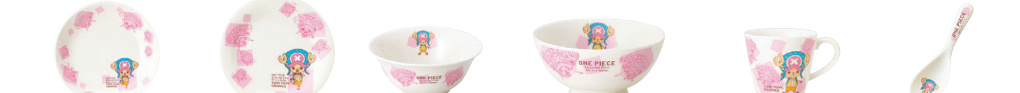
8-1180-24 H-73-12 陶フルーツ チョッパー ¥710 (15.5φ) 楕100 8-1180-25 H-73-13 陶カレー皿 チョッパー ¥940 (19.5φ×4) 楕48 8-1180-26 H-73-14 陶茶碗 チョッパー ¥730 (11φ×5.5) 楕100 8-1180-27 H-73-15 陶ミニラーメン丼 チョッパー ¥950 (15.5φ×7) 楕36 8-1180-28 H-73-16 陶マグ チョッパー ¥820 (6φ×8) 楕72 8-1180-29 H-73-17 陶レンゲ チョッパー ¥420 (14) 楕200