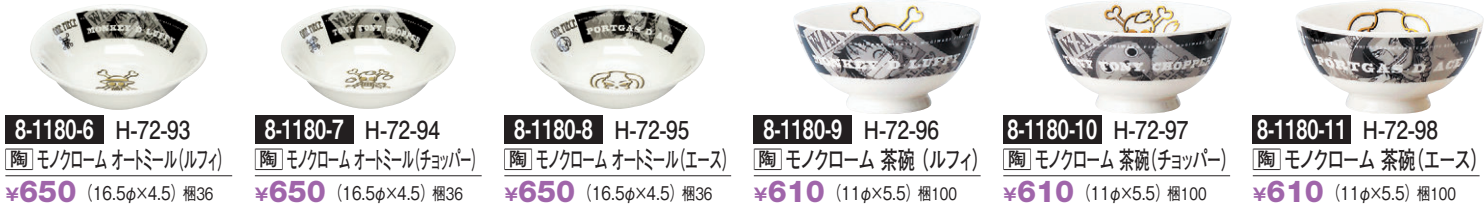
8-1180-6 H-72-93 陶モノクローム オートミール(ルフィ) ¥650 (16.5φ×4.5) 楕36 8-1180-7 H-72-94 陶モノクローム オートミール(チョッパー) ¥650 (16.5φ×4.5) 楕36 8-1180-8 H-72-95 陶モノクローム オートミール(エース) ¥650 (16.5φ×4.5) 楕36 8-1180-9 H-72-96 陶モノクローム 茶碗 (ルフィ) ¥610 (11φ×5.5) 楕100 8-1180-10 H-72-97 陶モノクローム 茶碗(チョッパー) ¥610 (11φ×5.5) 楕100 8-1180-11 H-72-98 陶モノクローム 茶碗(エース) ¥610 (11φ×5.5) 楕100