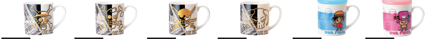
8-1180-42 H-73-30 陶モノクローム マグ(ルフィ) ¥800 (8φ×9) 楕60 8-1180-43 H-73-31 陶モノクローム マグ(チョッパー) ¥800 (8φ×9) 楕60 8-1180-44 H-73-32 陶モノクローム マグ(ゾロ) ¥800 (8φ×9) 楕60 8-1180-45 H-73-33 陶モノクローム マグ(エース) ¥800 (8φ×9) 楕60 8-1180-46 H-73-34 陶ブラキップ PW(ルフィ) ¥830 (9φ×8 779φ) 楕60 8-1180-47 H-73-35 陶ブラキップ PW(チョッパー) ¥830 (9φ×8 779φ) 楕60