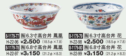
8-1179-77 陶6.3寸高台井 鳳凰 H-22-96 ¥2,500 (18.5φ×7.8) 8-1179-78 陶6.8寸高台井 鳳凰 H-22-97 ¥3,150 (21.2φ×8.3) 8-1179-79 陶6.3寸高台井 花 H-22-98 ¥2,500 (18.5φ×7.8) 8-1179-80 陶6.8寸高台井 花 H-22-99 ¥3,150 (21.2φ×8.3)