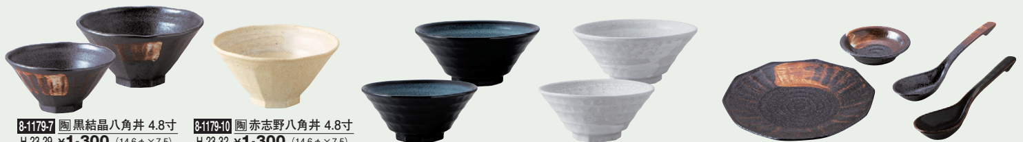
8-1179-7 陶黒結晶八角井 4.8寸 H-23-29 ¥1,300 (14.6φ×7.5) 8-1179-8 陶黒結晶八角井 6.3寸 H-23-30 ¥2,850 (19φ×9.7) 8-1179-9 陶黒結晶八角井 7寸 H-23-31 ¥3,850 (22φ×11.4) 8-1179-10 陶赤志野八角井 4.8寸 H-23-32 ¥1,300 (14.6φ×7.5) 8-1179-11 陶赤志野八角井 6.3寸 H-23-33 ¥2,850 (19φ×9.7) 8-1179-12 陶赤志野八角井 7寸 H-23-34 ¥3,850 (22φ×11.4) 8-1179-13 陶黒雲竜鳴門反井 6.5寸 H-23-35 ¥2,850 (20φ×8.9) 8-1179-14 陶黒雲竜鳴門反井 7寸 H-23-36 ¥3,150 (21.5φ×9.5) 8-1179-15 陶古染白刷毛鳴門反井 6.5寸 H-23-37 ¥2,850 (20φ×8.9) 8-1179-16 陶古染白刷毛鳴門反井 7寸 H-23-38 ¥3,150 (21.5φ×9.5) 8-1179-39 陶十角皿 黒結晶 H-23-43 ¥1,900 (23φ×3) 8-1179-40 陶3寸皿 黒結晶 H-23-44 ¥750 (9.5φ×2.4) 8-1179-41 陶砂目型レンゲ 黒結晶 H-23-45 ¥1,050 (17.8×4.5×3.9) 8-1179-42 陶砂目型レンゲ 天目 H-36-52 ¥1,000 (17.8×4.5×3.9)