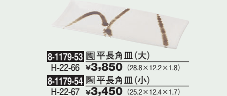
8-1179-53 陶平長角皿(大) H-22-66 ¥3,850 (28.8×12.2×1.8) 8-1179-54 陶平長角皿(小) H-22-67 ¥3,450 (25.2×12.4×1.7)