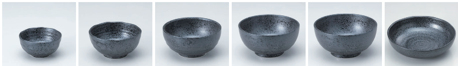
8-1177-1 H-91-56 陶いぶし黒 9cmボール ¥550 (9.4φ×4.8) 8-1177-2 H-91-57 陶いぶし黒 11cmボール ¥600 (11φ×5.5) 8-1177-3 H-91-58 陶いぶし黒 4寸井 ¥950 (12.7φ×6.1) 8-1177-4 H-91-59 陶いぶし黒 4.5寸井 ¥1,050 (14.3φ×7) 8-1177-5 H-91-60 陶いぶし黒 5寸井 ¥1,400 (16φ×7.9) 8-1177-6 H-91-61 陶いぶし黒 6.5ボール ¥1,600 (20.1φ×5.8)