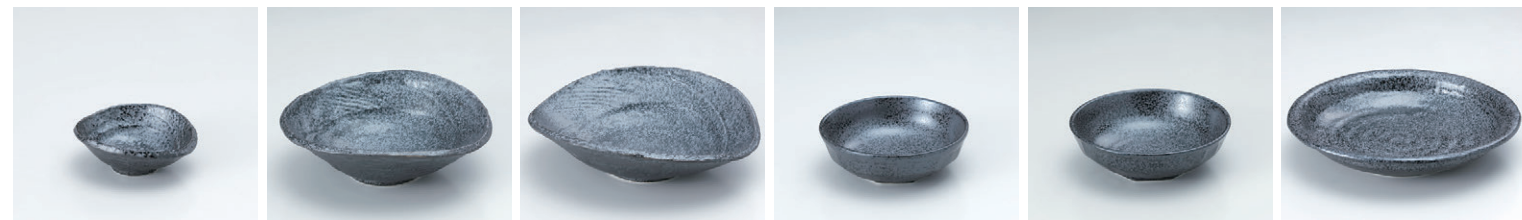
8-1178-1 H-91-91 陶いぶし黒 扇千代口 ¥750 (8.3×7.4×3.3) 8-1178-2 H-91-92 陶いぶし黒 扇中鉢 ¥1,400 (17.4×16.5×5.3) 8-1178-3 H-91-93 陶いぶし黒 扇大鉢 ¥2,700 (20.5×18.2×5.7) 8-1178-4 H-91-94 陶いぶし黒 石垣42ボール ¥700 (13φ×4.3) 8-1178-5 H-91-95 陶いぶし黒 石垣45ボール ¥800 (15φ×4.6) 8-1178-6 H-91-96 陶いぶし黒 舞煮物鉢 ¥2,550 (22.7φ×4.4)