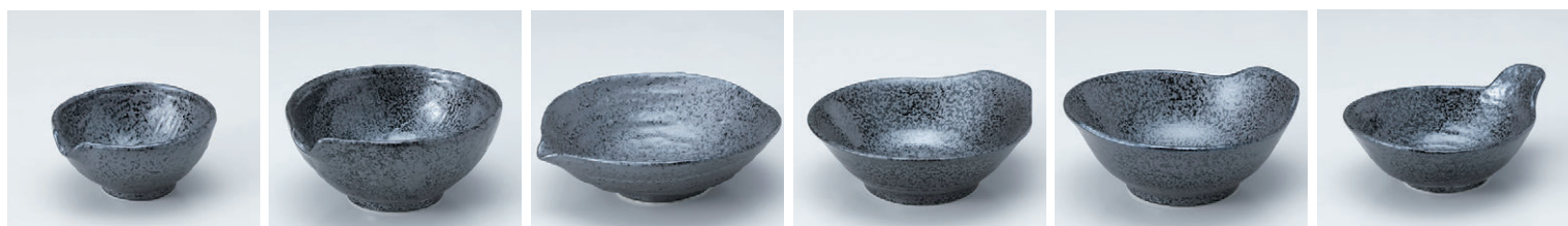
8-1177-19 H-91-75 陶いぶし黒 片口小付 ¥700 (9.3×9.1×4.5) 8-1177-20 H-91-76 陶いぶし黒 片口深鉢 ¥1,200 (14.2×13.3×6.4) 8-1177-21 H-91-77 陶いぶし黒 片口煮物鉢 ¥1,450 (17×16.2×5.3) 8-1177-22 H-91-78 陶いぶし黒 新トンスイ ¥650 (13×12.5×4.5) 8-1177-23 H-91-79 陶いぶし黒 とんすい(大) ¥950 (14.1×13.3×5.5) 8-1177-24 H-91-80 陶いぶし黒 純トンスイ ¥950 (14.5×11.6×4.7)