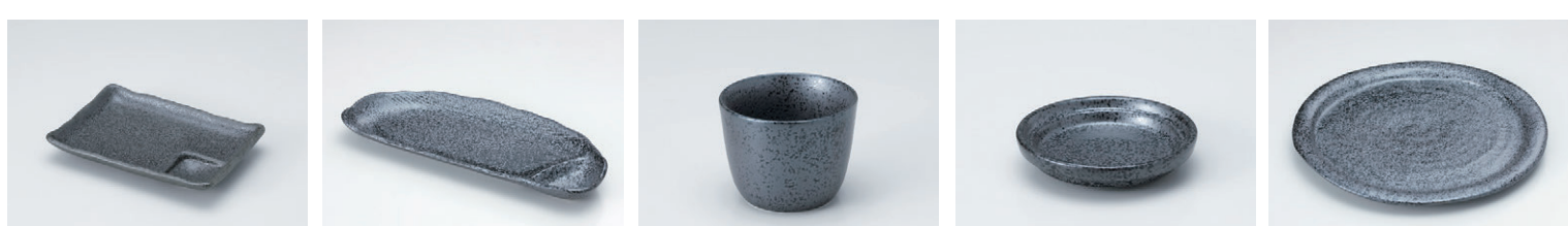
8-1177-31 H-91-86 陶いぶし黒 仕切り付き串皿 ¥1,200 (17.2×11.9×2.6) 8-1177-32 H-91-87 陶いぶし黒 半月皿 ¥1,700 (28.2×12×2.5) 8-1177-33 H-91-88 陶いぶし黒 蕎麦猪口 ¥750 (8.5φ×6.6) 8-1177-34 H-91-89 陶いぶし黒 薬味皿(小) ¥600 (8.9φ×1.9) 8-1177-35 H-91-90 陶いぶし黒 8寸波皿 ¥2,950 (24.7φ×2.2)