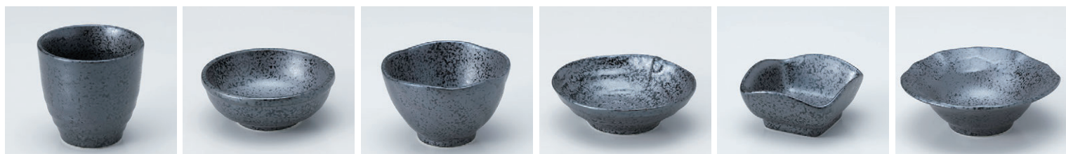
8-1177-13 H-91-68 陶いぶし黒 平成ゆのみ ¥700 (7.8φ×7.6) 8-1177-14 H-91-69 陶いぶし黒 28ボール ¥600 (9.3φ×3.6) 8-1177-15 H-91-70 陶いぶし黒 五つ山小鉢 ¥650 (9φ×5.6) 8-1177-16 H-91-71 陶いぶし黒 とじめ小鉢 ¥800 (9.8×8.9×3) 8-1177-17 H-91-72 陶いぶし黒 四つ山珍味 ¥700 (7.8×7.8×3.8) 8-1177-18 H-91-73 陶いぶし黒 石垣小鉢 ¥700 (12.4φ×4.1)