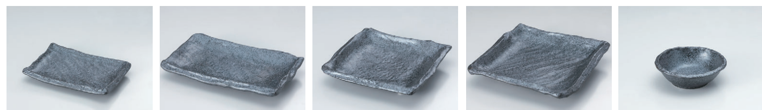
8-1178-12 H-92-3 陶いぶし黒 匠 17.5cm串皿 ¥1,250 (17.5×12.2×2.6) 8-1178-13 H-92-4 陶いぶし黒 匠 22cm焼物皿 ¥2,250 (22×13.7×3) 8-1178-14 H-92-5 陶いぶし黒 匠 19cm正角皿 ¥2,400 (19×19×3.7) 8-1178-15 H-92-6 陶いぶし黒 匠 23cm正角皿 ¥3,600 (23×23×4.5) 8-1178-16 H-92-7 陶いぶし黒 凧 12cm小鉢 ¥1,100 (12.5×12.2×4.2)