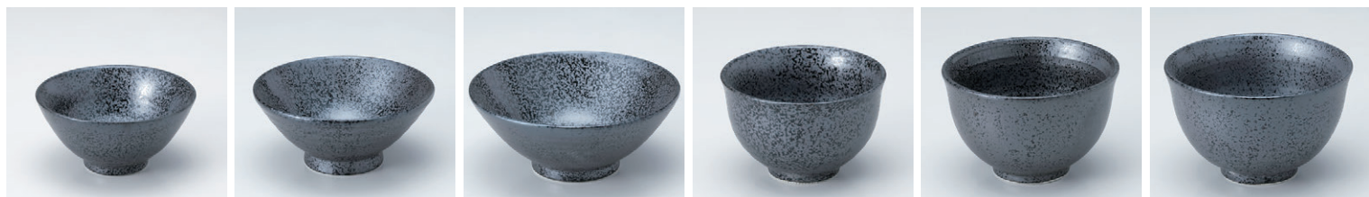
8-1177-7 H-91-62 陶いぶし黒 平成茶碗 ¥700 (12.1φ×6) 8-1177-8 H-91-63 陶いぶし黒 43ライス井 ¥950 (13.7φ×6.1) 8-1177-9 H-91-64 陶いぶし黒 48ライス井 ¥1,100 (15.4φ×6.4) 8-1177-10 H-91-65 陶いぶし黒 姫茶碗 ¥750 (10.2φ×6.6) 8-1177-11 H-91-66 陶いぶし黒 反茶碗 ¥900 (11.6φ×7.5) 8-1177-12 H-91-67 陶いぶし黒 反タモリ ¥1,050 (13.1φ×8.2)