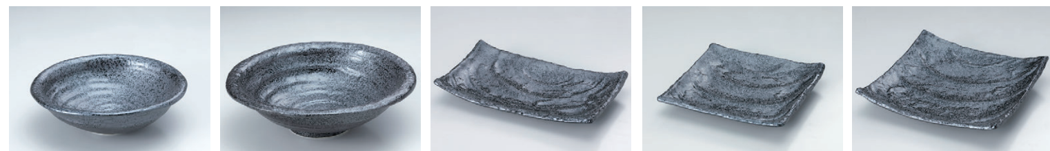
8-1178-7 H-91-97 陶いぶし黒 舞深鉢 ¥1,200 (20.2φ×6.2) 8-1178-8 H-91-98 陶いぶし黒 舞特大鉢 ¥4,200 (25.4φ×7.7) 8-1178-9 H-91-99 陶いぶし黒 極 23cm焼物皿 ¥2,250 (23×13.8×3) 8-1178-10 H-92-1 陶いぶし黒 極 19cm正角皿 ¥2,250 (19×19×3) 8-1178-11 H-92-2 陶いぶし黒 極 23cm正角皿 ¥3,600 (23×23×4.5)