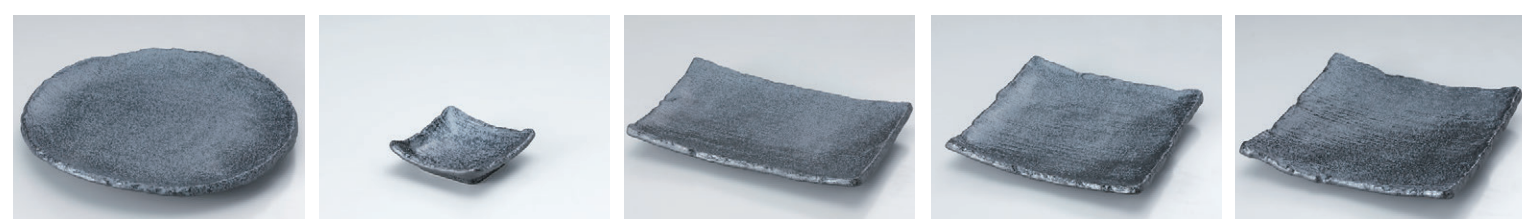
8-1178-17 H-92-8 陶いぶし黒 凧 25cm丸皿 ¥3,100 (25φ×3.1) 8-1178-18 H-92-9 陶いぶし黒 凧 8.5cm千代口 ¥800 (8.5×8.5×2.5) 8-1178-19 H-92-10 陶いぶし黒 凧 22cm焼物皿 ¥2,250 (22×14.2×3.2) 8-1178-20 H-92-11 陶いぶし黒 凧 19cm角皿 ¥2,400 (19.5×19.5×3) 8-1178-21 H-92-12 陶いぶし黒 凧 23cm角皿 ¥3,600 (23.5×23.5×3.5)