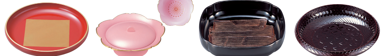
8-1135-12 [A]9寸一休鉢 朱内色紙金雅 M-15-18 ¥5,000 (27.4φ×4.3) 櫃40 8-1135-13 [A]さくら鉢 ピンク 櫃40 H-10-6 フタ ¥550 (16.1φ×3) H-10-7 身 ¥1,650 (22.2×21.5×16.8) 8-1135-14 [M]木瓜菓子鉢 うるみハケ目 H-10-8 ¥2,200 (20.2×20.2×4.4) 櫃50 8-1135-15 [M]7寸かごめ鉢 総溜 H-10-9 ¥2,750 (21φ×4) 櫃50