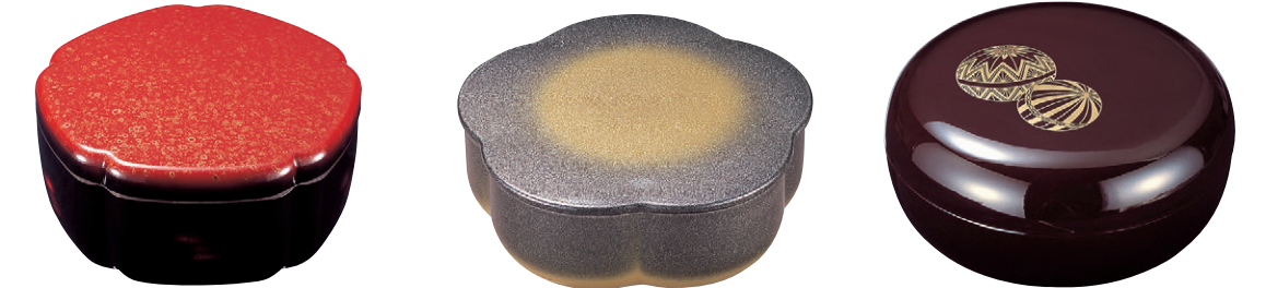
8-1135-1 [M]梅型菓子器 朱津軽 H-9-94 ¥3,700 (16.7×16.4×8.8) 櫃40 8-1135-2 [M]5.5寸梅菓子器 銀彩 H-9-95 ¥2,700 (16×15.6×7) 櫃40 8-1135-3 [M]6寸丸菓子鉢 新溜てまり H-9-96 ¥3,950 (17.8φ×9.3) 櫃40