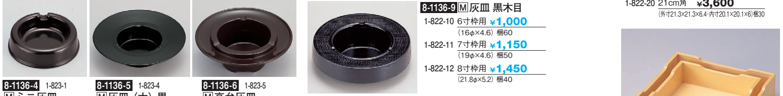
8-1136-4 [M]ミニ灰皿 1-823-1 ¥1,100 (9.3φ×2.5) 櫃180 8-1136-5 [M]灰皿 (大) 黒 1-823-4 ¥650 (17φ×4.1) 櫃80 8-1136-6 [M]高台灰皿 1-823-5 ¥1,900 (17.4φ×5.5) 櫃80 8-1136-9 [M]灰皿 黒木目 1-822-10 6寸枠用 ¥1,000 (16φ×4.6) 櫃60 1-822-11 7寸枠用 ¥1,150 (19φ×4.6) 櫃50 1-822-12 8寸枠用 ¥1,450 (21.8φ×5.2) 櫃40 8-1136-10 [M]灰皿 黒木目つゆ草 1-822-13 6寸枠用 ¥1,230 (16φ×4.6) 櫃60 1-822-14 7寸枠用 ¥1,450 (19φ×4.6) 櫃50 1-822-15 8寸枠用 ¥1,850 (21.8φ×5.2) 櫃40