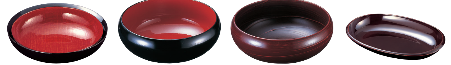
8-1135-8 [M]7寸布目菓子鉢 朱布目天黒 H-10-2 ¥2,750 (20.5φ×5.1) 櫃50 8-1135-9 [M]7.5寸寿楽鉢 黒内朱 M-12-21 ¥4,400 (22.6φ×8.6) 櫃30 8-1135-10 [M]7.5寸寿楽鉢 溜根来 M-12-22 ¥6,000 (22.6φ×8.6) 櫃30 8-1135-11 [M]小判溜取鉢 溜裏黒 H-10-5 ¥2,850 (26.9×18.5×3.9) 櫃40