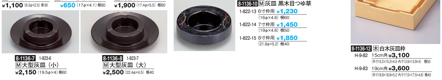
8-1136-7 [M]大型灰皿 (小) 1-823-6 ¥2,150 (19.5φ×4) 櫃60 8-1136-8 [M]大型灰皿 (大) 1-823-7 ¥2,500 (22.4φ×4.5) 櫃40