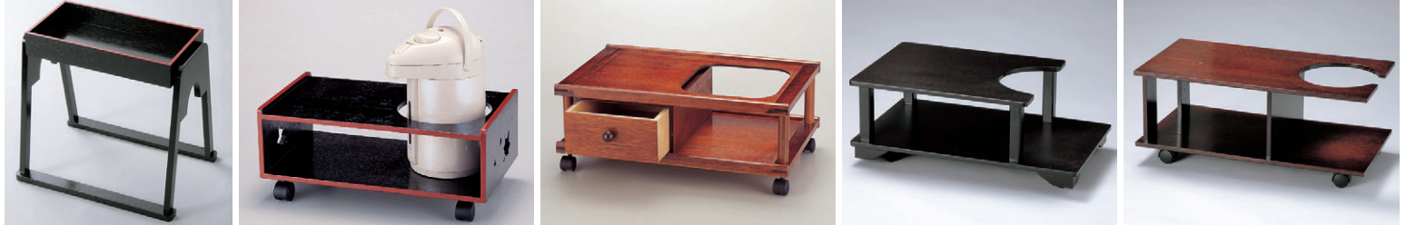
8-1136-36 困脇台 黒天朱 H-19-64 ¥22,000 (49×35×45) 櫃5 8-1136-37 困お座敷ワゴン 黒木目天朱(車付) 1-826-3 ¥22,000 (53.4×30×22.5) 櫃2 8-1136-38 困ホームワゴン ケヤキ 1-826-8 ¥25,000 (50.5×32.5×20.5) 櫃8 8-1136-39 困ポットワゴン うるみ石目 H-19-62 ¥37,000 (60×37×23) 櫃2 8-1136-40 困ポットワゴン けやき H-19-63 ¥41,000 (65×35×28) 櫃2