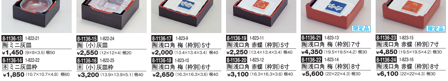
8-1136-13 1-822-21 陶ミニ灰皿 ¥1,450 (9×9×3.5) 櫃50 8-1136-14 1-822-22 困ミニ灰皿枠 ¥1,850 (10.7×10.7×4.8) 櫃60 8-1136-15 1-822-24 陶(小)灰皿 ¥2,550 (12×12×4) 櫃20 8-1136-16 1-822-25 困(小)灰皿枠 ¥3,200 (13.9×13.9×5.1) 櫃40 8-1136-17 1-823-9 陶浅口角 梅 (梓別) 5寸 ¥2,000 (13.4×13.4×3.4) 櫃40 8-1136-18 1-823-10 陶浅口角 梅 (梓別) 6寸 ¥2,650 (16.3×16.3×3.6) 櫃40 8-1136-19 1-823-11 陶浅口角 赤蝶 (梓別) 5寸 ¥2,250 (13.4×13.4×3.4) 櫃40 8-1136-20 1-823-12 陶浅口角 赤蝶 (梓別) 6寸 ¥3,100 (16.3×16.3×3.6) 櫃40 8-1136-21 1-823-13 陶浅口角 梅 (梓別) 7寸 ¥4,350 (19.5×19.5×4.2) 櫃30 8-1136-22 1-823-14 陶浅口角 梅 (梓別) 8寸 ¥5,600 (22×22×4.3) 櫃30 8-1136-23 1-823-15 陶浅口角 赤蝶 (梓別) 7寸 ¥4,850 (19.5×19.5×4.2) 櫃30 8-1136-24 1-823-16 陶浅口角 赤蝶 (梓別) 8寸 ¥6,100 (22×22×4.3) 櫃30