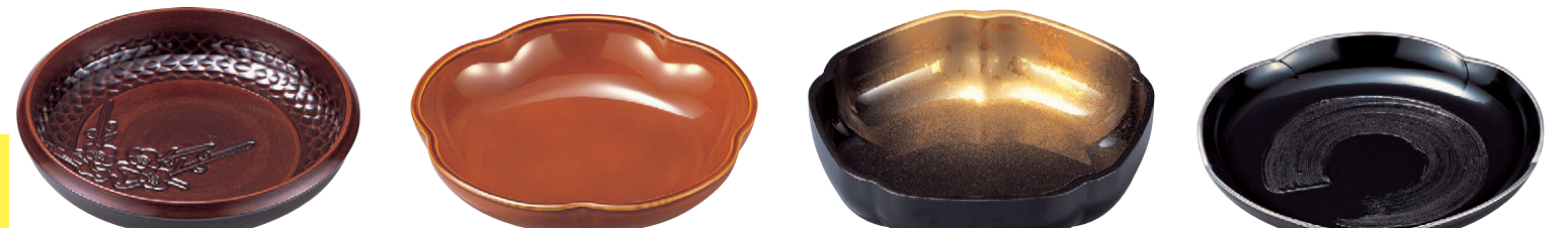
8-1135-16 [M]7寸枝梅鉢 枳 H-10-10 ¥2,200 (20.8φ×4) 櫃50 8-1135-17 [M]7.5寸紅梅鉢 漆調春慶塗 H-10-11 ¥2,750 (22.5×21.9×5.5) 櫃50 8-1135-18 [M]7.5寸梅型菓子鉢 パール色紙金箔 H-10-12 ¥3,450 (23.3×22.6×5.7) 櫃40 8-1135-19 [M]9寸ねじ梅鉢 黒一筆 H-10-14 ¥3,100 (27φ×4) 櫃30