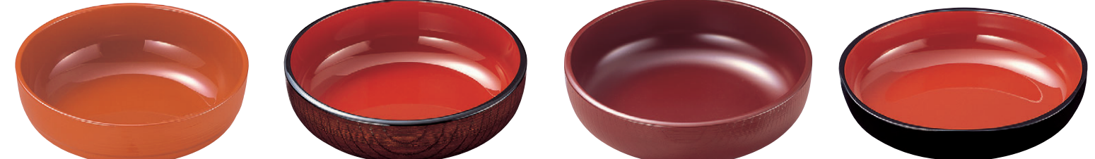
8-1135-4 [A]錦多用鉢 洗朱 H-9-97 ¥900 (17.2φ×5.5) 櫃60 8-1135-5 [A]6.5寸木目千筋菓子鉢 枳内朱 H-9-98 ¥1,550 (19.6φ×5.8) 櫃60 8-1135-6 [A]6.5寸木目千筋菓子鉢 銀朱 H-9-99 ¥1,150 (19.6φ×5.8) 櫃60 8-1135-7 [A]7寸福梅菓子鉢 朱淵黒 H-10-1 ¥1,200 (21φ×5) 櫃60