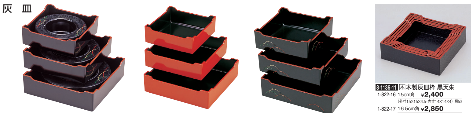
8-1136-1 [M]灰皿枠 黒天朱 (灰皿別) 1-822-1 6寸 ¥1,100 (外寸18×18×6.5 内寸16.9×16.9×4.6) 櫃40 1-822-2 7寸 ¥1,450 (外寸21×21×6.5 内寸19.7×19.7×5) 櫃30 1-822-3 8寸 ¥1,600 (外寸23.5×23.5×6.8 内寸22.5×22.5×4) 櫃20 8-1136-2 [M]灰皿枠 朱天朱 (灰皿別) 1-822-4 6寸 ¥1,100 (外寸18×18×6.5 内寸16.9×16.9×4.6) 櫃40 1-822-5 7寸 ¥1,450 (外寸21×21×6.5 内寸19.7×19.7×5) 櫃30 1-822-6 8寸 ¥1,600 (外寸23.5×23.5×6.8 内寸22.5×22.5×4) 櫃20 8-1136-3 [M]灰皿枠 つゆ草 1-822-7 6寸 ¥1,500 (外寸18×18×6.5 内寸16.9×16.9×4.6) 櫃40 1-822-8 7寸 ¥1,800 (外寸21×21×6.5 内寸19.7×19.7×5) 櫃30 1-822-9 8寸 ¥2,050 (外寸23.5×23.5×6.8 内寸22.5×22.5×4) 櫃20