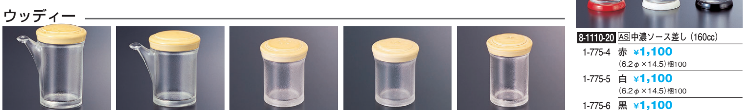
8-1110-8 1-774-3 ACY-2W ソース差し ウッディー ¥1,100 (7φ×10.5×12.3) 幅80 8-1110-9 1-774-4 ACY-1W しょう油差し ウッディー ¥1,000 (7φ×10.5×10.7) 幅100 8-1110-10 1-774-5 ACY-5W 胡椒入れ (5ツ穴) ウッディー ¥600 (4.5φ×7) 幅150 8-1110-11 1-774-6 ACY-4W 塩入れ (3ツ穴) ウッディー ¥600 (4.5φ×7) 幅150 8-1110-12 1-774-7 ACY-3W 楊子入れ (1ツ穴) ウッディー ¥600 (4.5φ×8) 幅150