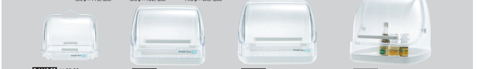
8-1110-29 H-35-93 ASシンプルフェイス カスター ¥3,100 (21.1×20.9×18.5) 幅12 8-1110-30 H-35-94 ASシンプルフェイス 24 ¥3,850 (24×22×18) 幅12 8-1110-31 H-35-95 ASシンプルフェイス 27 ¥4,500 (27×26×20.5) 幅12 8-1110-32 H-35-96 ASシンプルフェイス 27深 ¥5,250 (27.5×29×26) 幅8