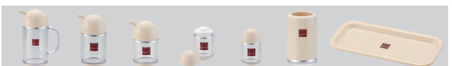
8-1110-22 H-35-86 ASピッチャー デイミュ ¥1,750 (7.3φ×15.6) 幅40 8-1110-23 H-35-87 ASしょう油差し (大) デイミュ ¥1,150 (5.9φ×11.8) 幅60 8-1110-24 H-35-88 ASしょう油差し (小) デイミュ ¥1,000 (5.9φ×10.2) 幅60 8-1110-25 H-35-89 AS調味料入れ デイミュ ¥850 (4.8φ×8.5) 幅60 8-1110-26 H-35-90 AS楊枝入れ デイミュ ¥800 (4.8φ×8.5) 幅60 8-1110-27 H-35-91 ASはし立て デイミュ ¥1,000 (7.4φ×12) 幅60 8-1110-28 H-35-92 ASデザートトレイ デイミュ ¥900 (24.1×11.5×1.8) 幅60