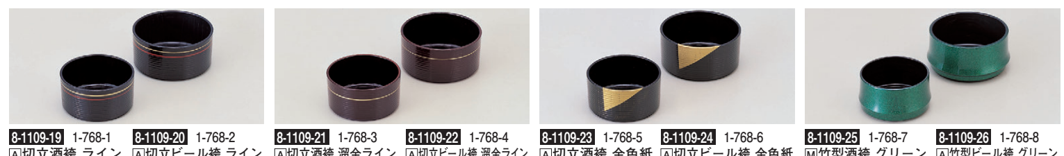
8-1109-19 1-768-1 A切立酒樽 ライン ¥700 (7.6φ×4) 幅200 8-1109-20 1-768-2 A切立ビール樽 ライン ¥800 (8.8φ×4.3) 幅200 8-1109-21 1-768-3 A切立酒樽 溜金ライン ¥800 (7.6φ×4) 幅200 8-1109-22 1-768-4 A切立ビール樽 溜金ライン ¥850 (8.8φ×4.3) 幅200 8-1109-23 1-768-5 A切立酒樽 金色紙 ¥800 (7.6φ×4) 幅200 8-1109-24 1-768-6 A切立ビール樽 金色紙 ¥850 (8.8φ×4.3) 幅200 8-1109-25 1-768-7 M竹型酒樽 グリーン ¥595 (7.7φ×4.1) 幅200 8-1109-26 1-768-8 A竹型ビール樽 グリーン ¥775 (9.1φ×4.8) 幅200