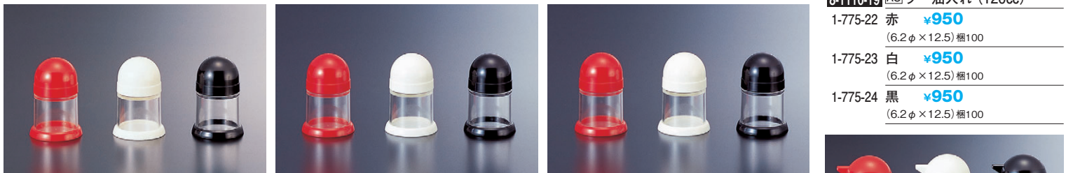
8-1110-5 AS胡椒入れ 1-775-13 赤 ¥670 (5.3φ×7.7) 幅150 1-775-14 白 ¥670 (5.3φ×7.7) 幅150 1-775-15 黒 ¥670 (5.3φ×7.7) 幅150 8-1110-6 AS塩入れ 1-775-16 赤 ¥670 (5.3φ×7.7) 幅150 1-775-17 白 ¥670 (5.3φ×7.7) 幅150 1-775-18 黒 ¥670 (5.3φ×7.7) 幅150 8-1110-7 AS楊子入れ 1-775-19 赤 ¥670 (5.3φ×7.7) 幅150 1-775-20 白 ¥670 (5.3φ×7.7) 幅150 1-775-21 黒 ¥670 (5.3φ×7.7) 幅150