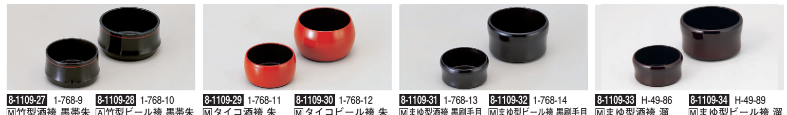
8-1109-27 1-768-9 M竹型酒樽 黒帯朱 ¥700 (7.7φ×4.1) 幅200 8-1109-28 1-768-10 A竹型ビール樽 黒帯朱 ¥800 (9.1φ×4.8) 幅200 8-1109-29 1-768-11 Mタイコ酒樽 朱 ¥730 (7.5φ×3) 幅200 8-1109-30 1-768-12 Mタイコビール樽 朱 ¥950 (8.5φ×3.6) 幅200 8-1109-31 1-768-13 Mまゆ型酒樽 黒刷毛目 ¥700 (7.3φ×3.4) 幅200 8-1109-32 1-768-14 Mまゆ型ビール樽 黒刷毛目 ¥950 (9.6φ×5.3) 幅200 8-1109-33 H-49-86 Mまゆ型酒樽 溜 ¥750 (7.3φ×3.4) 幅200 8-1109-34 H-49-89 Mまゆ型ビール樽 溜 ¥950 (9.6φ×5.3) 幅200