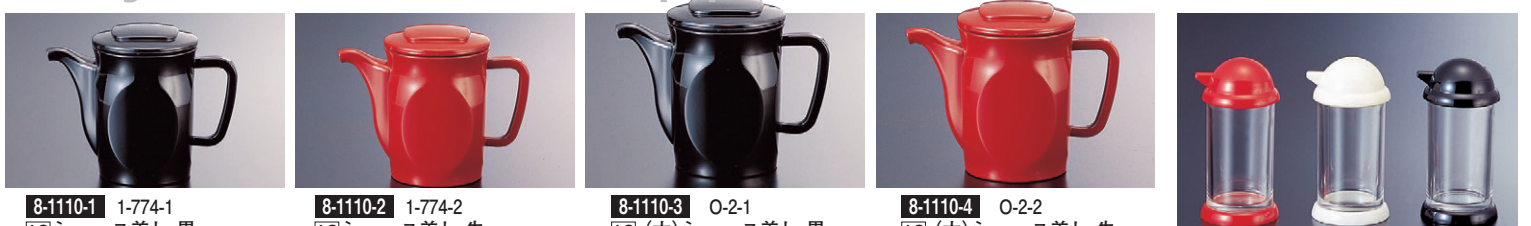
8-1110-1 1-774-1 ACショーユ差し 黒 ¥2,200 (11.5×6.2×9) 幅100 8-1110-2 1-774-2 ACショーユ差し 朱 ¥2,200 (11.5×6.2×9) 幅100 8-1110-3 O-2-1 AC (大)ショーユ差し 黒 ¥3,200 (15×8.4×12) 幅60 8-1110-4 O-2-2 AC (大)ショーユ差し 朱 ¥3,200 (15×8.4×12) 幅60