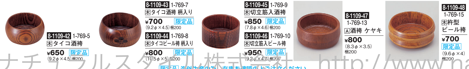
8-1109-42 1-769-5 困タイコ酒樽 ¥650 (限定品) (9.2φ×4.5) 幅200 8-1109-43 1-769-7 困タイコ酒樽 柄入り ¥700 (限定品) (9.2φ×4.5) 幅200 8-1109-44 1-769-8 困タイコビール樽 柄入り ¥800 (限定品) (11.5φ×5) 幅200 8-1109-45 1-769-9 困切立筋入酒樽 ¥850 (限定品) (7.8φ×4.6) 幅200 8-1109-46 1-769-10 困切立筋入ビール樽 ¥950 (限定品) (9.2φ×4.2) 幅200 8-1109-47 1-769-13 A酒樽 ケヤキ ¥800 (8.3φ×3.5) 幅200 8-1109-48 1-769-15 困杵型ビール樽 ¥700 (限定品) (9.6φ×4) 幅200