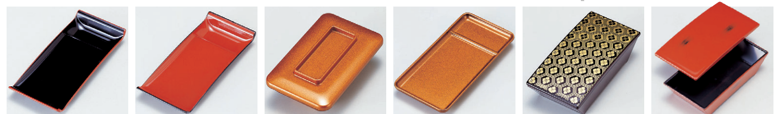
8-1109-1 1-767-1 Aのり皿 黒天朱 ¥850 (17.8×8×2.2) 幅100 8-1109-2 1-767-2 Aのり皿 朱天黒 ¥850 (17.8×8×2.2) 幅100 8-1109-3 1-578-2 Aのり入れ 梨地 ¥1,000 (13.8×8.6×4.4) 幅100 8-1109-4 1-767-4 M平型のり皿 (タレ付) 梨地 ¥830 (18.2×8.9×1.8) 幅100 8-1109-5 1-767-10 A舟型のり入れ 溜亀甲 ¥1,450 (14.5×7×3.8) 幅100 8-1109-6 1-767-6 A舟型のり入れ 根来 ¥1,150 (14.5×7×3.8) 幅100