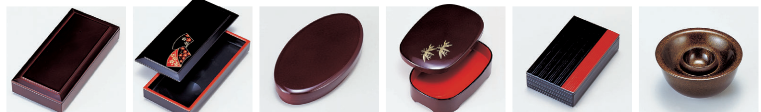
8-1109-13 1-767-14 A徳川のり入れ 溜 ¥1,300 (16×7.5×2.8) 幅100 8-1109-14 1-767-15 A徳川のり入れ 黒扇面 ¥1,350 (16×7.5×2.8) 幅100 8-1109-15 1-767-17 M小判型のり入れ 溜内朱 ¥1,400 (15.2×8.4×2.5) 幅100 8-1109-16 1-767-18 Mくつわ型のり入れ 溜内朱笹 ¥1,650 (13.6×7.2×3.5) 幅100 8-1109-17 1-767-19 困のり入れ 黒/朱 ¥2,280 (13.2×7.3×3.1) 幅100 8-1109-18 1-767-20 M玉子立て 梨地 ¥1,200 (11.3φ×5.3) 幅100