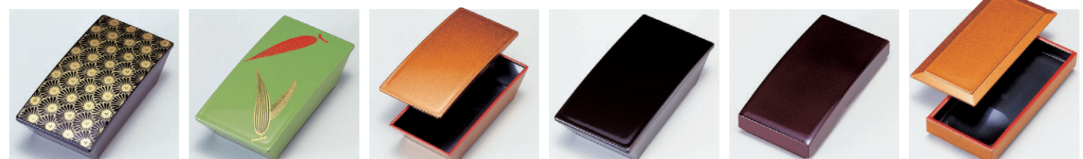
8-1109-7 1-767-7 A舟型のり入れ 菊詰 ¥1,200 (14.5×7×3.8) 幅100 8-1109-8 1-767-8 A舟型のり入れ モスグリーン笹 ¥1,250 (14.5×7×3.8) 幅100 8-1109-9 1-767-9 A舟型のり入れ 梨地 ¥1,050 (14.5×7×3.8) 幅100 8-1109-10 1-767-11 A舟型のり入れ マルーン天朱 ¥1,050 (14.5×7×3.8) 幅100 8-1109-11 1-767-12 M加伏のり入れ 溜内朱 ¥1,450 (13.9×6.7×2.8) 幅100 8-1109-12 1-767-13 A徳川のり入れ 梨地 ¥1,150 (16×7.5×2.8) 幅100