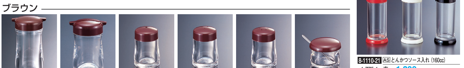
8-1110-13 1-774-8 ACソース入れ ブラウン ¥830 (6.4φ×13.5) 幅100 8-1110-14 1-774-9 ACしょう油入れ ブラウン ¥800 (6.4φ×11) 幅100 8-1110-15 1-774-10 ACヨーヅ入れ (1ツ穴) ブラウン ¥460 (4.4φ×7.3) 幅150 8-1110-16 1-774-11 AC塩入れ (3ツ穴) ブラウン ¥460 (4.4φ×7.3) 幅150 8-1110-17 1-774-12 AC胡椒入れ (6ツ穴) ブラウン ¥460 (4.4φ×7.3) 幅150 8-1110-18 1-774-13 ACカラシ入れ (ミニスプーン付) ブラウン ¥570 (6.1φ×4.8) 幅150