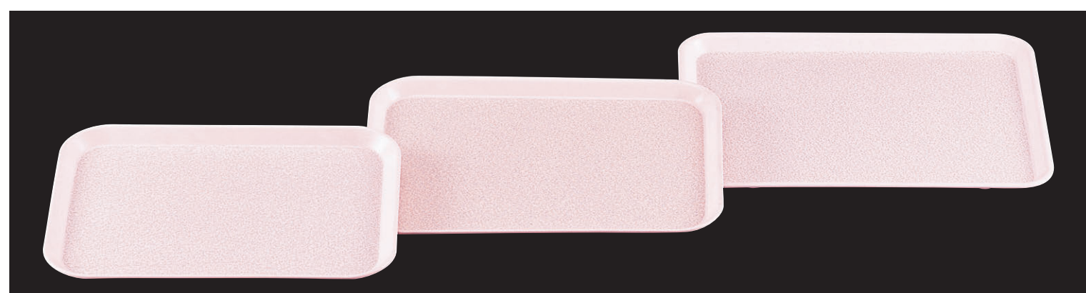
8-105-1 FRP (W-41N) 耐熱長角トレイ B-5-10 ピンクモスト ノンスリップ加工 ¥3,300 (41×30×2) 梱40 8-105-2 FRP (W-44N) 耐熱長角トレイ B-5-11 ピンクモスト ノンスリップ加工 WS ¥3,500 (43.5×32.5×2) 梱40 8-105-3 FRP (W-45N) 耐熱長角トレイ B-5-12 ピンクモスト ノンスリップ加工 ¥3,900 (45×35×2.1) 梱40