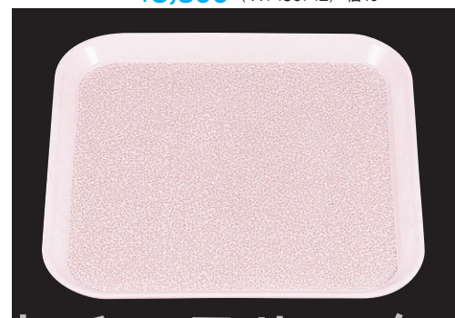
8-105-7 B-8-90 FRP (SS-33N) 耐熱角トレイ ピンクモスト ノンスリップ加工 WS ¥2,850 (33×33×2) 梱40