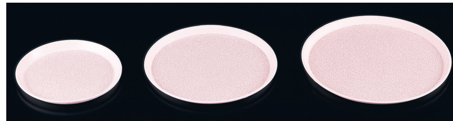
8-106-1 FRP (F-28) 耐熱丸トレイ B-4-61 ピンクモスト ノンスリップ加工 ¥3,000 (27.9φ×2) 梱50 8-106-2 FRP (S-35) 耐熱丸トレイ B-4-62 ピンクモスト ノンスリップ加工 ¥3,300 (35.3φ×1.7) 梱40 8-106-3 FRP (S-40) 耐熱丸トレイ B-4-63 ピンクモスト ノンスリップ加工 ¥3,900 (40φ×2) 梱30