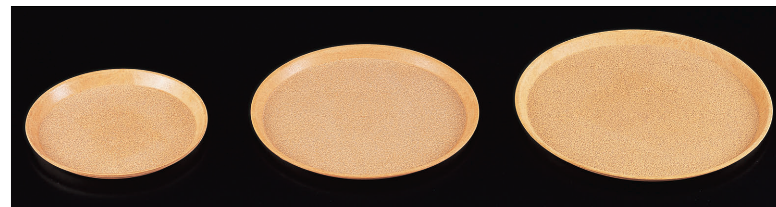
8-106-4 FRP (F-28) 耐熱丸トレイ B-4-64 ブラウンモスト ノンスリップ加工 ¥3,000 (27.9φ×2) 梱50 8-106-5 FRP (S-35) 耐熱丸トレイ B-4-65 ブラウンモスト ノンスリップ加工 ¥3,300 (35.3φ×1.7) 梱40 8-106-6 FRP (S-40) 耐熱丸トレイ B-4-66 ブラウンモスト ノンスリップ加工 ¥3,900 (40φ×2) 梱30