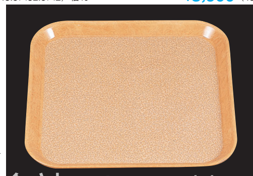
8-105-8 B-8-91 FRP (SS-33N) 耐熱角トレイ ブラウンモスト ノンスリップ加工 WS ¥2,850 (33×33×2) 梱40