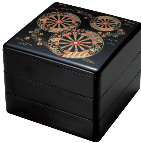
J7-22-5 7寸重 黒 御所車 (内黒) H-159-17 (21.2×21.2×16.5) 身の内寸 (20.3×20.3×4.5)