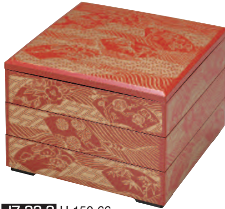
J7-22-2 H-150-66 7寸若菜重 朱 透かし波扇面 (内黒) (21.2×21.2×16.5) 身の内寸 (20.4×20.4×4.5)