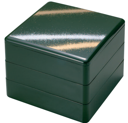
J7-22-6 7寸重 グリーン 銀河 (内黒) H-159-18 (21.2×21.2×16.5) 身の内寸 (20.3×20.3×4.5)