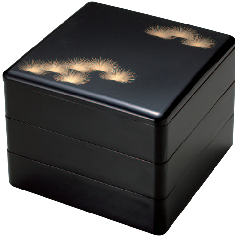
J7-22-4 7寸重 黒 若松 (内黒) H-159-16 (21.2×21.2×16.5) 身の内寸 (20.3×20.3×4.5)