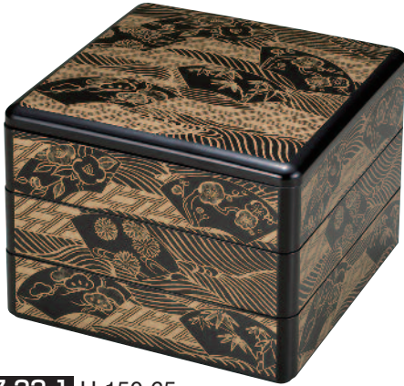
J7-22-1 H-150-65 7寸重 黒 透かし波扇面 (内黒) (21×21×16.5) 身の内寸 (20.3×20.3×4.5)