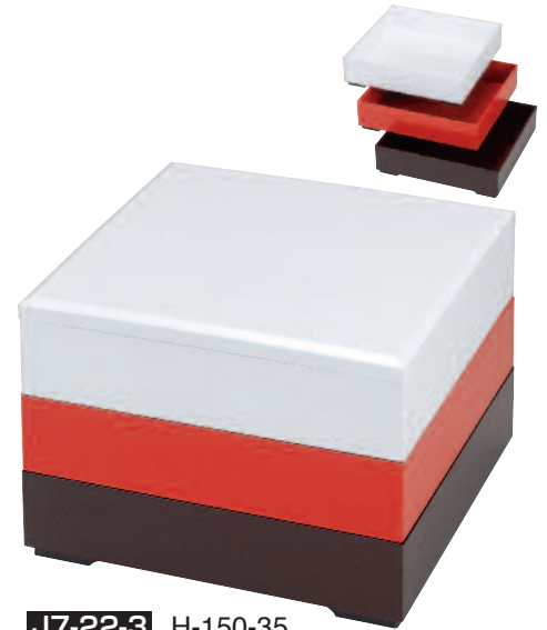
J7-22-3 H-150-35 7寸若菜重 三緞帳 (21.2×21.2×16.5) 身の内寸 (20.4×20.4×4.5)