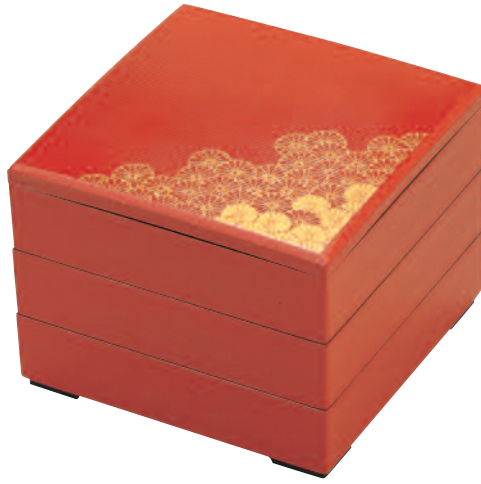
J7-20-2 7寸千筋重 朱 野菊 (内黒) H-159-2 (21.2×21.2×16.5) 身の内寸 (20.4×20.4×4.5) 2段 ¥1,800 3段 ¥2,420