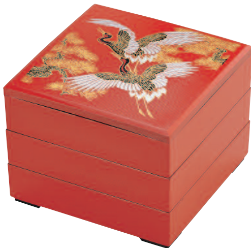
J7-20-4 7寸千筋重 朱 二羽鶴 (内黒) H-159-4 (21.2×21.2×16.5) 身の内寸 (20.4×20.4×4.5) 2段 ¥1,940 3段 ¥2,560