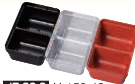
J7-20-9 H-158-42 7寸千筋重用中子 6個用ハーフ仕切 (10×6.7×4.1) 朱1個 ¥200 透明1個 ¥200 黒1個 ¥200