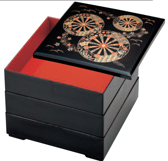
J7-20-6 7寸千筋重 黒内朱塗御所車 H-159-6 (21.2×21.2×16.5) 身の内寸 (20.4×20.4×4.5) 2段 ¥2,300 3段 ¥3,050