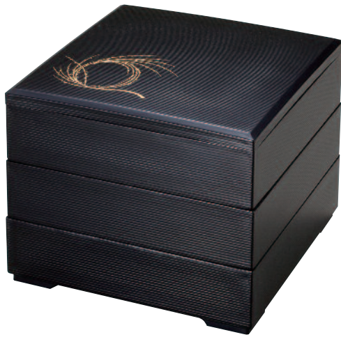
J7-20-1 7寸千筋重 黒 柳結び (内黒) H-159-1 (21.2×21.2×16.5) 身の内寸 (20.4×20.4×4.5) 2段 ¥1,800 3段 ¥2,420