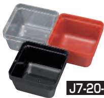
J7-20-7 H-158-28 7寸千筋重用中子 (ミニ) 9個用仕切 (6.7×6.7×4.1) 朱1個 ¥155 透明1個 ¥155 黒1個 ¥155