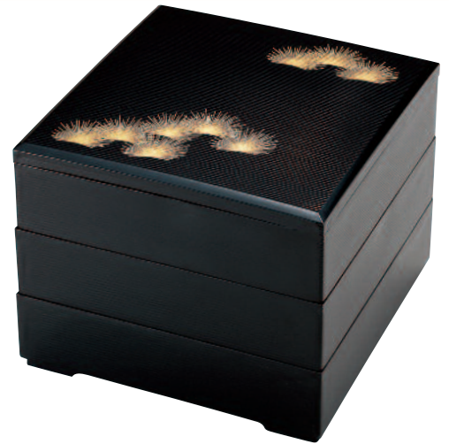
J7-20-3 7寸千筋重 黒 若松 (内黒) H-159-3 (21.2×21.2×16.5) 身の内寸 (20.4×20.4×4.5) 2段 ¥1,800 3段 ¥2,420