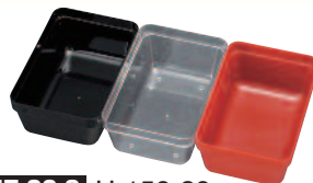
J7-20-8 H-158-29 7寸千筋重用中子 (小) 6個用仕切 (10×6.7×4.1) 朱1個 ¥170 透明1個 ¥170 黒1個 ¥170