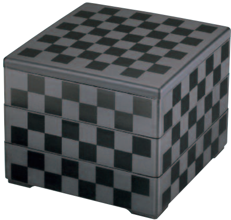
J7-2-4 6.5寸重 黒マット 市松 (内黒) H-153-45 (19.6×19.6×16.4) 身の内寸 (19×19×4.7) 2段 ¥1,750 3段 ¥2,380