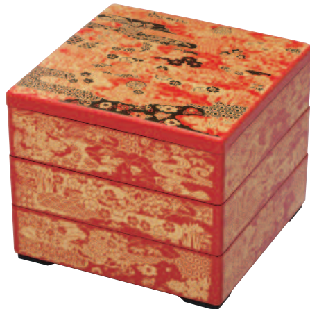
J7-2-8 6.5寸重 朱 友禅文様 (内黒) H-153-49 (19.6×19.6×16.4) 身の内寸 (19×19×4.7) 2段 ¥1,780 3段 ¥2,400