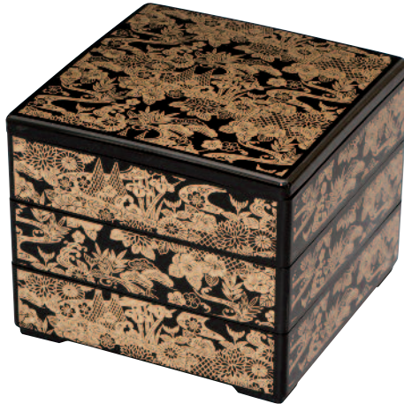
J7-2-5 6.5寸重 黒 紅型文様 (内黒) H-153-46 (19.6×19.6×16.4) 身の内寸 (19×19×4.7) 2段 ¥1,720 3段 ¥2,340