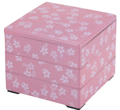
J7-2-9 6.5寸重 ピンク舞桜 (内黒) H-153-50 (19.6×19.6×16.4) 身の内寸 (19×19×4.7) 2段 ¥1,720 3段 ¥2,340