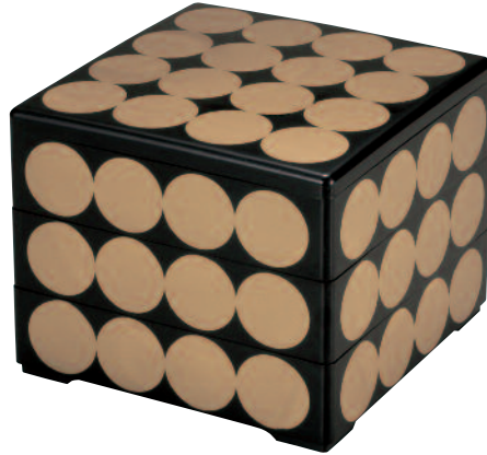
J7-2-2 6.5寸重 金円つなぎ (内黒) H-154-13 (19.6×19.6×16.4) 身の内寸 (19×19×4.7) 2段 ¥1,720 3段 ¥2,340