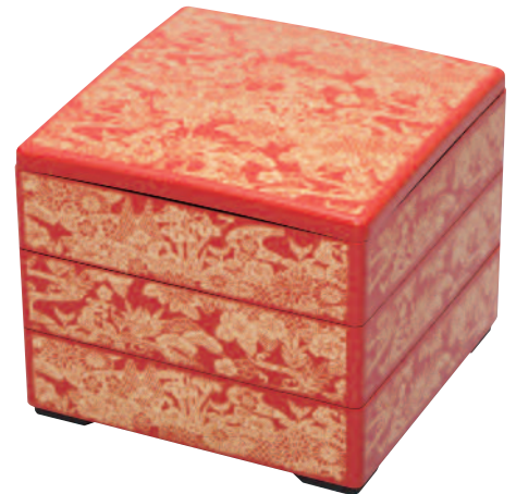
J7-2-6 6.5寸重 朱 紅型文様 (内黒) H-153-47 (19.6×19.6×16.4) 身の内寸 (19×19×4.7) 2段 ¥1,720 3段 ¥2,340