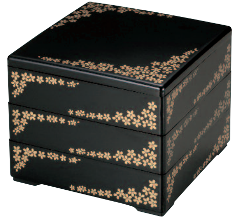
J7-2-3 6.5寸重 黒 市松桜 (内黒) H-154-14 (19.6×19.6×16.4) 身の内寸 (19×19×4.7) 2段 ¥1,720 3段 ¥2,340