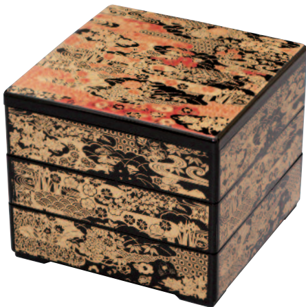
J7-2-7 6.5寸重 黒 友禅文様 (内黒) H-153-48 (19.6×19.6×16.4) 身の内寸 (19×19×4.7) 2段 ¥1,780 3段 ¥2,400