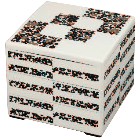
J7-1-3 6.5寸重 アイボリー コーラス (内黒) H-154-23 (19.6×19.6×16.4) 身の内寸 (19×19×4.7) 2段 ¥1,740 3段 ¥2,360