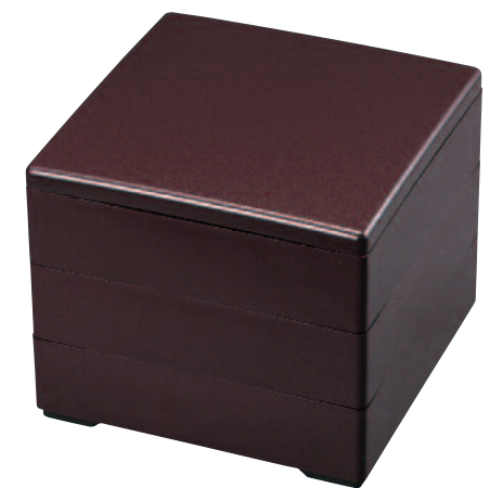
J7-1-9 6.5寸重 新乾漆 溜 (内黒) H-155-53 (19.6×19.6×16.4) 身の内寸 (19×19×4.7) 2段 ¥1,470 3段 ¥1,980