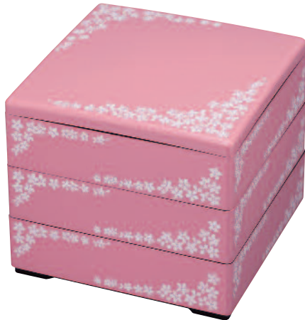
J7-1-4 6.5寸重 ピンク 市松桜 (内黒) H-154-24 (19.6×19.6×16.4) 身の内寸 (19×19×4.7) 2段 ¥1,720 3段 ¥2,340