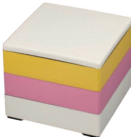
J7-1-7 6.5寸重 洋緞帳 (内黒) H-154-27 (19.6×19.6×16.4) 身の内寸(18.8×18.8×4.7) 蓋 アイボリー (内黒) ¥450 身 イエロー (内黒) ¥480 身 ピンク (内黒) ¥480 身 アイボリー (内黒) ¥480