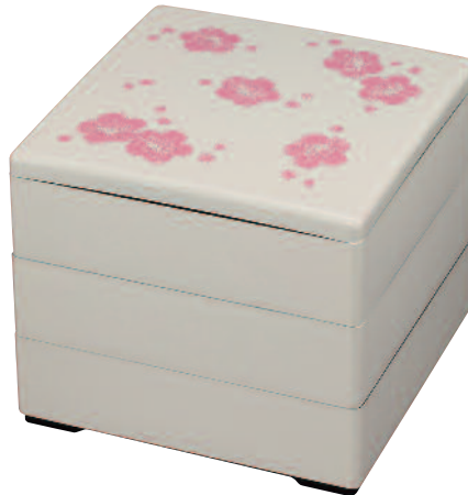
J7-1-5 6.5寸重 アイボリー 梅蝶 (内黒) H-154-25 (19.6×19.6×16.4) 身の内寸 (19×19×4.7) 2段 ¥1,440 3段 ¥1,920