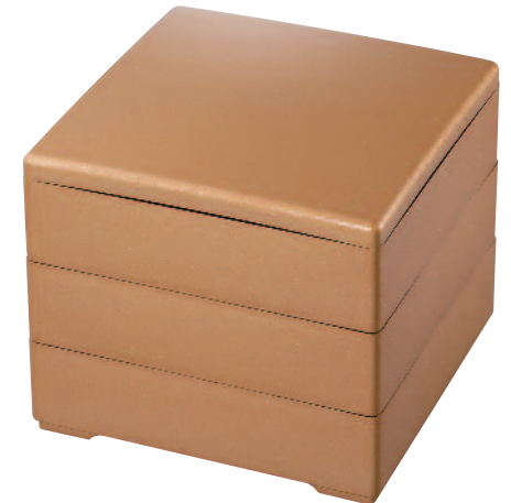
J7-1-6 6.5寸重 パールゴールド (内黒) H-154-26 (19.6×19.6×16.4) 身の内寸 (19×19×4.7) 2段 ¥2,350 3段 ¥3,170