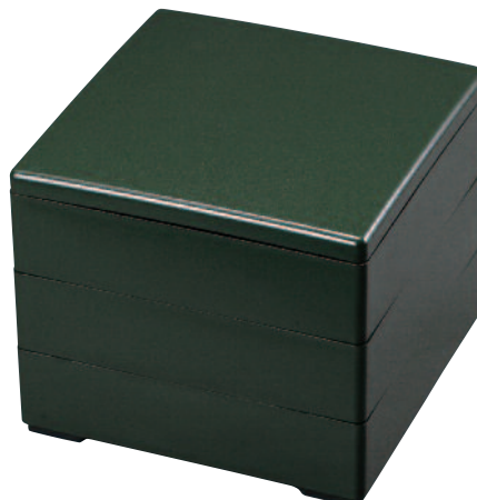
J7-1-8 6.5寸重 新乾漆 緑 (内黒) H-155-54 (19.6×19.6×16.4) 身の内寸 (19×19×4.7) 2段 ¥1,470 3段 ¥1,980