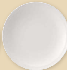
27900010 8.0皿 ¥2,400 D24.1×H3.6 OF