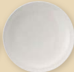
27900004 5.0皿 ¥780 D15×H2.6 OF