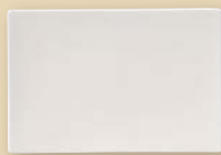
27900661 21cm焼物皿 ¥1,700 L21×S14×H2.2 OF