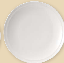
27900012 9.0皿 ¥2,900 D27.8×H4 OF