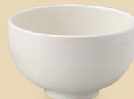
27900257 丸型5.0井 ¥2,000 D15.1×H9.1 OF