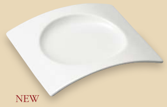
NEW 27900498 24cmアーチプレート ¥4,000 L23.1×S6.4×H2.6 IL20×IS5.4×IH1.9 OF