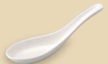
27900340 レンゲ ¥680 L15.1×S4.7 OF