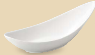
NEW 27900445 23cmななめペーカ ¥2,800 L23.2×S9.8×H8.2 OF