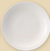
27900006 6.0皿 ¥1,150 D18.5×H2.8 OF