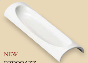
NEW 27900477 23cm前菜プレート ¥1,400 L23.1×S6.4×H2.6 IL20×IS5.4×IH1.9 OF