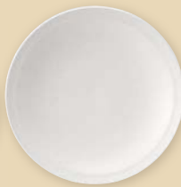
27900008 7.0皿 ¥1,300 D20.9×H3.3 OF