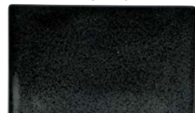
17500661 21cm焼物皿 ¥1,700 L21×S14×H2.2 OF