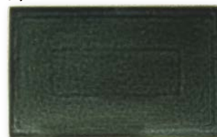
27800423 9.5長角皿 ¥4,900 L28.9×S18×H1.5 OF