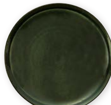
27800010 8.0皿 ¥2,600 D24.1×H3.6 OF