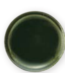
27800002 4.0皿 ¥700 D12.9×H2.2 OF