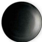
17500004 5.0皿 ¥780 D15×H2.6 OF