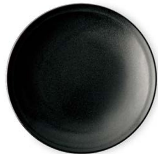
17500012 9.0皿 ¥2,900 D27.8×H4 OF