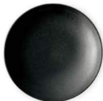
17500006 6.0皿 ¥1,150 D18.5×H2.8 OF