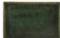
27800656 16cm串皿 ¥1,300 L15.8×S10.9×H1.8 OF