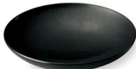
17500276 7.0めん皿 ¥1,900 D22.8×H5 OF