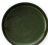
27800008 7.0皿 ¥1,400 D20.9×H3.3 OF