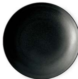
17500010 8.0皿 ¥2,400 D24.1×H3.6 OF