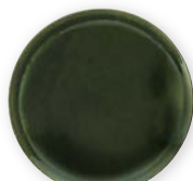
27800006 6.0皿 ¥1,250 D18.5×H2.8 OF