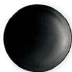
17500002 4.0皿 ¥650 D12.9×H2.2 OF

金属を彷彿とさせる繊細で複雑な質感は、釉薬の結晶がもたらす不思議な魅力。その存在感は、料理をモダンに際立たせます。