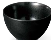
17500250 11cmカフェ丼 ¥1,200 D11.1×H7.4 OF