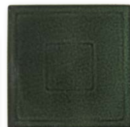
27800386 8.0正角皿 ¥4,300 D23.7×H1.8 OF

※釉薬の性質上商品の色合いが異なる場合がございます。品質を損なうものではありませんので、ご了承ください。