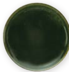
27800004 5.0皿 ¥850 D15×H2.6 OF