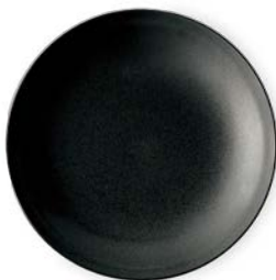
17500008 7.0皿 ¥1,300 D20.9×H3.3 OF