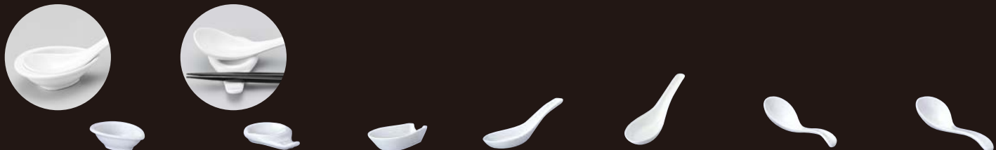
21700352 玉レンゲ台(小) ¥680 L9.2×S6.4×H2.7 RF (特白磁) 21700351 兼用レンゲ台 ¥650 L9.2×S5.6×H1.5 RF (特白磁) 21700350 レンゲ台 ¥680 L9.1×S5.5×H2.2 RF (特白磁) 21700340 レンゲ ¥650 L14.8×S4.6 RF 21700348 レンゲ(小) ¥550 L13.9×S4.2 RF 21700341 引っ掛けスーブレング ¥650 L14.2×S4.4 RF 21700344 どんぶりレンゲ ¥730 L16.4×S4.6 RF