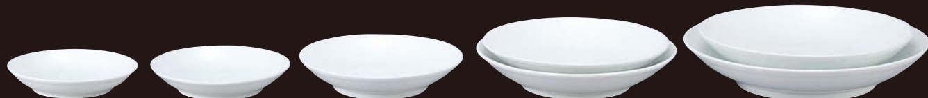
21700090 7"フカヒレ皿 ¥1,550 D19.2×H3.6 RF 21700091 8"フカヒレ皿 ¥2,100 D20.8×H3.9 RF 21700093 9½"フカヒレ皿 ¥3,700 D24.3×H5 RF 21700095 10½"フカヒレ皿 ¥4,400 D27.4×H5.4 RF 21700097 11½"フカヒレ皿 ¥7,300 D29.7×H5.6 RF 21700099 12½"フカヒレ皿 ¥10,100 D31.7×H6.2 RF 21700102 14"フカヒレ皿 ¥15,500 D36.1×H6.7 RF