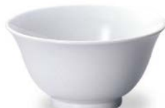
37800270 6.5反深口井 ¥2,200 D20.3×H10.7・1670cc RF