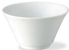
37800265 6.0深口切立井 ¥2,000 D19×H10.7・1380cc RF