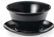
37815262 37815059 6.0反深口井 めん井受皿 (黒ゆず) (黒ゆず) ¥2,400 ¥1,150 D18.3×H9.6 OF D21×H2.5 ID11 OF