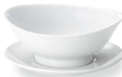
NEW 58700059 宝生 めん井受皿 ¥1,600 D21×H2.5 ID11 OF