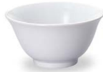
37800262 6.0反深口井 ¥1,850 D18.5×H9.6・1260cc RF