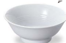
37800280 7.0反計量井 ¥1,500 D21.3×H8.6 RF