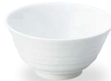
37800184 手引き6.0反深口井 ¥1,900 D18.5×H9.4・1320cc RF