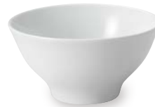
37800277 37800059 7.0たわみ井 めん井受皿 ¥2,100 ¥800 L21.6×S20×H8.5 RF D21.2×H2.3 ID11 RF