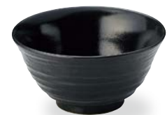
37815184 手引き6.0反深口井 (黒ゆず) ¥2,700 D18.5×H9.4・1320cc OF