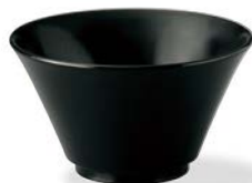
37815265 6.0深口切立井(黒ゆず) ¥2,700 D18.7×H10.7 OF