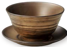
NEW 58700184 宝生 手引き6.0反深口井 ¥3,800 D18.5×H9.4・1320cc OF