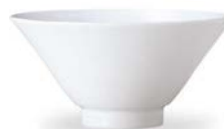
37800308 7½"深口ラーメン (強化セラミック) ¥2,300 D19.6×H9.6・1050cc RF