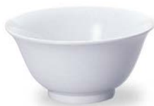
37800304 7"反深口井 (強化セラミック) ¥2,400 D18.2×H9.4・1150cc RF