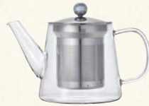
ティーポット ステン H-8592 ¥3,800 88592 0

最大168-106 高123 容500 箱サイズ:長159×幅112×高127 フィルター/ステンレス(中国) 1×18=18p/c入 耐熱温度差120度 ・ハンドメイド