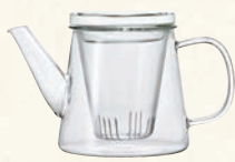
ティーポット H-8591 ¥3,000 88591 3

最大168-106 高109 容500 箱サイズ:長159×幅112×高127 1×18=18p/c入 耐熱温度差120度 ・ハンドメイド