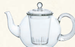
ポットM F-37491 ¥3,500 37491 2

最大189-115 高124 容500 箱サイズ:長203×幅125×高142 1×18=18p/c入 耐熱温度差120度 ・ハンドメイド