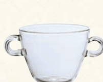
カフェオレ ※F-37508 ¥1,600 37508 7

ハンドルを持ったときにギャザー(筋入り)が手に馴染み滑りなくなっています。その上、太めで持ちやすく、安心して使ってもらえます。