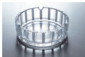
リリーフ灰皿 P-6296 ¥260 36296 4 最大102 高34 6×12=72p/c入 JAN