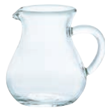
ミルクピッチャーつぼM H-4749 ¥900 48749 0 最大55 口40 高64 容80 6×16=96p/c入 ・ハンドメイド 耐熱ガラス