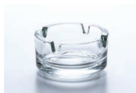
54126灰皿 H-3587 ¥200 38587 1 最大72 高38 6×12=72p/c入 ・トルコ