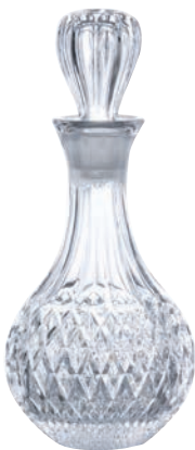
NT1002デカンタ NT1002 ¥6,500 77086 8 高265 容720 1×8=8p/c入 ・ハンドメイド クリスタル