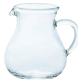
ミルクピッチャーつぼL H-4750 ¥1,000 48750 6 最大63 口46 高71 容120 6×12=72p/c入 ・ハンドメイド 耐熱ガラス