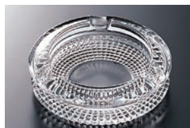
スターダスト (小) F-70570 ¥1,550 70570 9 最大116 高32 1×48=48p/c入 ・ハンドメイド クリスタル