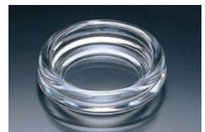
モントレー灰皿 P-6402 ¥380 36402 9 最大110 高26 1×72=72p/c入