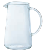
ミルクピッチャー台形M H-4752 ¥900 48752 0 最大48 口37 高77 容80 6×16=96p/c入 ・ハンドメイド 耐熱ガラス